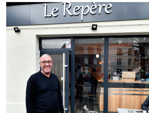
Le Repère, 10 rue de Harlay, bar-brasserie.