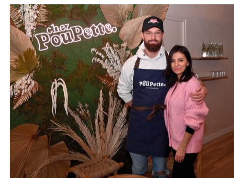
Chez PouPette, 39 rue Saint-Cornelle, restauration sur place et vente à emporter.