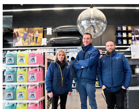
Centre Norauto Compiègne, 4 rue du Fonds Permant, vente de produits autour de la voiture, vélos, scooters.