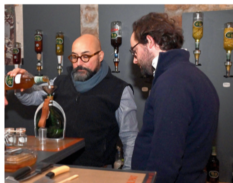
L'Atelier de la route du rhum, 12 rue des Cordeliers, vente et atelier de conception de rhum arrangé.