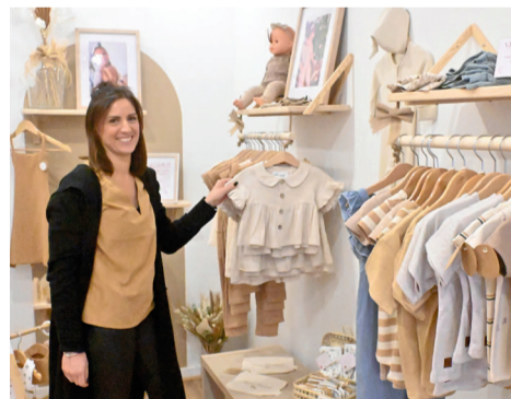
Les Caprices de Luna, 42 rue des Trois Barbeaux, vêtements et accessoires de puériculture.