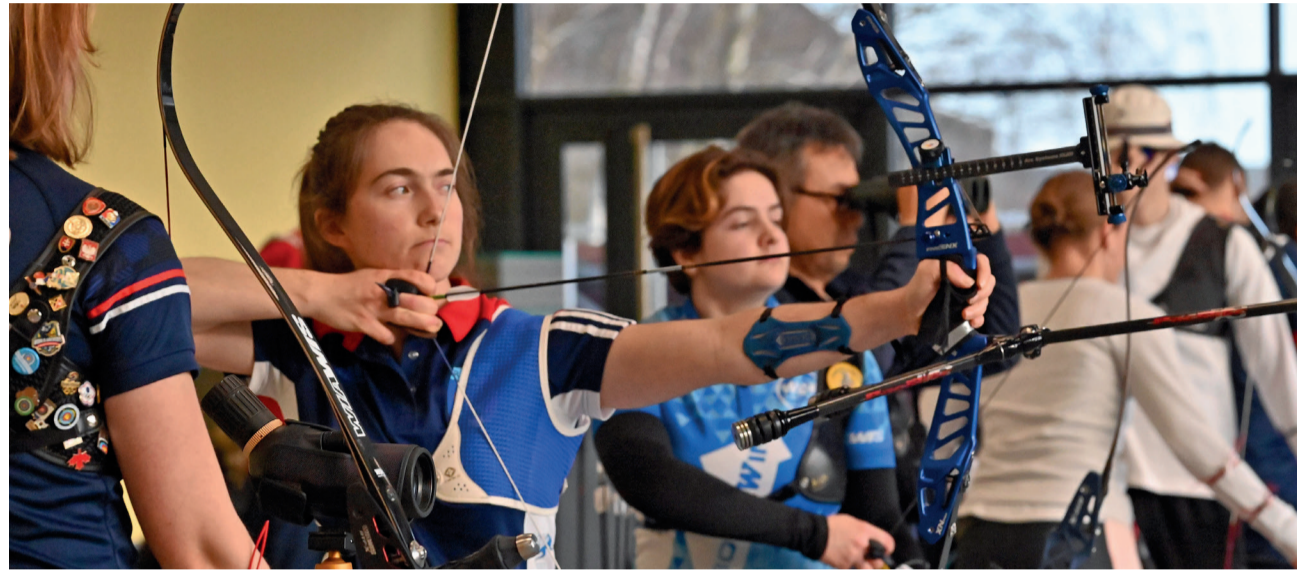
Les équipes de France de tir à l'arc et de basket 3x3 bénéficient des équipements sportifs récemment rénovés en vue des JO 2024.

Co-directeur de la publication : Philippe Marini - Co-directeur de la publication : Françoise Trousselle Réalisation : Service communication (Ville de Compiègne) - Photographes : Edouard Bernaux / Richard Dugovic / Jonathan Coelho / DR Impression : Imprimerie de Compiègne - Régie publicitaire : LVC Communication - Tél. 06 11 59 05 32