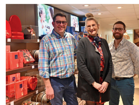
Léonidas chocolate café, 8 rue des Pâtisiers, boutique de chocolats, salon de thé et espace de coworking.