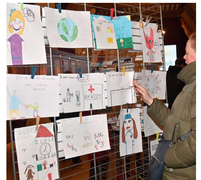
Elèves et enseignants des écoles Augustin Thierry, Hersan, Pompidou A et B, Robida B, Saint-Lazare, Sévigné, la classe de 6 ème projet de Jean-Paul II et un groupe du DITEP du Meux ont pris part à ce beau projet dans le cadre de l'ECSI (Éducation à la Citoyenneté et la Solidarité Internationale).

Suite à ces rencontres, des échanges épistolaires et en visio conférence ont commencé entre des élèves du Cambodge et la classe de CM1 de Pompidou B et entre des élèves du Bénin et la classe de 6 ème projet de Jean-Paul II. D'autres beaux projets sont en perspective.