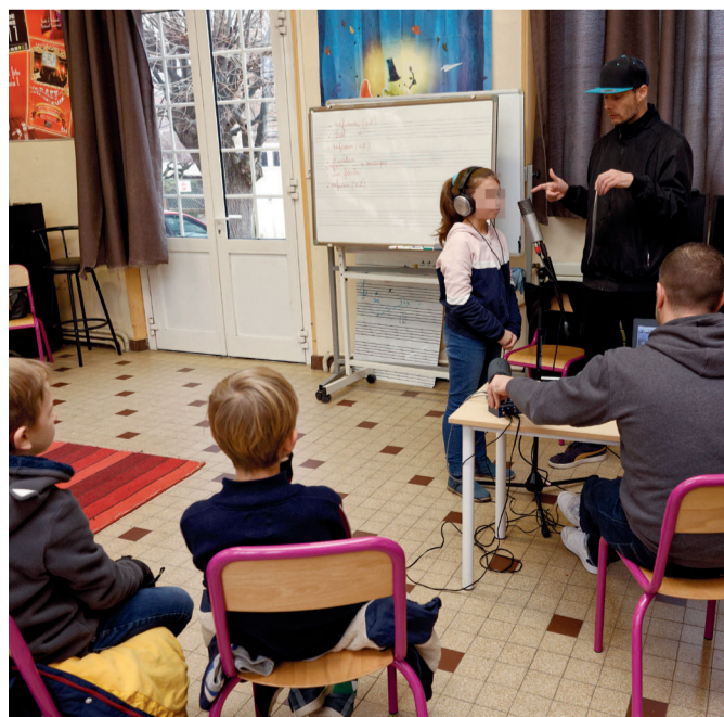
Nouvel R, collectif pluridisciplinaire en résidence, propose des ateliers pédagogiques dans les territoires.

Dans l'Agglomération de la Région de Compiègne, les ateliers proposés par Nouvel R ont bénéficié à 130 élèves du 1 er degré, 175 élèves du 2 nd degré, 20 étudiants, 30 adultes et 50 personnes âgées en EPHAD.