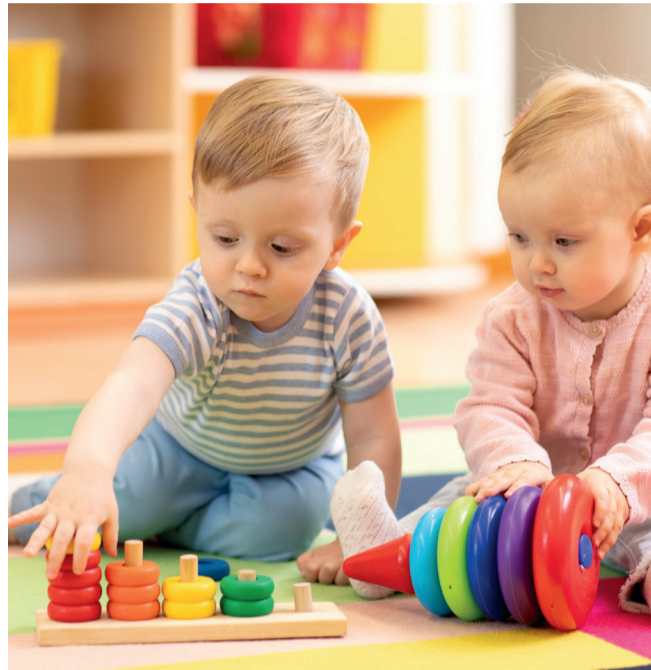
Forum Petite enfance Samedi 4 mars, de 14h à 18h, au Centre de rencontres de la Victoire Entrée gratuite

Certaines associations proposant des activités sportives ou culturelles pour les tout-petits, club de gym pour les bébés, les Bébés nageurs, le Pôle équestre du Compiégnois, Grandir Ensemble ou encore la VGA qui organise des parcours d'athlétisme pour favoriser la motricité des bébés et des très jeunes enfants pourraient également y prendre place.