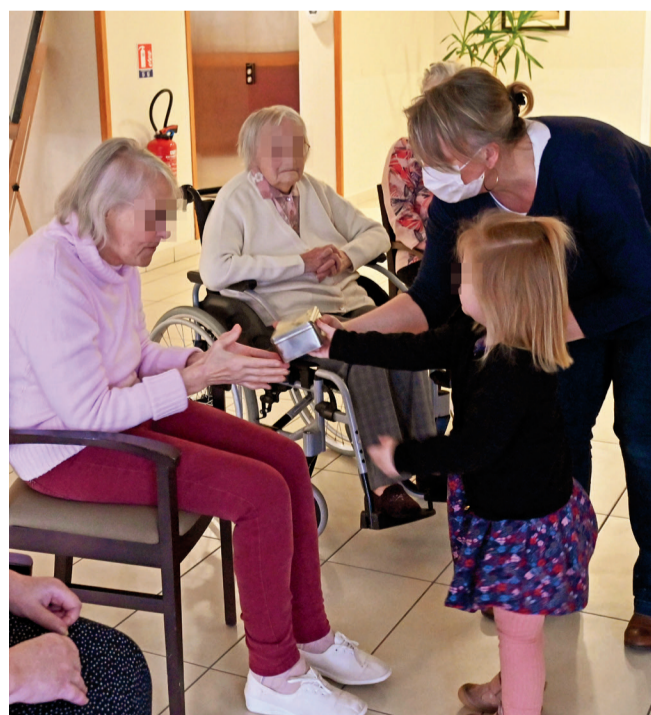
Six résidents de l'EHPAD Carpe Diem et quatre enfants de la crèche multi-accueil Le Nid partagent tous les 15 jours des moments de convivialité, à la plus grande joie des petits et des grands.

tendresse, d'un cadre rassurant qui favorise l'autonomie,... et sur ce qu'ils peuvent s'apporter mutuellement. C'est aussi un vecteur de transmission des savoirs et d'enrichissement mutuel.