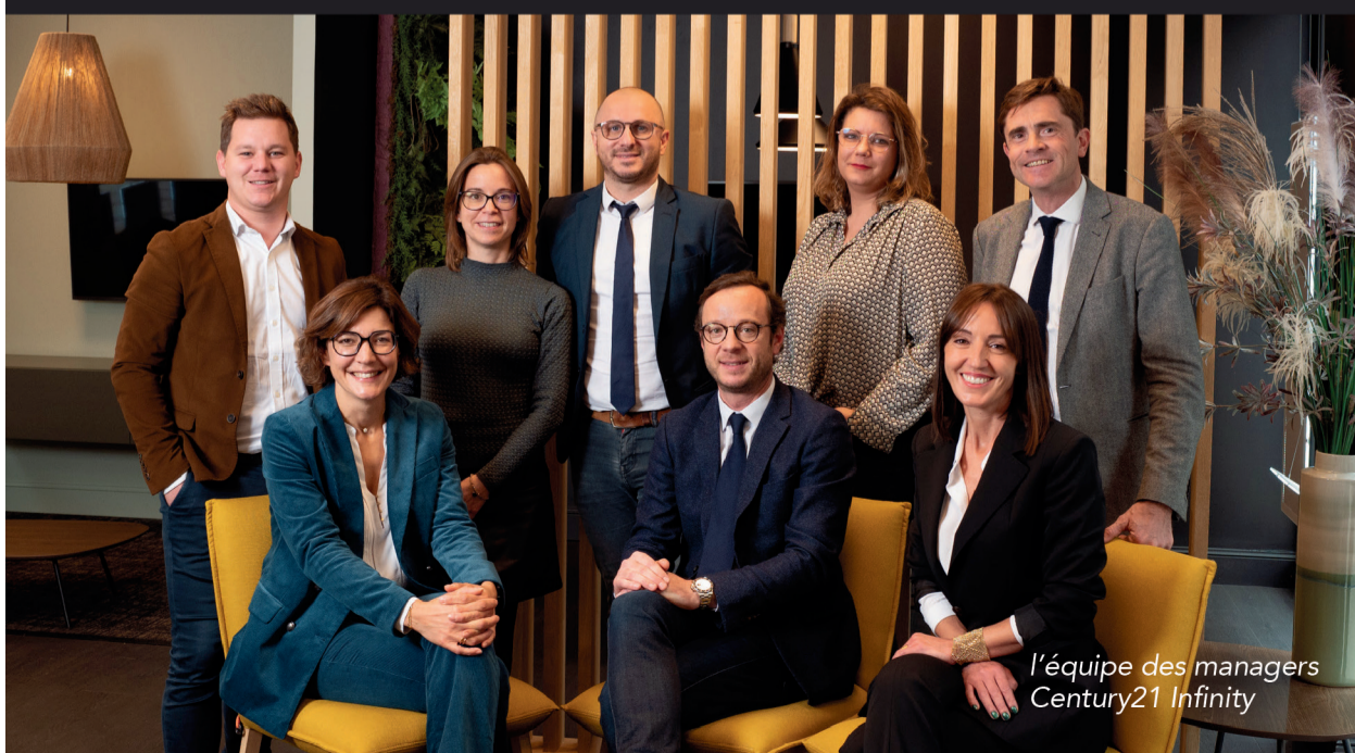
l'équipe des managers Century21 Infinity