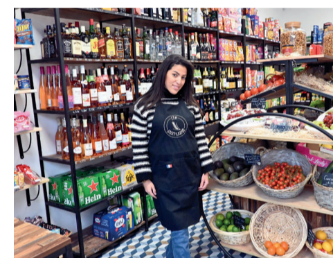
L'Epi Saint-Lazare, 42 rue Saint-Lazare, épicerie.