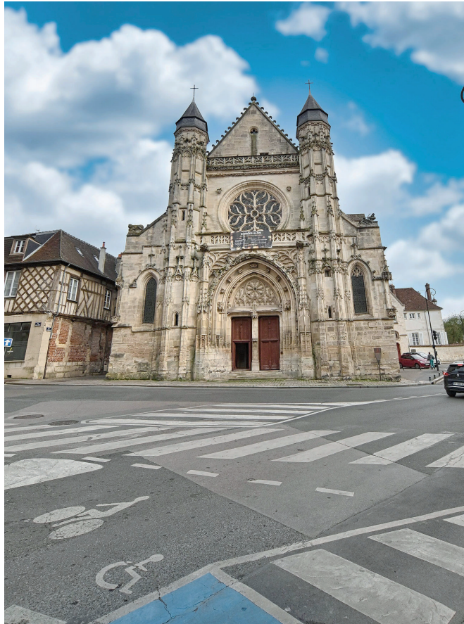
Edifice de style gothique flamboyant, l'église Saint-Antoine fondée en 1199 a été profondément transformée au XVI e siècle puis restaurée au XIX e siècle.

Le parvis de l'église Saint-Antoine va bénéficier d'importants travaux cet été. Ces aménagements visent à sécuriser les traversées piétonnes tout en mettant en valeur le patrimoine bâti.