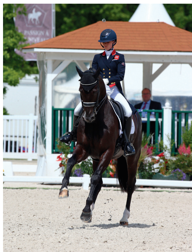
CDIO Compiègne 2021 - Charlotte Fry &amp; Dark Legend

Onze ans après leur création, les Internationaux de dressage de Compiègne réuniront, du 19 au 22 mai 2022, au stade équestre du Grand Parc, les meilleurs couples mondiaux de la discipline. Étape de la Coupe des Nations FEI, circuit qui rassemble les plus gros concours au monde, le rendez-vous isarien promet du grand sport mais aussi beaucoup d'émotions avec cette année, en clôture du concours, le formidable spectacle de chevaux en liberté de Jean-François Pignon.