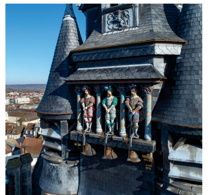
Les Picantins représentent les trois ennemis de la Ville à la fin du XV e siècle : l'Anglais (nommé Langlois, en rouge), l'Allemand (Lansquenet, en vert) et le Flamand (Flandrin, en bleu).

Pour contribuer à cette rénovation, il suffit de remplir le bulletin de soutien que vous pouvez télécharger sur le site : www.agglo-compiegne.fr , et de le retourner par courrier à : Simon Moulu, Directeur de Cabinet du Maire - Hôtel de Ville - 60200 Compiègne.