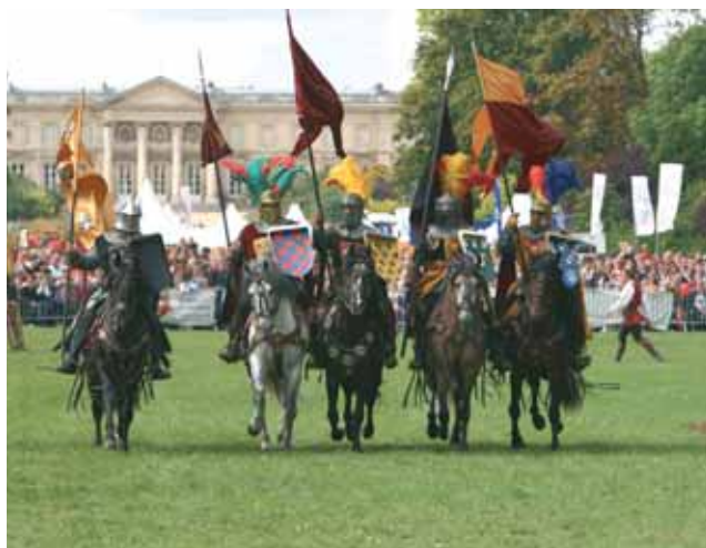
La troupe de Mario Luraschi présentera son nouveau spectacle.

maux picards : quizz sur la faune sauvage, ses habitats et la nature. Des lots seront à gagner.