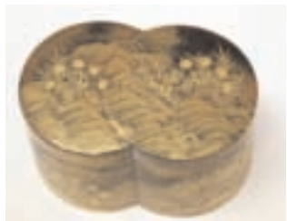
Boîte en laque, collection du Musée Vivenel.

Impressions japonaises - Décors et objets précieux Espace culturel Saint-Pierre des Minimes