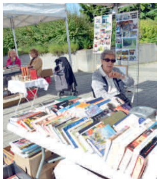
Le Quartier des Jardins s'expose aux Jardins du livre.

L'Amicale du quartier des Jardins organise le dimanche 18 septembre sa 7 e édition des "Jardins du livre".