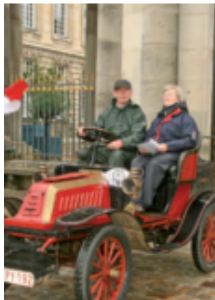
Le Rallye des Ancêtres vivra une nouvelle édition les 8 et 9 octobre.

voyage dans le temps avec en prime le plaisir des yeux.