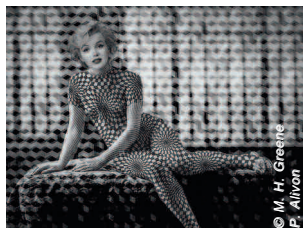
© M. H. Greene F. Allivon

Update Marilyn Compagnie Principe Actif Espace Jean Legendre - Compiègne