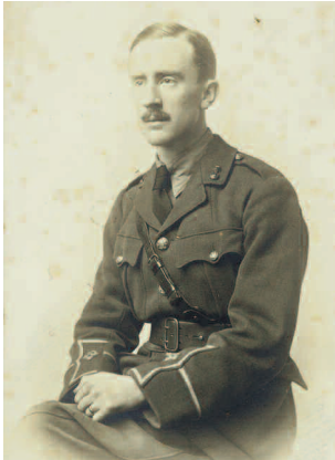
Tolkien in officer's uniform, 1916 Bodleian Library, MS. Tolkien photogr. 4, fol. 33 - © in digital image : The Tolkien Estate Limited