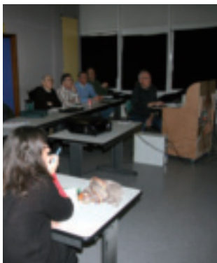
Le CVMARC (Club Vidéo Multimédia de l'Agglomération de la Région de Compiègne)

vous convie à sa "soirée Portes ouvertes" le 25 novembre, de 18h à 20h, au local du club (Espace du Puy du Roy, rue Charles Faroux, 1 er étage, salle 104), afin de vous présenter ses activités (prises de vue, films à scénario, montage vidéo-informatique, formations de niveaux "débutant" et "avancé" aux logiciels de montage vidéo Studio, Magix et Adobe et au logiciel de retouche photo Photoshop,...), et de vous montrer quelques-uns des films réalisés par le club. Rens. au 03 44 20 19 61.