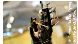
© Guitare Basse Flying Snake de G. Alloro

Espace Saint-Pierre des Minimes - Compiègne