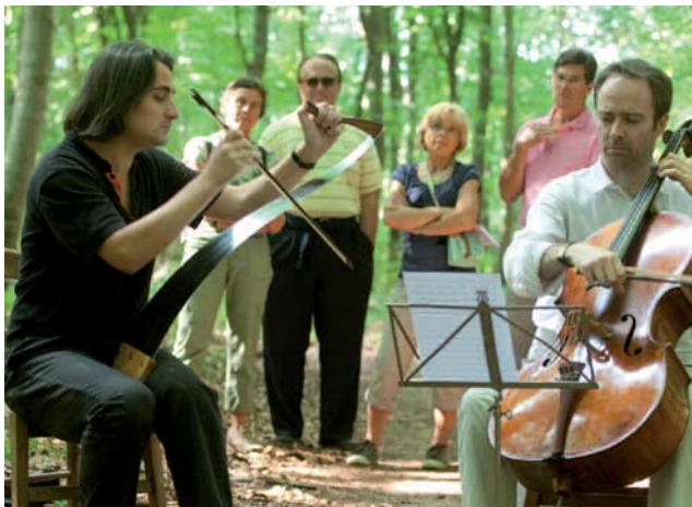
Photo Festival des Forêts