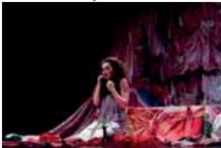
La Voix humaine © Laurent Lagarde