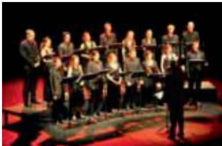
Noël a cappella