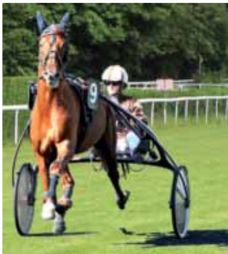
Parmi les courses, figure le Prix de l'ARC.

Le samedi 7 juillet sera jour de fête sur l'Hippodrome du Putois. Parmi les huit courses de trot au programme figure le Prix de l'ARC.