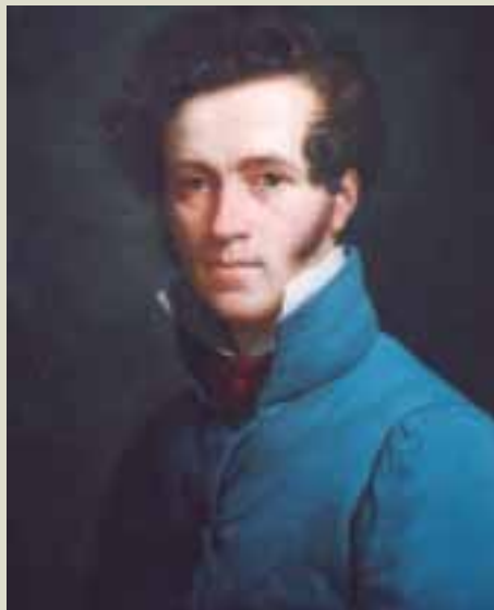
Jean-Julien Deltit, Autoportrait.

Pour les enfants de 6 à 12 ans 6 euros de participation aux frais de matériel Maximum 10 enfants par séance Renseignements et réservations : Musée Antoine Vivenel 2, rue d'Austerlitz - Compiègne - Tél. : 03 44 20 26 04