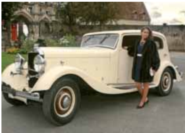
Les 4 et 5 août, Compiègne vivra son premier week-end de l'élégance.

Le dimanche, c'est l'Hippodrome du Putois qui sera au