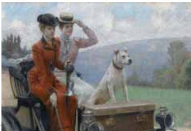
Les Dames Goldsmith au bois de Boulogne en 1897 sur une voiturette Peugeot, Stewart Julius Leblanc, huile sur toile 1901.