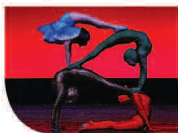
© Francette Leviaux et Michel Lidvac

DE LÉONID ANDREÏEV L'UNIJAMBISTE - MISE EN SCÈNE DAVID GAUCHARD COMPAGNIE EN RÉSIDENCE À L'ESPACE JEAN LEGENDRE THÉÂTRE - MA 4 FÉVRIER À 20 H 45 | DÈS 16 ANS UNE COPRODUCTION DE L'ESPACE JEAN LEGENDRE