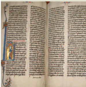
Manuscrit VDC 241 Fragment de Bible contenant les Prophètes (partie), les Epîtres de Saint Paul, Les Actes des apôtres, L'Apocalypse - Date début du XIV e siècle - Support parchemin

→ Exposition "D'une tablette à l'autre, 5000 ans d'écriture dans les collections compiègnoises".