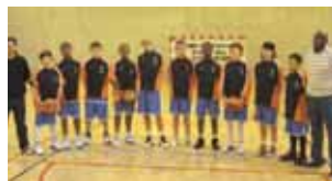
La sélection de l'Oise mascu- line, retenue pour le Tournoi Zone Nord.

Du 20 au 22 décembre, Compiègne accueillera le Tournoi zone nord des moins de 13 ans. Ouvert aux garçons et filles des régions Nord,