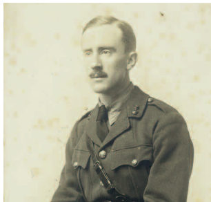
Tolkien in officer's uniform, 1916 Bodleian Library, MS. Tolkien photogr. 4, fol. 33

Bibliothèque Saint-Corneille - Compiègne