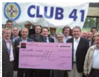
Le Club 41 se mobilise en faveur des enfants.