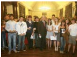
La médaille du bachelier ▶ est remise aux élèves ayant eu une mention Très bien au Bac.