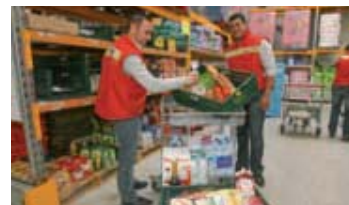
Chronodrive, 4 rue Ferdinand de Lesseps.