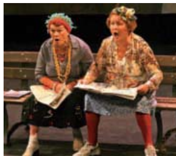
Rire et humour une fois de plus à l'honneur, lors du spectacle de fin d'année offert par les acteurs de l'atelier théâtre des aînés.