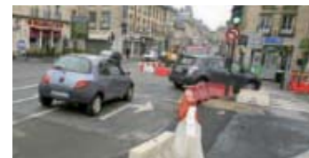
Les véhicules peuvent désormais emprunter le tourne à gauche depuis la rue Solferino en direction de la rue de Harlay ainsi que depuis le pont Solferino en direction du Cours Guyonmer.