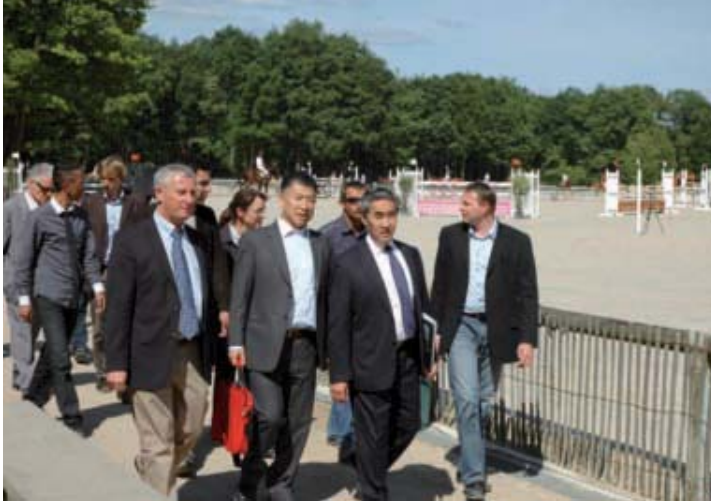
Grâce à leurs équipements sportifs performants, les villes de Beauvais et Compiègne sont candidates à l'accueil d'équipes préparant les Jeux Olympiques de Londres. La délégation chinoise s'est d'ores et déjà montrée intéressée.

A un an des Jeux Olympiques de Londres, Compiègne et Beauvais ont reçu une délégation d'officiels chinois à la recherche de sites d'entraînement.