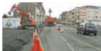
Création d'un giratoire rue de Beauvais et aménagement des rampes d'accès au nouveau pont urbain.