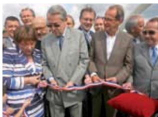
Un nouveau barrage sur l'Oise ▶ entre Compiègne et Venette.