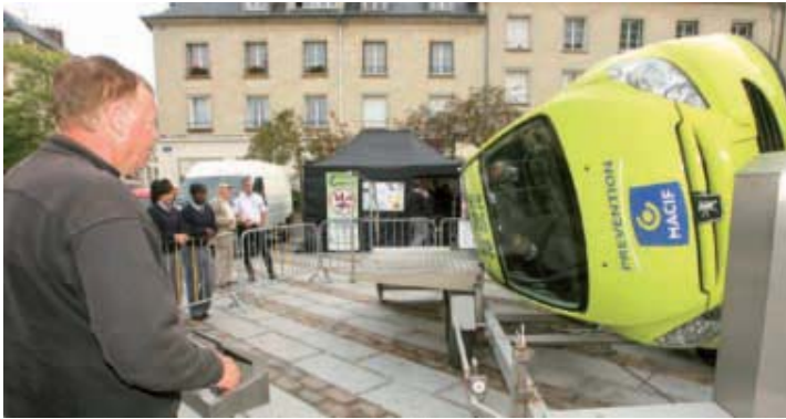
La place du Marché puis les rues Napoléon et de l'Abbaye accueilleront stands et animations pour la Semaine de la Sécurité Routière.

C'est un rendez-vous annuel fort utile. En septembre la Semaine nationale de la Sécurité Routière permet de sensibiliser les jeunes aux dangers de la route et surtout de les conseiller efficacement pour les éviter. C'est une fois encore la place du Marché qui accueillera cette manifestation les 29 et 30 septembre avec des prolongations jouées le 1 er octobre dans les rues piétonnes Napoléon et de l'Abbaye. Au programme, la conduite au guidon d'un scooter, la plaque