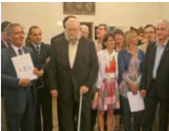
Les Lions clubs se sont unis pour remettre trois chèques à des actions locales.