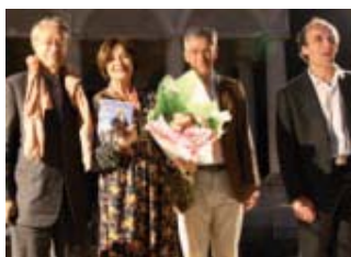
◀ Les Promenades musicales avec Julia Migenes et Macha Meril.