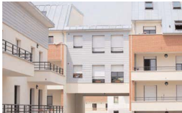
De nouveaux logements sociaux sont créés chaque année. Ici, la résidence Le Prince, avenue de l'Europe, sur la ZAC du Camp de Royallieu.

Pour bénéficier d'un logement social, vous devez en faire la demande auprès du service logement de l'Agglomération de la Région de Compiègne ou auprès des bailleurs.