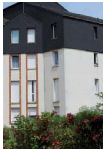
La résidence du Puy d'Orléans

Service logement de l'ARC Annexe de l'Hôtel de Ville de Compiègne Tél. 03 44 40 76 01 service.logement@agglo-compiegne.fr