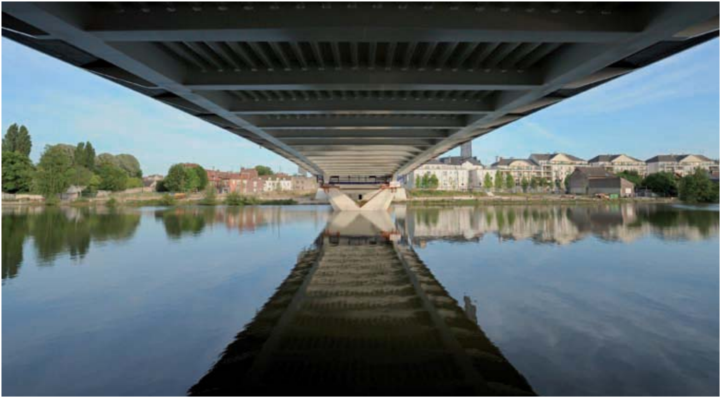
Le Pont neuf sera ouvert à la circulation dès le lundi 12 septembre.