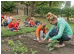
Vacances "découverte" ▶ pour les petits qui ont fréquenté cet été les centres aérés de la ville.