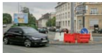
Un carrefour giratoire est réalisé à l'intersection des rues d'Amiens et de Noyon.