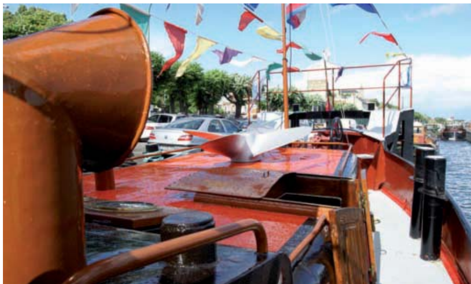
Le bateau-remorqueur, le Triton 25, sera à quai rue James de Rothschild et visitable gratuitement tout comme le bateau pompe.

Concerts, théâtre, jonglage avec les associations des étudiants de l'UTC