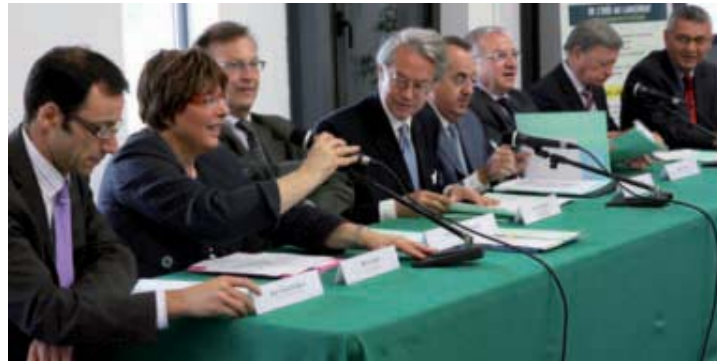
L'ARC, partenaire du projet PIVERT, un dispositif régional et national stratégique pour le développement des bioraffineries du futur.

A l'entrée, du colza et du tournesol. A la sortie, des matériaux pour l'emballage ou le bâtiment. P.i.v.e.r.t (Picardie Innovations Végétales, Enseignements et Recherches Technologiques) sera une bioraffinerie pilote qui permettra de créer des produits chimiques en utilisant en totalité des plantes, déchets compris. Dans cette approche, chaque composant de la plante est extrait puis transformé par différents procédés pour fabriquer des produits pour l'alimentation et la santé, des produits pour la chimie et la cosmétique, des biomatériaux, ... les éventuels résidus étant valorisables sous forme de biocarburants ou de biocombustibles.