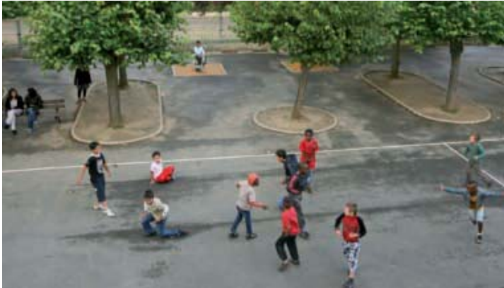
Vive la rentrée des classes !

Parce que la rentrée des classes est pour chacun, enfants, parents, enseignants, un moment important, la Ville de Compiègne a cette année encore mis les petits plats dans les grands pour que tout se déroule au mieux. Le restaurant scolaire Hélène Brault sera officiellement inauguré le 9 septembre prochain.