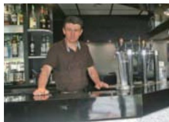
Bar Brasserie Le Carré Latin, 8 place du Marché aux-Herbes.