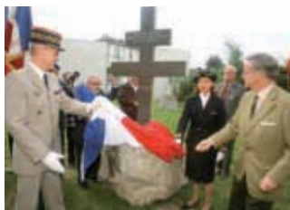
◀ Une stèle en hommage aux jeunes résistants est inaugurée sur le site du Mémorial.