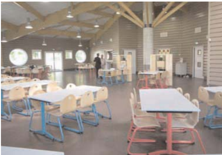
Le restaurant scolaire Hélène Brault sera inauguré le 9 septembre.

vitrage. Les groupes scolaires Saint-Lazare et Pompidou, les écoles élémentaires Hersan et de Royallieu, l'école maternelle Augustin Thierry ont pour leur part bénéficié de travaux d'électricité. Les alarmes anti-intrusion ont également été changées dans certains établissements scolaires et crèches. Montant des travaux réalisés : 269 573 euros.