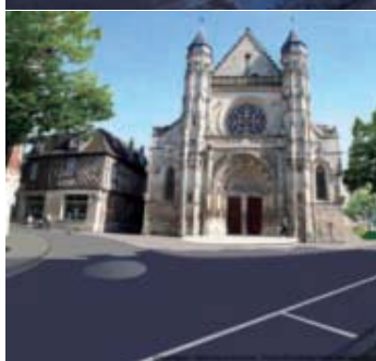
La Place Saint-Antoine avant et après travaux.