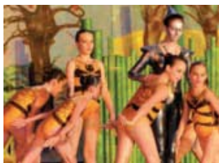
Succès pour le Magicien d'Oz ▶ spectacle de natation synchronisée proposé par Jeunesse Natation Compiègne.