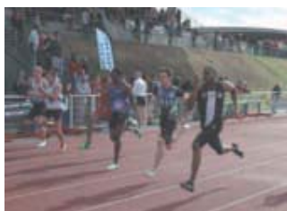
◀ Le stade Paul-Petitpoisson a accueilli les championnats de France d'athlétisme espoirs et nationaux.