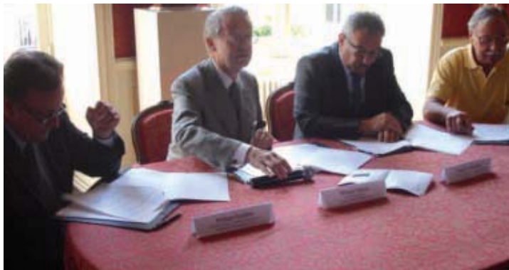
Signature de la convention FISAC.

Une première action sera lancée rapidement. Elle consiste en la réalisation des diagnostics "accessibilité" dans les commerces. De même une étude sur la signalétique sera faite (coût estimé à 25 000 euros et financé pour moitié par l'ARC et pour l'autre moitié par le FISAC). ■