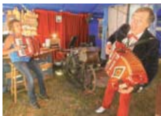
◀ L'Acte théâtral nous a conviés à un moment d'émotion, de rire et d'originalité.