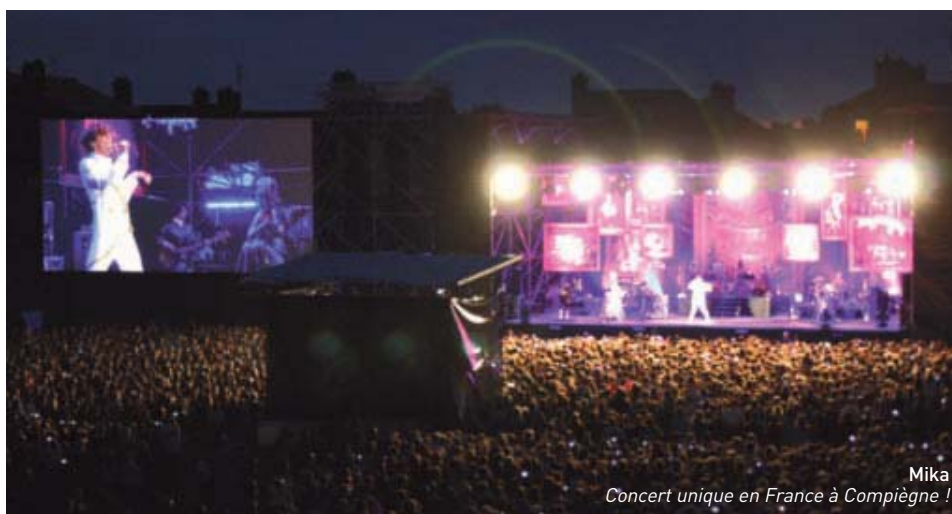
Mika Concert unique en France à Compiègne !