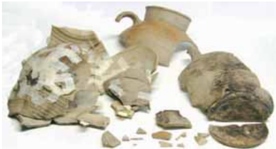
Céramique avant et après restauration.