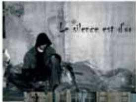
LES FOURBERIES DE SCAPIN 25 novembre 2007