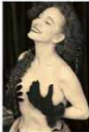
SAPHO 26 février 2008