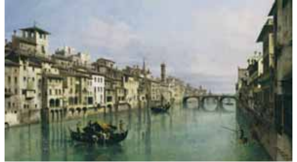
Bernardo Bellotto, L'Arno à Florence, 1742. Huile sur toile Provenance : Collection Marchese Vincenzo Riccardi, Florence 1752, no 83 (attribué à Canaletto) ; collection Nicolas II Esterházy ; acheté par l'État hongrois en 1870 au prince Nicolas III Esterházy ; entré au musée des Beaux-Arts en 1906. Budapest, musée des Beaux-Arts, inv. 647.

Du 21 septembre 2007 au 7 janvier 2008 au Château de Compiègne