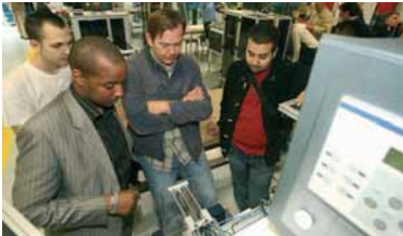
Des machines de conditionnement conçues et réalisées de A à Z par des élèves du lycée Mireille-Grenet vont permettre à d'autres élèves de neuf lycées picards de faire leurs armes.