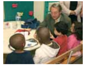
Inauguration de la nouvelle garderie périscolaire à Charles Faroux.

"Ce service supplémentaire rendu plus particulièrement aux parents qui travaillent, est de plus en plus demandé" souligne l'élue déléguée à la vie scolaire et périscolaire. "Depuis septembre 2001, date d'ouverture des premières garderies, la Ville a mis en place trois nouveaux sites d'accueil et repris la garderie de l'école Jeanne d'Arc qui était jusqu'alors gérée par la Coopérative scolaire du Compiégnois. Ainsi en 2007, 236 enfants ont été accueillis au sein de ces structures qui ouvrent leurs portes de 7h30 à 8h20 et de