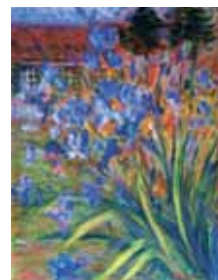
Irises à Revelles. (46 x 53 cm)