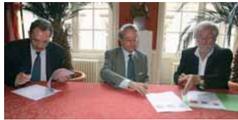
La Caisse des Dépôts et Consignations, l'association le Roseau et la ville ont signé une convention entérinant la création d'une Maison de l'Initiative.

Dans le cadre de la politique de la ville menée depuis quelques mois à Compiègne, la Caisse des Dépôts et Consignations, l'association le Roseau et la ville ont signé le 29 juin dernier une convention entérinant la création d'une Maison de l'Initiative.