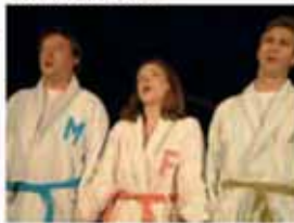
THÉÂTRE IMPÉRIAL DE COMPIÈGNE 3 rue Othenin - 60200 Compiègne