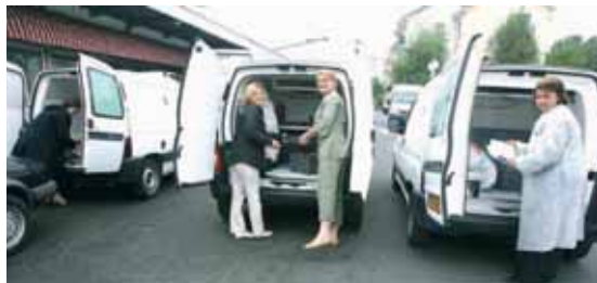
Les véhicules de livraison des repas à domicile sont désormais au nombre de trois afin de répondre à la demande.

A raison de six tournées quotidiennes, les voitures de livraison de repas à domicile de la ville de Compiègne effectuent chacune plus de cinquante kilomètres par jour.