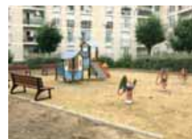
Aire de jeux en cours de réalisation.

- Création d'une aire de jeux, dans le square du Président Kennedy.