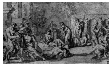
Nicolas Poussin, Allégorie de la vanité, vers 1629. Plume et encre brune, lavis gris. Provenance : Houlditch (Lugt 2214) ; Poggi (Lugt 617) ; collection Nicolas II Esterházy (Lugt 1965) ; acheté par l'État hongrois en 1870 au prince Nicolas III Esterházy ; entré au musée des Beaux-Arts en 1906. Budapest, musée des Beaux-Arts, inv. 2880.

alentours Claire de l'Armistice Visite libre - Entrée gratuite Samedi et dimanche de 9h à 12h15 de 14h à 18h Exposition "Guynemer, enfant de Compiègne"