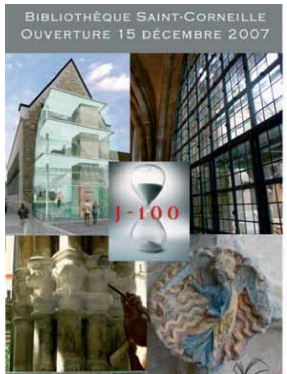
Les travaux se sont poursuivis tout l'été. Le bâtiment sera meublé et les livres installés pour la fin de l'année. A suivre dans le prochain numéro...