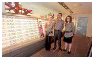
Grand Optical - Opticien Place du Marché aux Herbes