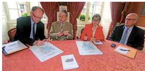
Deux nouvelles chartes patriotiques ont été signées par le collège Ferdinand-Bac et par l'UTC.

Deux nouvelles chartes patriotiques ont été signées, faisant suite à celles déjà ratifiées par six autres établissements scolaires de la ville. Cette fois, c'est le collège Ferdinand-Bac et l'Université de technologie qui sont concernés par ces septième et huitième chartes compiégnoises.