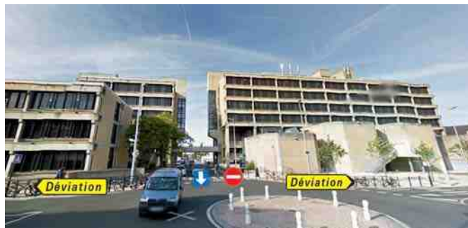
Plan de modification de la circulation.

Autre conséquence, jusqu'à la fin des travaux, les bus TIC de la ligne 5 (dans le sens Gare-Hôpital) ne passeront plus aux arrêts Port à bateaux, Roger Couttolenc et Eglise Saint-Germain. Un arrêt de substitution est créé provisoirement au début de la rue de l'Oïse. ■