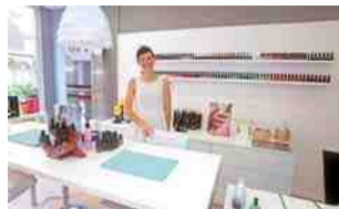
Sweet Lily Nails - Onglerie 6, rue de l'Étoile