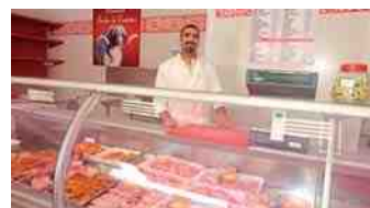
Le Jardin de Compiègne - Boucherie orientale 10, rue Bernard-Morandais