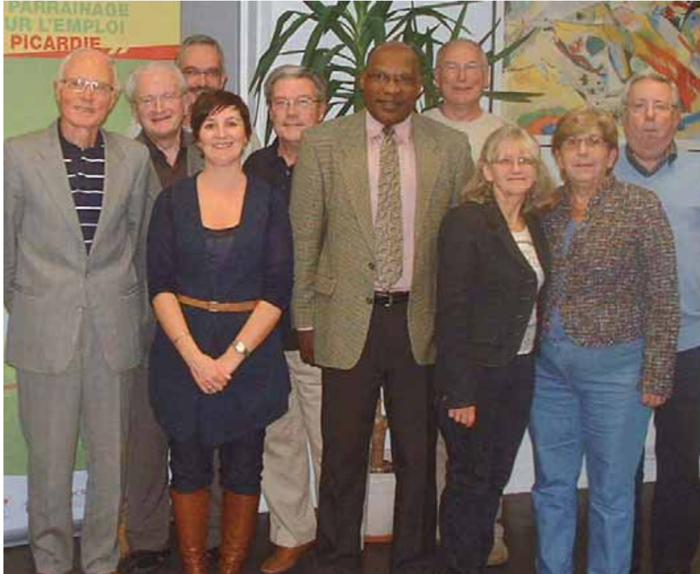
Une partie de l'équipe Parrains/Marraines qui œuvre dans le Réseau mis en place depuis 1997 à la Mission locale du Pays Compiégnois et du Pays des Sources.

Le réseau de parrainage mis en œuvre depuis 1997 à la Mission Locale du Pays Compiégnois et du Pays des Sources rencontre un fort succès. Sur les 100 filleuls accompagnés en 2011, près de 50 % ont pu avoir accès à un emploi. Pour augmenter encore les chances de réussite des personnes en recherche d'emploi, la Mission Locale recrute de nouveaux parrains.