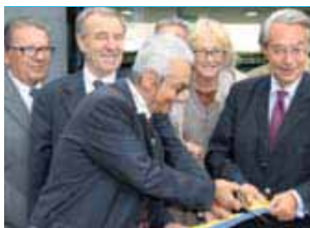
Une nouvelle salle d'animation ▶ est née au cœur du Clos des Roses.