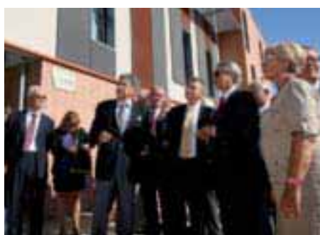
La nouvelle résidence pour étudiants ▶ inaugurée en présence des maires de Compiègne et de Margny.