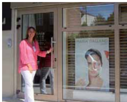
"L" Le Centre Esthétique, 9 bis rue Carnot.