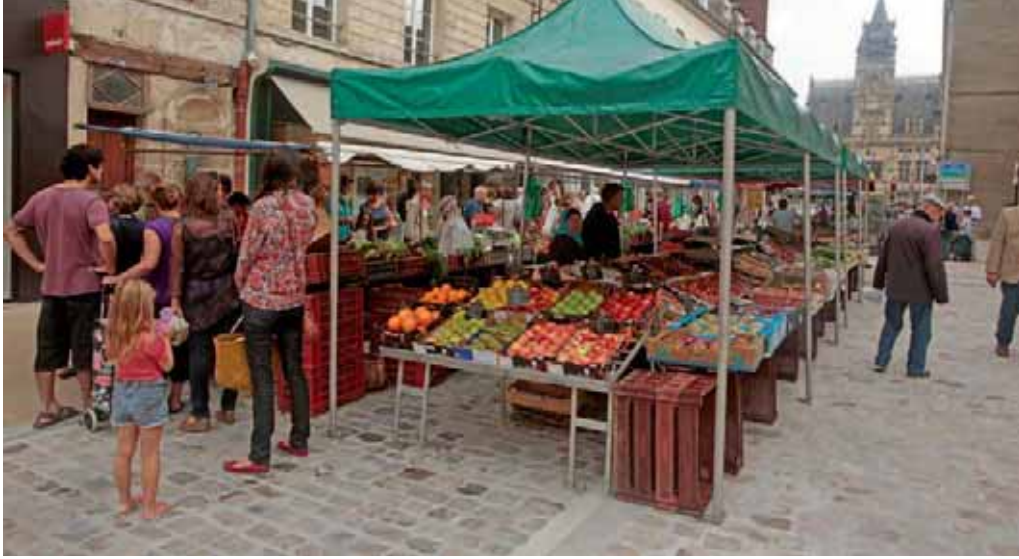
La rue Saint-Corneille accueille à nouveau le marché.

Après plusieurs mois de travaux, la rue Saint-Corneille vient de faire peau neuve. Chantier majeur de l'été, les Compiégnois ont pu découvrir, à la rentrée, une véritable rue de centre-ville, réalisée dans le respect architectural du cloître voisin.