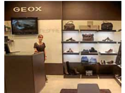
Geox, 12 rue Solférino.