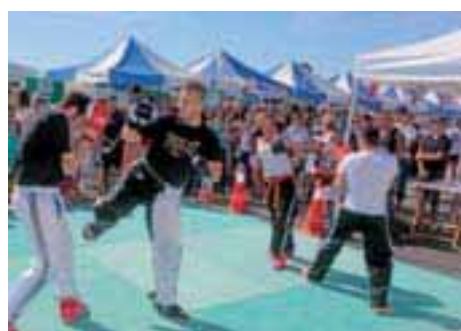
◀ Plus de 300 clubs réunis pour la Fête des associations.