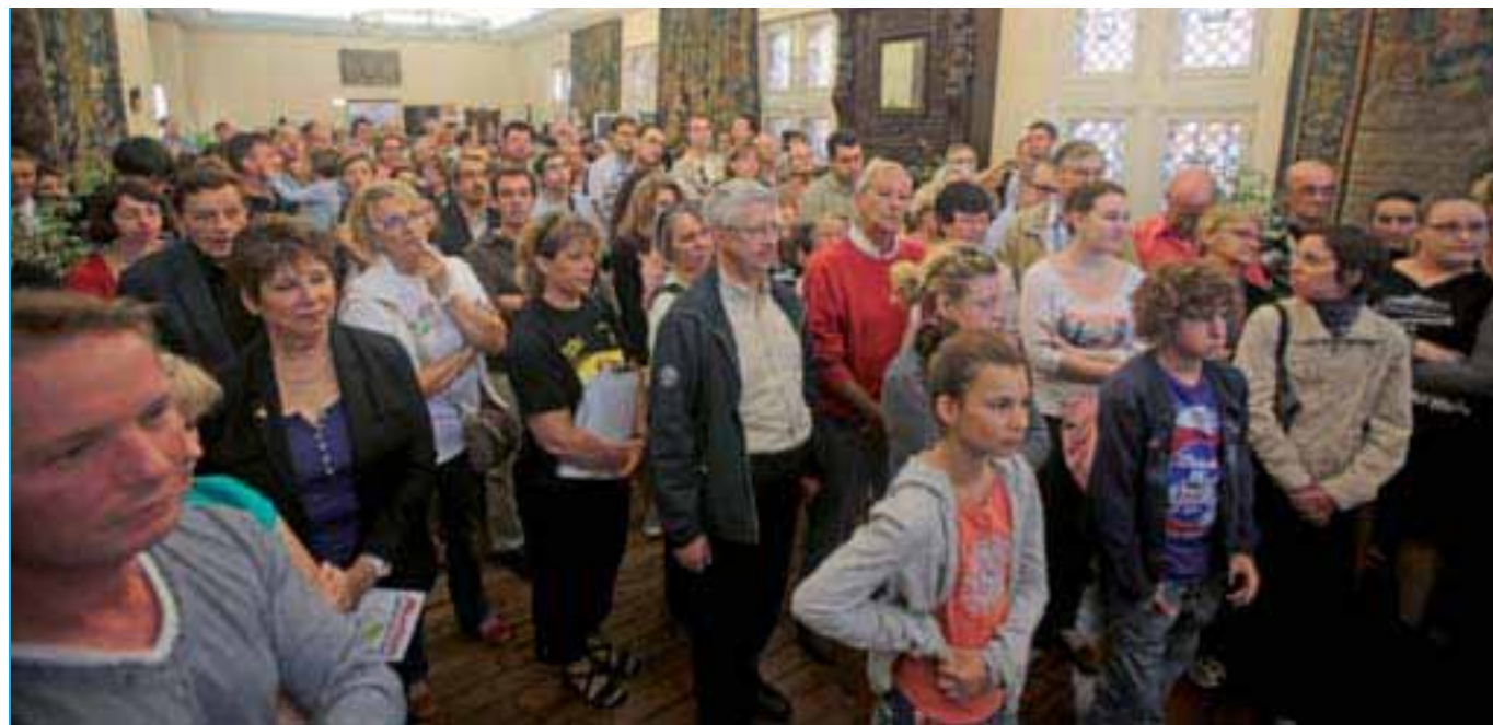
Près de 300 nouveaux Compiégnois ont été reçus dans les salons d'honneur de l'Hôtel de Ville.