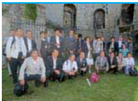
◀ David Douillet, invité d'honneur de la Fête de la chasse et de la nature.