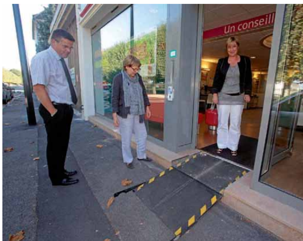
Diverses solutions peuvent être trouvées pour rendre les établissements recevant du public accessibles aux personnes handicapées. Ici, la Maaf, cours Guynemer, a adopté un système de marches rétractables.

Par ailleurs, tous les projets de requalification de voirie font l'objet d'une concertation avec les associations de personnes en situation de handicap et les études préalables prennent en compte de manière systématique la conformité du projet par rapport à la loi sur le handicap".