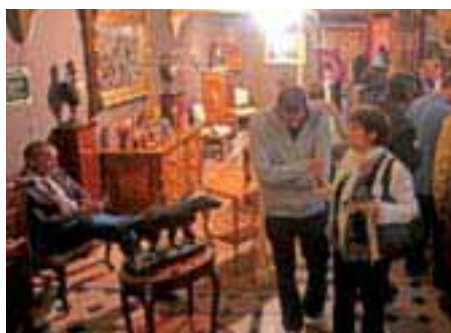
Le 44 ème Salon des antiquaires ▶ a confirmé son attrait auprès des amateurs du bel objet.