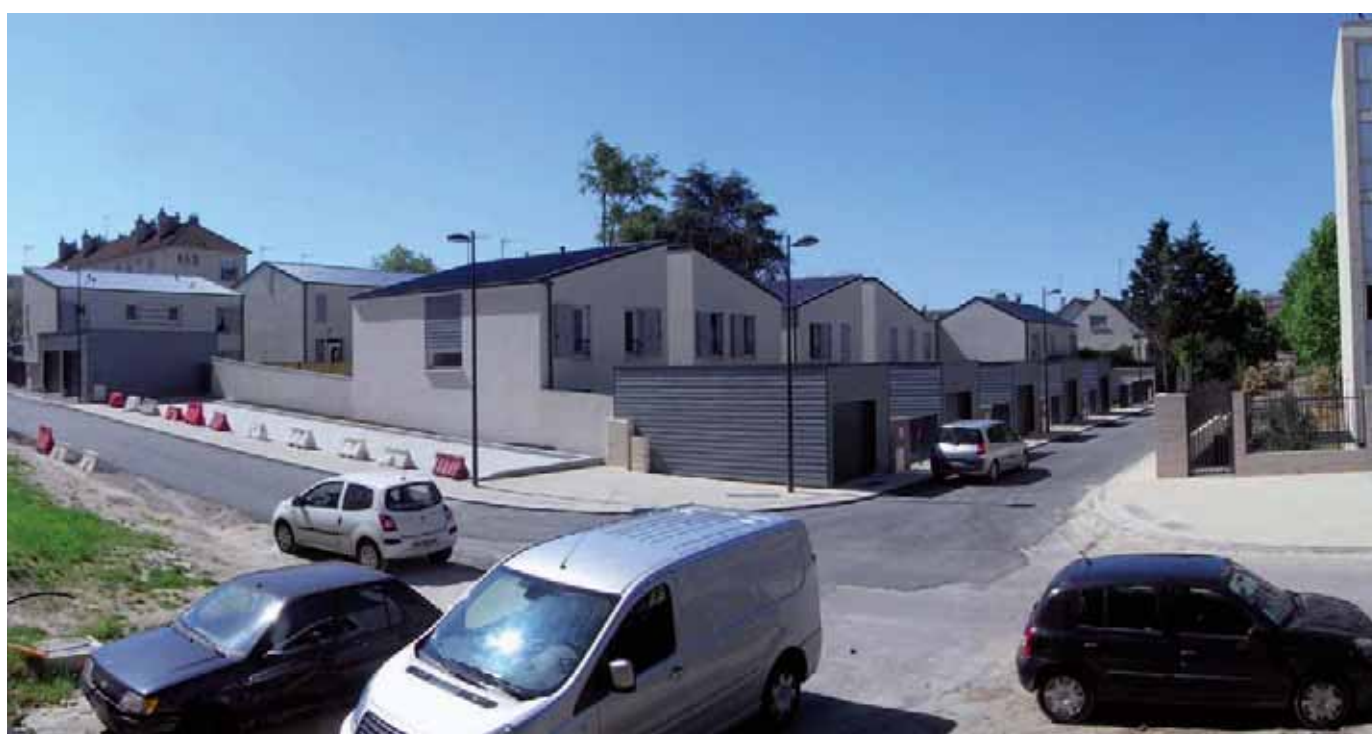
14 maisons de ville ont été réalisées au cœur du quartier du Clos des Roses, rue Victor Schœlcher.

l'avenue du Camp de Royallieu, reliée elle-même par une large coulée verte jusqu'au parc de Bayser d'un côté et l'avenue de l'Europe de l'autre.