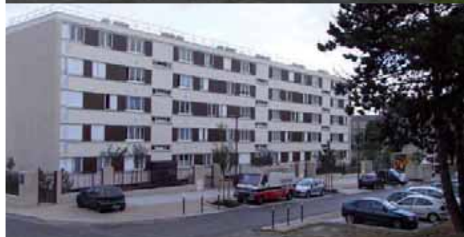
Résidence Ronsard avant et après rénovation.