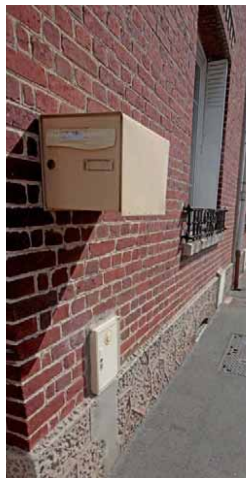
Certains équipements peuvent représenter un danger pour les personnes handicapées. Ici, cette boîte aux lettres extérieure ne peut être détectée par les personnes mal-voyantes.

"En outre, rappelons que des membres de la commission communale d'accessibilité et sécurité se réunissent régulièrement et peuvent apporter une aide incitative aux exploitants des établissements recevant du public afin qu'ils adaptent leurs installations et se mettent en conformité". ■