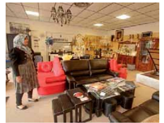
Meubles et déco, 3 rue du Bataillon de France.