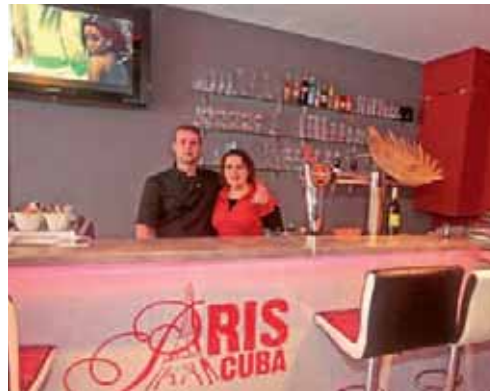
Restaurant Paris Cuba, 8 rue Saint Lazare.