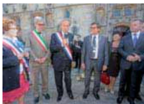
◀ Anniversaires de jumelages 50 ans avec Landshut et Arona et 10 ans avec Elblag ont été fêtés.