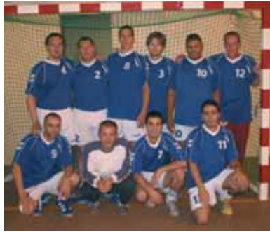
Club de Handball de Compiègne Contact : 06.09.93.19.76 Matches le samedi à la salle Tainturier à partir de 17 h.

La nouveauté n'empêche pas de renouer avec le passé et le CHBC joue dans la salle Tainturier qui avait offert quelques heures de gloire au handball dans les années 70 et 80.