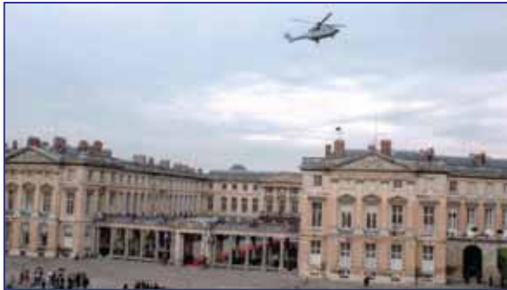
Les trois dirigeants arrivent en hélicoptère près du château.

En 1901, le château de Compiègne qu'affectionnait particulièrement Napoléon III avait été le théâtre d'une visite restée dans les mémoires, celle du Tsar Nicolas II qui y avait scellé l'amitié franco-russe avec le Président Emile Loubet. Le 23 septembre dernier, le château de Compiègne recouvrait son lustre d'antan. Le Président Jacques Chirac y recevait la Chancelière allemande Angela Merkel et le Président de la Fédération de Russie Vladimir Poutine, pour une rencontre tripartite franco-germano-russe.