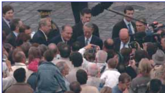
Bain de foule pour le Président Jacques Chirac, aux côtés des parlementaires de l'Oise.