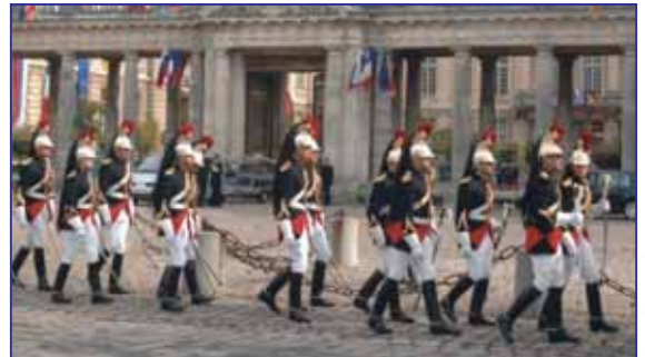
Ici, les Gardes républicains en grand uniforme.