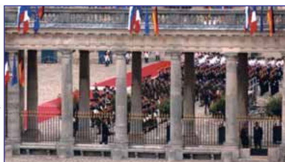
Gardes républicains, aviateurs, marsouins, marins, fantassins, alignés au cordeau, se figent à l'arrivée des chefs d'Etat.