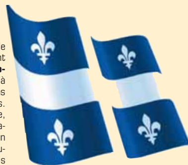
La fierté de ses racines françaises se retrouve sur le drapeau fleurdelisé du Québec.

De Québec à Hanoï, de Tunis à Beyrouth en passant par Yaoundé ou Ndjamena, c'est en français qu'on communique. Vestige le plus symbolique de l'ancien Empire français, notre langue demeure un formidable vecteur d'influence. Cet espace francophone est un lieu d'échanges culturels et économiques réels mais probablement trop timides. La France a tout intérêt à renforcer et à privilégier ses partenariats avec ses anciennes