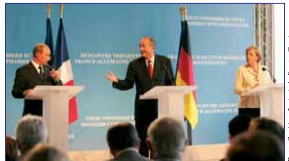
Conférence de presse devant plus de 200 journalistes de tous pays, dans une ambiance conviviale.