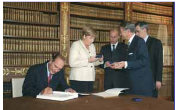
Signature du livre d'or de la Ville dans la bibliothèque du château.