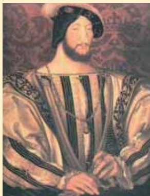
C'est sous François I er , avec l'ordonnance de Villers-Cotterêts (1539), que le français, dès lors imposé aux hommes de loi du royaume, a triomphé du latin.