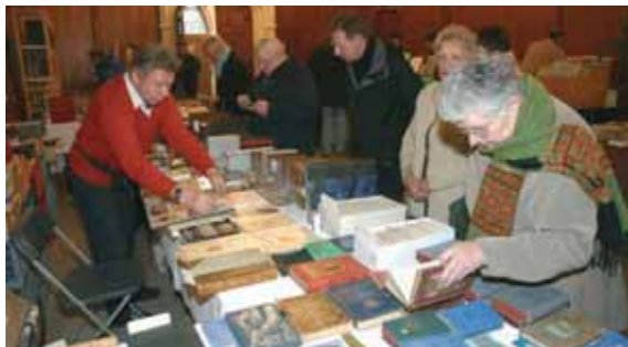
Le Salon du Bouquiniste connaît chaque année une forte affluence, prouvant ainsi que l'attrait pour le livre demeure intact.

A l'heure de l'internet et du roman virtuel, le livre est toujours là et bel et bien là. Témoin l'affluence enregistrée chaque année dans les allées du Salon du Bouquiniste dont une nouvelle édition se tiendra le dimanche 26 novembre aux salles Saint-Nicolas.