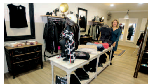
L'Atelier des Rêves - Prêt-à-porter et accessoires 7, rue des Gourmeaux