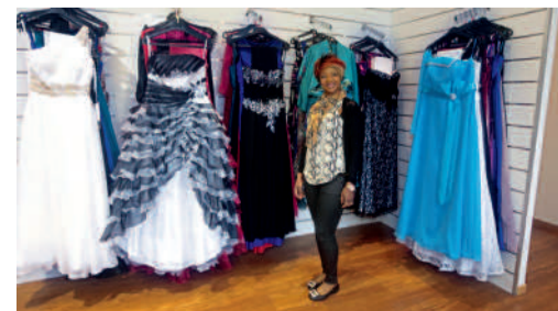
La Joie de Compiègne - Robes, tenues de cérémonies 10, rue des Bonnetiers - Halle commerciale du marché