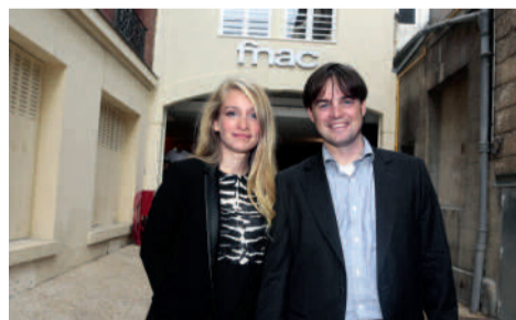
FNAC 1 bis, impasse Saint-Martin