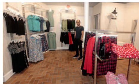
Belgobab - Prêt-à-porter 21, rue du Harlay