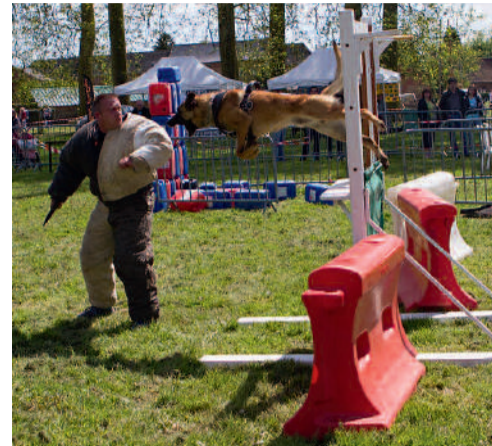
Le chien en action de mordant après un saut d'obstacle.

Le samedi 15 novembre de 14h à 16h30, les brigades cynophiles des polices municipales de Noyon, Senlis, Chantilly, Soisy-sous-Montmorency, Enghien-les-Bains, Drancy, Franconville et Noisy-le-Sec ainsi que le Centre canin Saint-Roch de Braines sur Aronde investiront l'esplanade du Rond Royal (à proximité de l'hippodrome de Compiègne) pour vous faire découvrir le travail du chien de police, notamment les méthodes de dressage, la formation, les domaines d'intervention, le rôle du chien au sein des unités de police municipale.