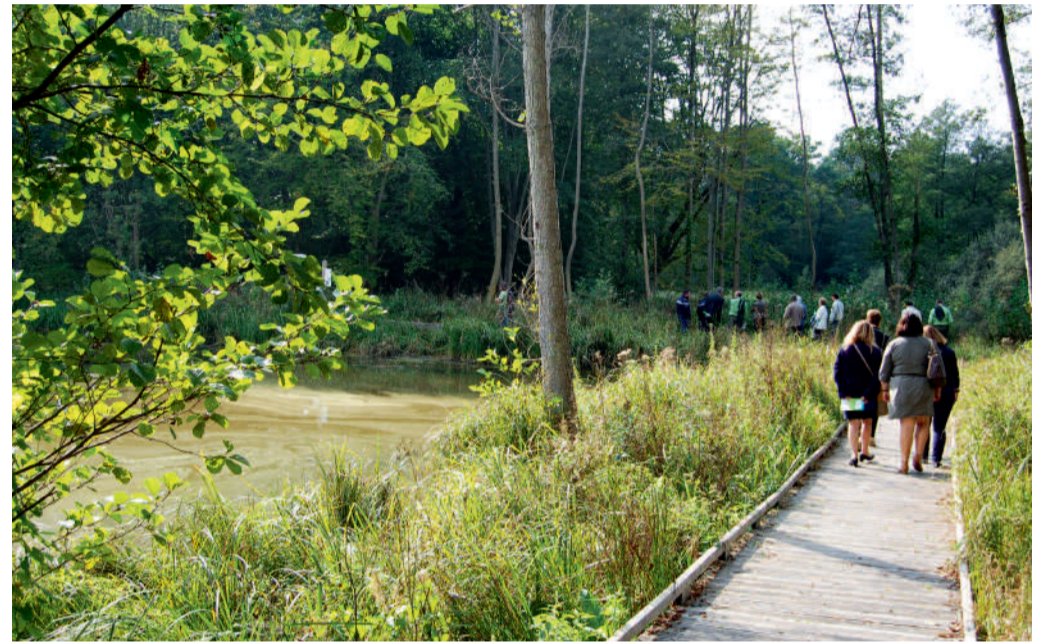
Le nouveau "sentier de la rainette", un parcours pédagogique de 1,5 km destiné à la découverte des milieux humides.

Carnet d'activité disponible auprès de l'Office de Tourisme de l'Agglomération de Compiègne. ■