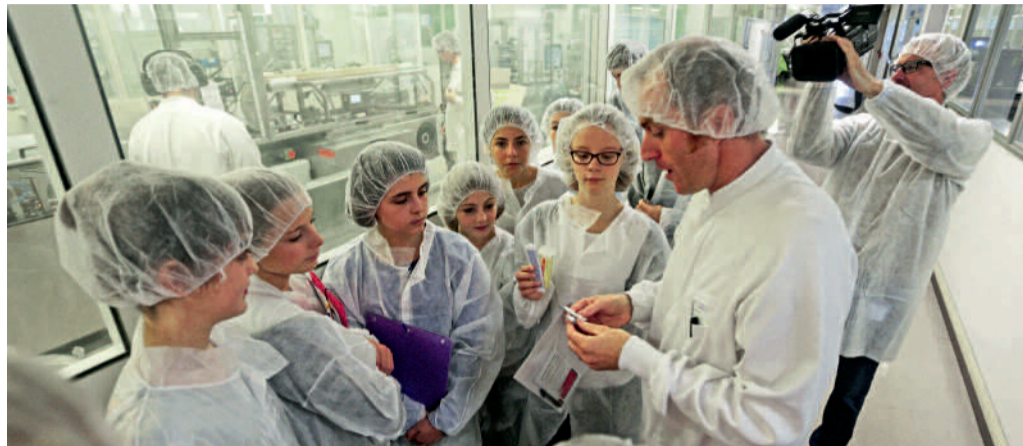
Les jeunes collégiens ont visité notamment l'unité compiégnnoise de Sanofi.

"L'Entreprise c'est pas sorcier". C'est le titre donné par le Centre des Jeunes Dirigeants à cette vaste opération qui a permis deux mois durant à sept cents jeunes des collèges privés et publics du Compiégnois de partir à la découverte d'un monde souvent inconnu : celui de l'entreprise.