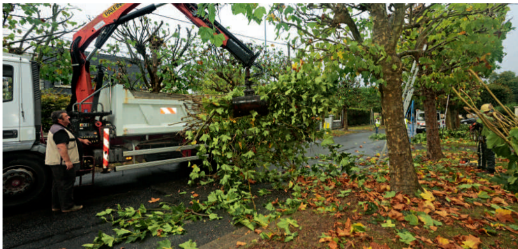
Le service des jardins de la ville effectue l'entretien des platanes, rue Pillet-Will, pour une meilleure intégration dans le paysage urbain.

La Ville de Compiègne possède le patrimoine arboré le plus important de l'Oise et elle a fait le choix de l'entretenir et de maintenir son niveau de qualité. C'est pourquoi, régulièrement, services des espaces verts et sociétés spécialisées interviennent sur le territoire compiégnois.