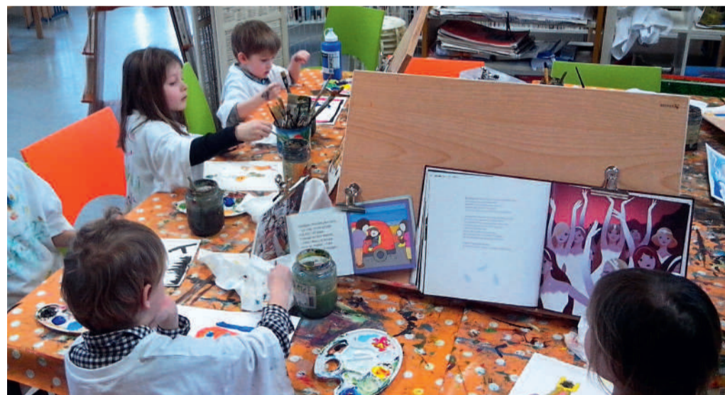
Le partenariat conclu avec l'association Bulle et Compagnie permettra notamment de développer les ateliers de médiation artistique et culturelle ouverts à tous.

"Par ailleurs Bulle et Cie continue ses ateliers hebdomadaires de médiation artistique et culturelle (plastiques, corporels et théâtraux) pour tous : enfants, adultes, tout-petits, personnes en situation de handicap, parents-enfants... Vous trouverez plus de précisions sur notre actualité dans la page facebook "Association Bulle et Cie". ■