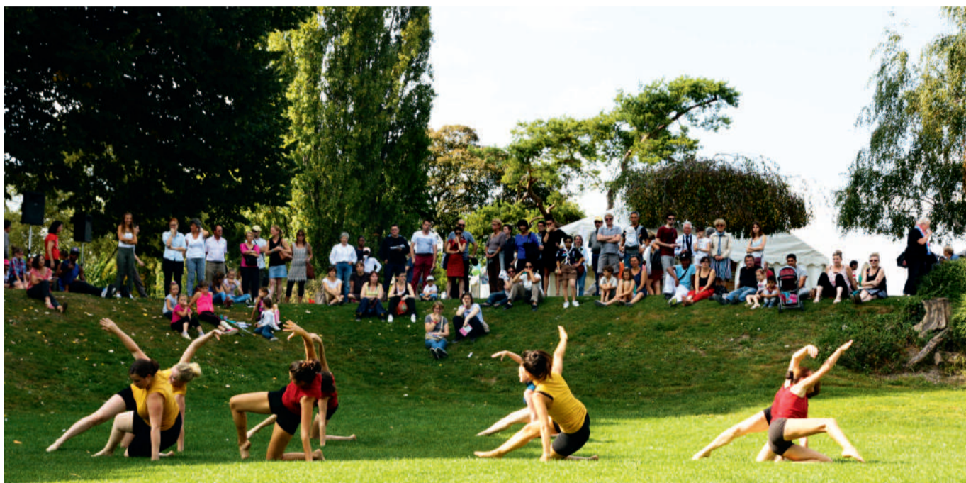
Plus de 300 associations compiégnoises étaient de la fête.