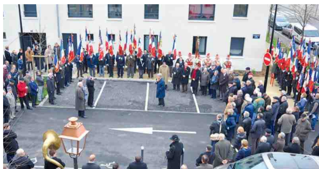
La rue des anciens combattants d'Afrique du Nord a été inaugurée en présence de 46 porte-drapeaux et des représentants des associations ACPG-CATM, UNC et FNACA.

C'est avec une grande émotion que la plaque portant l'inscription "Rue des Anciens Combattants d'Afrique du Nord" a été dévoilée dans cette nouvelle voie publique, ici, sur le pourtour de la ZAC du Camp de Royallieu, près du Mémorial de l'internement et de la déportation qui a ouvert ses portes en février 2008.