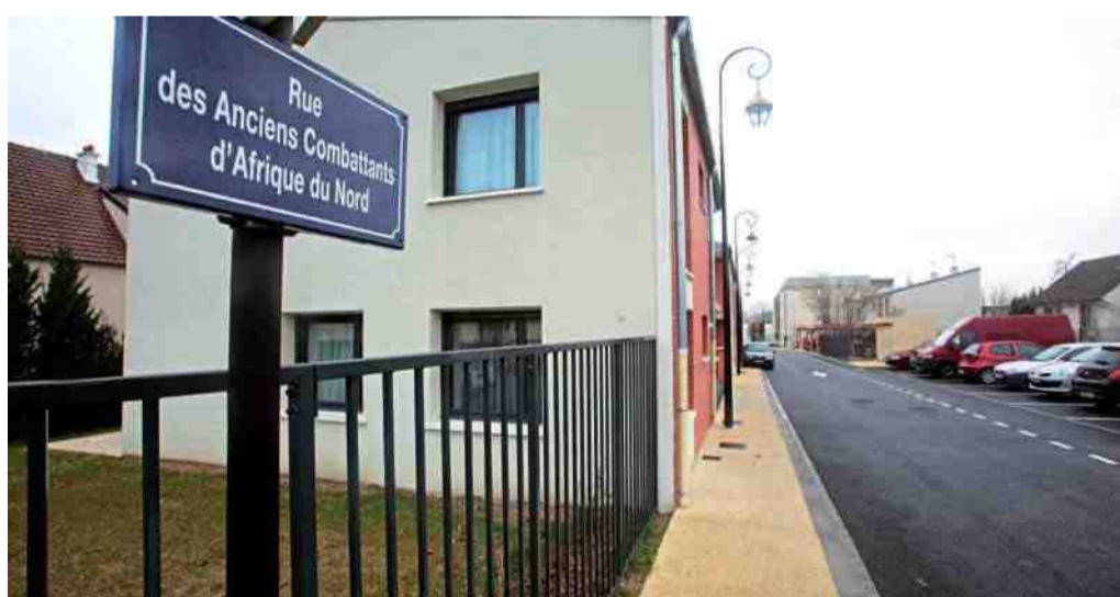
44 logements locatifs sociaux (ANRU), 28 logements en accession sociale et 8 maisons individuelles ont été créés sur l'ancien site des ateliers Massey-Ferguson.

Cette nouvelle rue du quartier de Royallieu est ainsi baptisée à la demande des anciens combattants qui ont joué la carte de l'union car ce sont trois associations patriotiques, les Anciens Combattants et Prisonniers de Guerre et Combattants d'Algérie, Tunisie, Maroc, l'Union nationale des Combattants, et la Fédération nationale des anciens combattants d'Algérie, qui ont souhaité marquer l'engagement de ces hommes dans un conflit que l'on sait meurtrier. "Il aura fallu une très longue durée et que le temps effectue son travail pour que les esprits