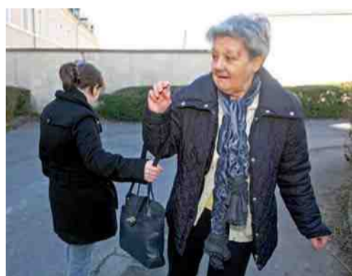
Soyez vigilants !

Vols à l'arraché, à domicile ou de carte bleue au distributeur de billets, les personnes âgées, souvent plus vulnérables, doivent être particulièrement vigilantes et prendre quelques précautions.