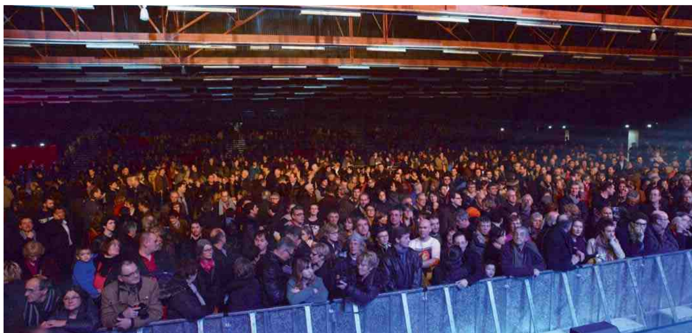
Le Tigre, nouveau pôle événementiel des Hauts de Margny, a accueilli ses premiers spectateurs le week-end des 25 et 26 janvier. Un public venu nombreux !