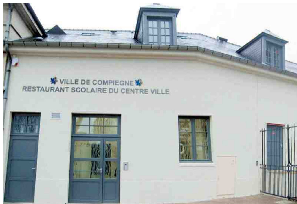
Le nouveau restaurant scolaire, rue de la Baguette, accueille 220 rationnaires des écoles Hersan et Pierre Sauvage.

Le local était auparavant occupé par un artisan doreur. Il a été transformé en restaurant scolaire pour les enfants des écoles Hersan et Pierre Sauvage, qui bénéficient désormais d'un espace pour déjeuner en centre-ville.