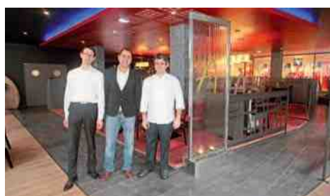
Le relais d'Alsace - Taverne Karlsbrau Galerie commerciale, place du Marché aux Herbes