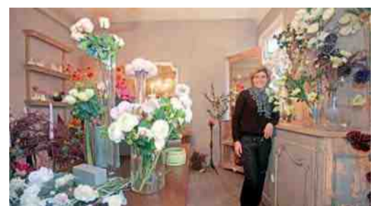
Esprit fleurs - Spécialiste de fleurs et feuillages intemporels - 15, rue Fournier-Sarlovèze