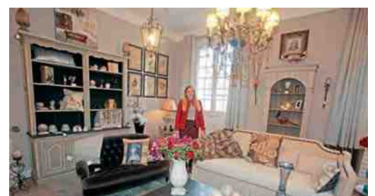
Décor de Charme - Décoration d'intérieur, objets et meubles - 15, rue Fournier-Sarlovèze