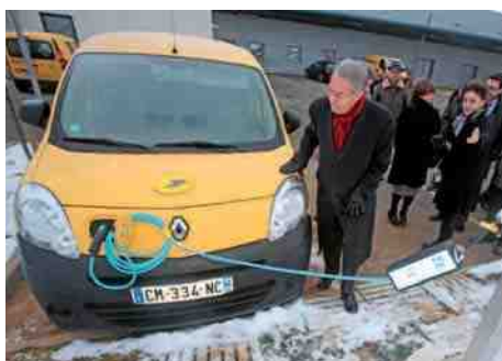
◀ La Poste vient de doter ses facteurs de véhicules électriques.