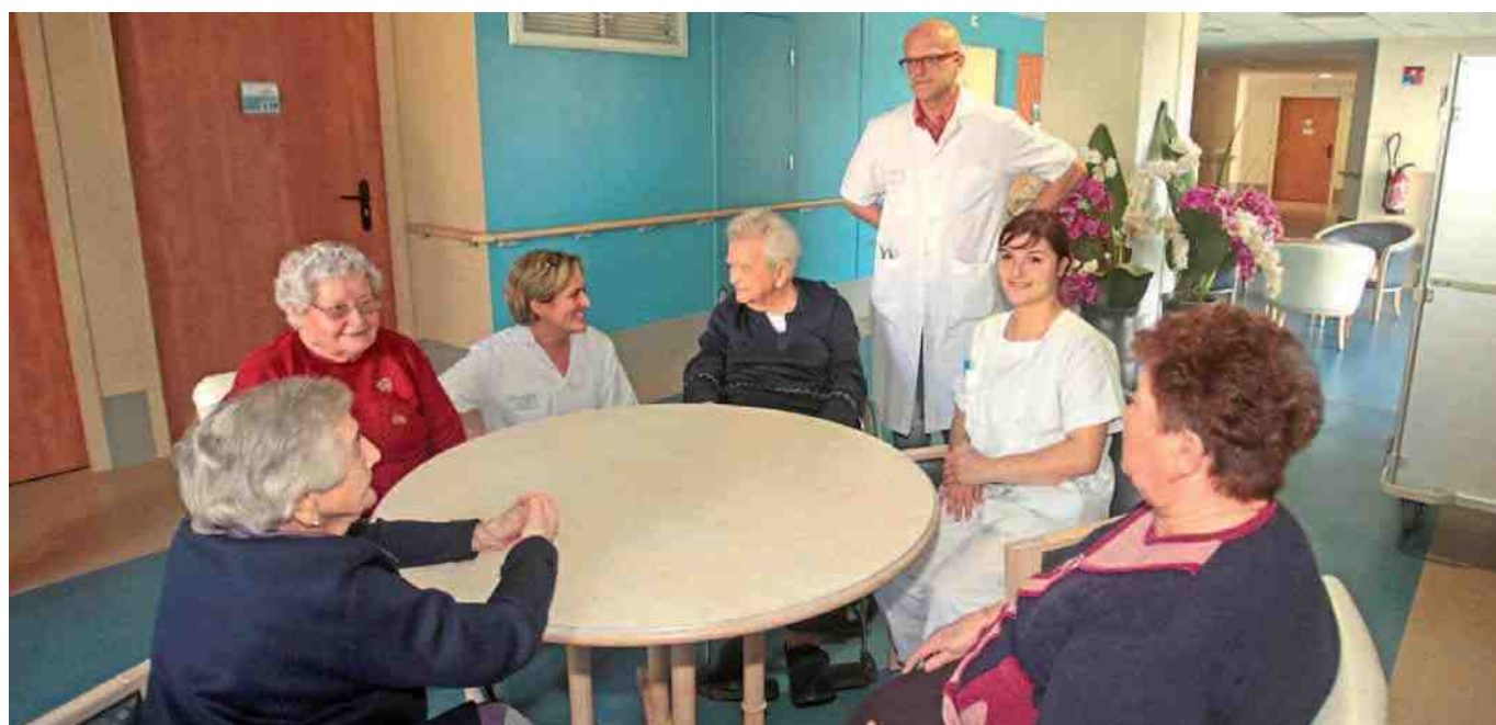
Extension du Centre Fournier Sarlovèze sur le site de l'ancien hôpital Saint-Joseph entièrement rénové. 5150 m 2 de bâtiments supplémentaires sont ainsi dédiés à l'accueil des personnes âgées.