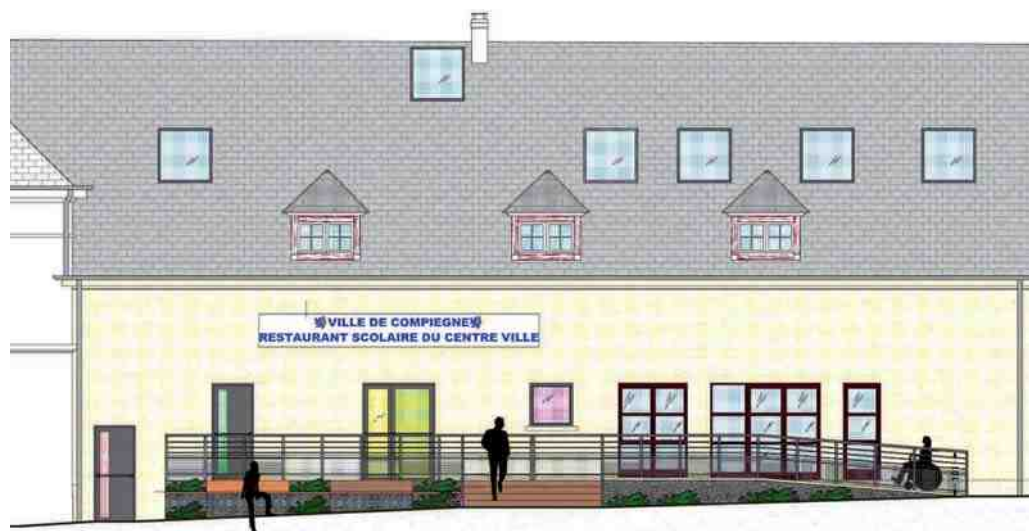
Un nouveau restaurant scolaire rue de la Baguette.

C'est en janvier 2014 qu'ouvrira le nouveau restaurant scolaire pour les enfants des écoles Hersan et Pierre Sauvage. Situé rue de la Baguette, dans l'immeuble de l'ancien doreur attenant à l'école Jeanne d'Arc, le nouveau restaurant scolaire pourra accueillir les quelques 220 jeunes rationnaires.