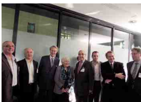
◀ La polyclinique Saint-Côme fête ses 50 ans. L'établissement fut fondé en 1962 par le Docteur Georges Woimant.