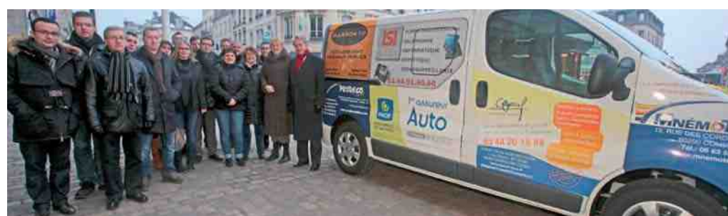
Ce nouveau minibus a été acquis grâce au partenariat de plusieurs sociétés et entreprises compiégnaises.

Grâce à l'aide de partenaires financiers rassemblés par la société XL Communication, un minibus flambant neuf est désormais à la disposition des centres d'animation des quartiers de Compiègne. Destiné principalement au déplacement des enfants qui quotidiennement se rendent de ces centres aux points d'activités sportives ou culturelles mises en place dans le cadre de ces animations, ce véhicule de neuf places arbore les couleurs des firmes et sociétés compiégnaises qui ont apporté leur obole à