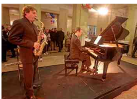
◀ Journée Amérique gourmande Un moment d'exception au Théâtre Impérial.