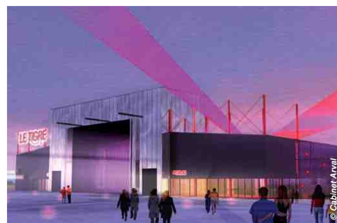
Le "Tigre" sera aménagé sur les Hauts de Margny-lès-Compiègne.

"Allô, Monsieur le Maire ..." 03 44 40 72 80