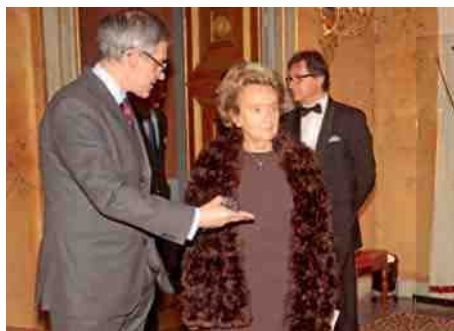
Bernadette Chirac au Palais ▶ pour la soirée de clôture de l'opération Pièces jaunes.