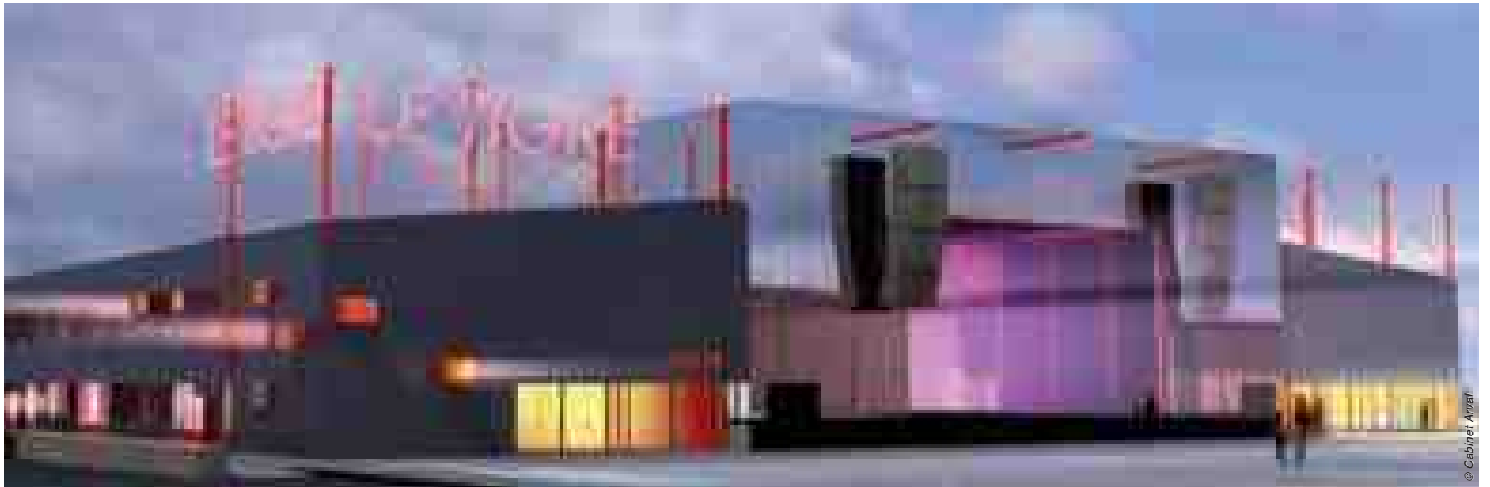
L'ouverture du Tigre est programmée en janvier 2014.

Le cabinet Arval qui a gagné le concours d'architecture va offrir un tout nouveau look à cet équipement. Le parking de plus de 1000 places est déjà réalisé et les entreprises travaillent actuellement d'arrache pied pour transformer totalement ce bâtiment, avec une fin des travaux prévue pour décembre 2013, l'ouverture au public étant programmée dès janvier 2014. ■