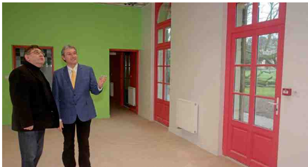
Les anciennes écuries du parc de Bayser ont subi une véritable transformation pour pouvoir accueillir la crèche familiale.

"Avec cette nouvelle structure municipale de 25 berceaux et l'extension de la crèche de la Croix-Rouge qui dispose désormais de 24 berceaux supplémentaires, Compiègne totalise 235 places en crèches collectives, soit 82 lits de plus