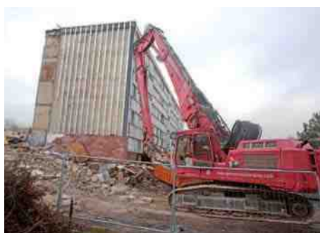
Démolition de l'immeuble Albert Camus ▶ au Clos des Roses.