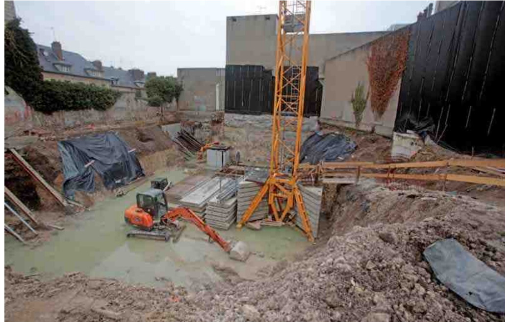
Les travaux de la rue Solferino vont bon train.

nomie locale qui connaîtra un nouveau souffle avec l'intervention sur ces différents chantiers d'entreprises locales et régionales comme l'entreprise Brézillon nouvellement installée côté rive droite du Pont Neuf et qui s'est vu confier la réalisation de la galerie commerciale de la place du Marché. Au total, plus de 20 millions d'investissements privés seront consacrés à ces différents projets : un bel enjeu pour l'économie locale.