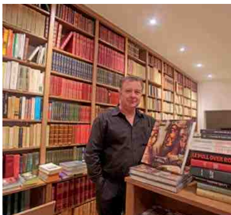
La Licorne 12, rue des Boucheries