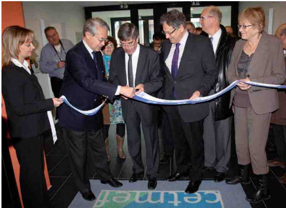
Le Cetmef a inauguré ses nouveaux locaux place Max Brézillon.