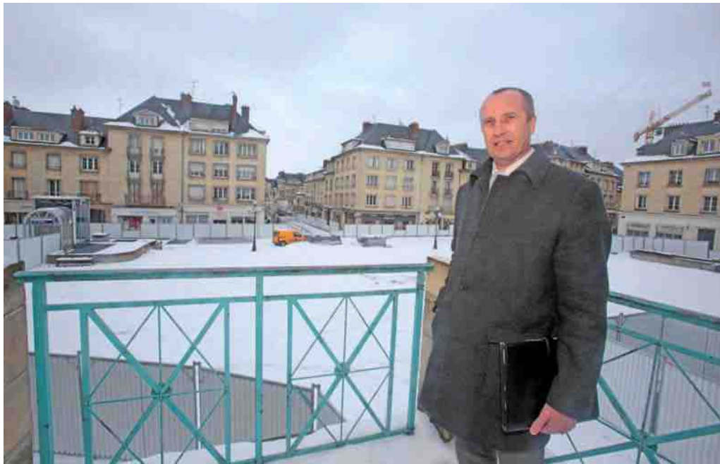
La galerie commerciale de la place du marché, un chantier qui emploiera une trentaine de personnes.

Trois projets d'envergure vont modifier en 2013 le paysage du cœur de ville et redonner un coup de fouet au commerce de centre-ville : la galerie commerciale qui sera érigée sur la place du marché, le nouvel ensemble de commerces et d'habitations rue Solferino et le projet de reconversion des Dianes. Au total, plus de 20 millions d'euros seront investis.