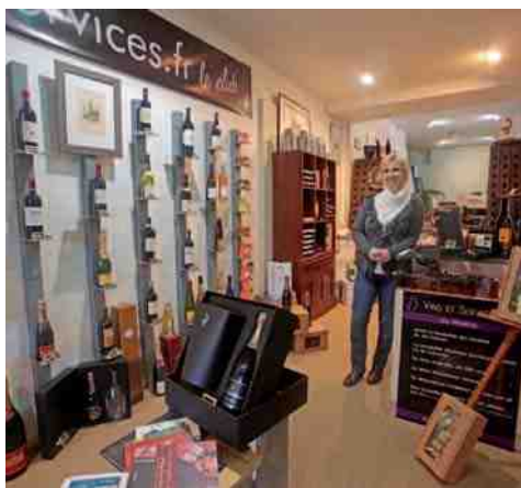
Vin et Services 37, rue Saint-Corneille