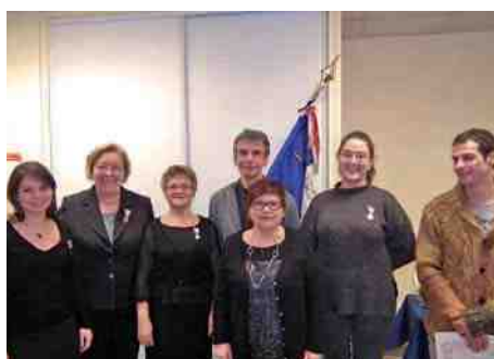
Les Sauveteurs de l'Oise ▶ mettent à l'honneur six de leurs bénévoles.