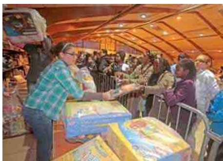
◀ Solidarité Noël 1300 enfants ont pu bénéficier d'un vrai Noël grâce à la générosité des Compiégnois.