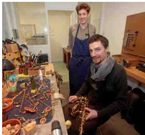
Le Pavillon 24, rue d'Amiens