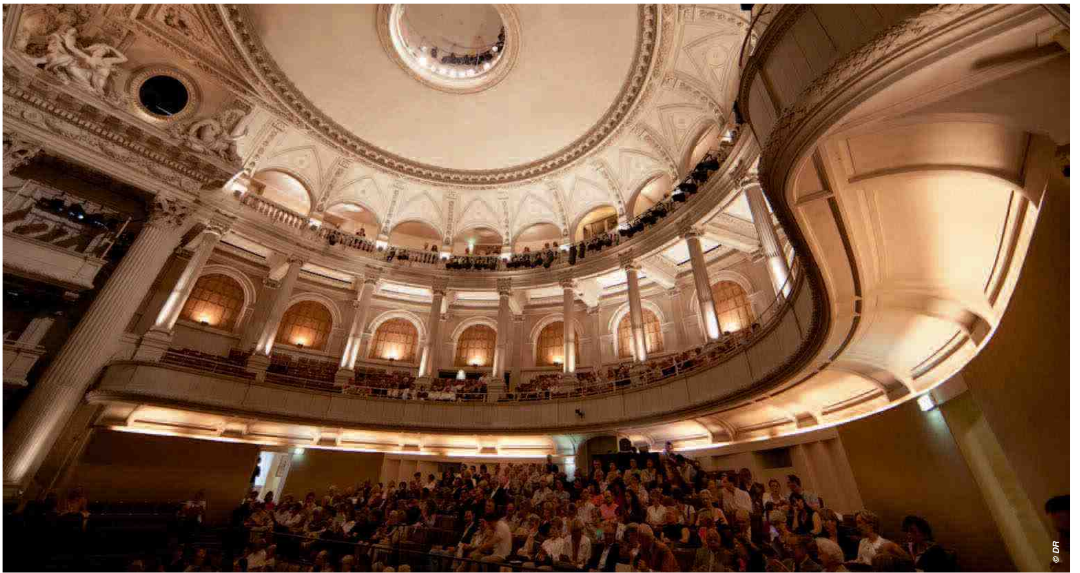
Le Théâtre Impérial accueille un public toujours plus large et enthousiaste.