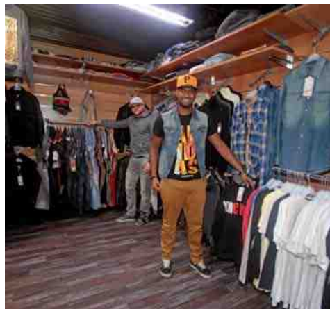
Dirty Shop Galerie La Flânerie - 7, rue Jean-Legendre