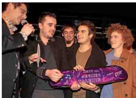
Les jeunes talents musicaux ▶ du Compiégnois sont mis à l'honneur lors d'une soirée au Ziquodrome.