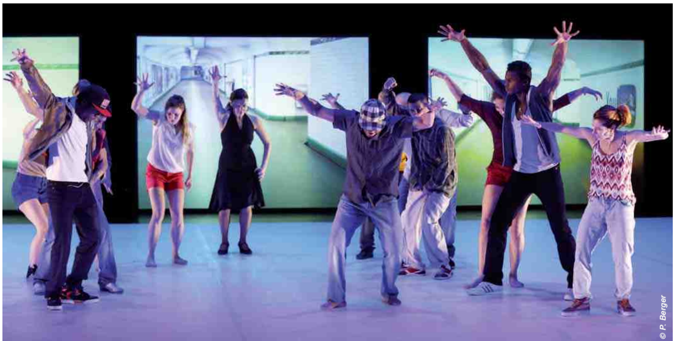
Les Théâtres de Compiègne, délibérément pluriels.

Résolument engagé dans le soutien à la création, l'Espace Jean Legendre accompagne et coproduit plusieurs compagnies dans leurs nouvelles aventures artistiques à dimensions nationale et internationale.