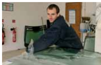
Mondial Pare-brise, 2 rue de Soissons.