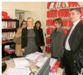
Audience de rentrée au Tribunal de Grande Instance. L'occasion de visiter les locaux qui ont bénéficié d'une profonde rénovation.

Audience de rentrée au tribunal de Compiègne. Ce rendez-vous traditionnel de début d'année a débuté par le bilan de l'exercice écoulé et les vœux prononcés au sein du Conseil de Prud'hommes, puis du tribunal de commerce avant l'audience solennelle de rentrée du tribunal de grande instance. Ces moments sont évidemment mis à profit pour diffuser les statistiques de