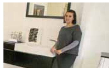
Bains et Douches Design, 2 rue de l'Ecu.