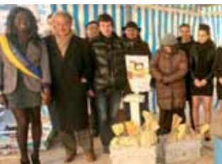
Opération pièces jaunes : 194,55 kilos de monnaie ont été collectés.

Quatre artistes compiégnais ▶ à l'honneur à l'Espace Saint-Pierre-des-Minimes.