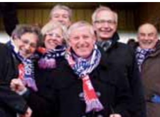
Les élus du Compiégnais soutiennent l'AFC lors des 16 ème de finale de la Coupe de France.

André Dussollier ▶ à la bibliothèque St-Corneille pour l'enregistrement des audioguides du musée lapidaire.