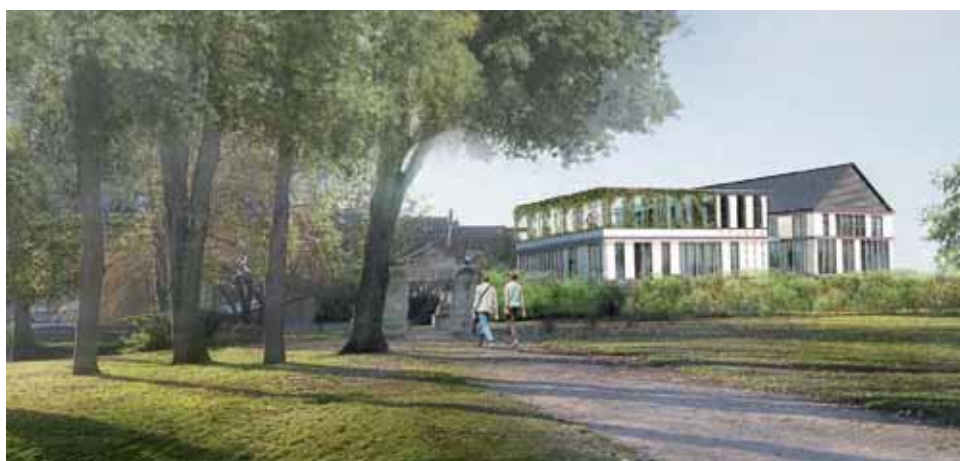
La maison de l'archéologie, vue depuis le musée Vivenel et le parc Songeons.

diversifié : scolaires, enfants et familles pendant les vacances, adultes, ainsi que des animations événementielles notamment lors des Journées du Patrimoine, de la