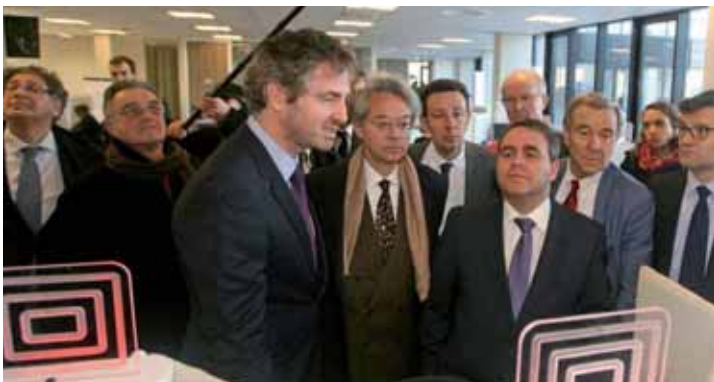
Inauguration des nouvelles installations de Webhelp, en présence du ministre Xavier Bertrand, des élus locaux et du député Lucien Degauchy.

Installée à l'automne 2010 à Compiègne, la société Webhelp a inauguré ses nouveaux locaux au parc tertiaire et scientifique de La Croix Saint-Ouen, en présence de Xavier Bertrand, ministre du Travail, de l'Emploi et de la Santé.