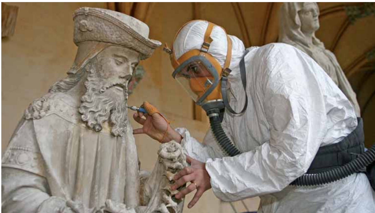
La restauration des œuvres nécessite un travail minutieux.