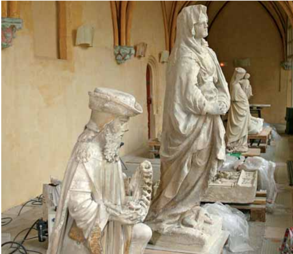
Parmi les œuvres présentées, Joseph d'Arimate (au premier plan), personnage du Nouveau Testament.

ensemble de Vierge à l'Enfant, une sainte Catherine d'Alexandrie et une étonnante représentation du Christ séraphique provenant probablement du couvent des Cordeliers viendront notamment orner les galeries du cloître Saint-Corneille.