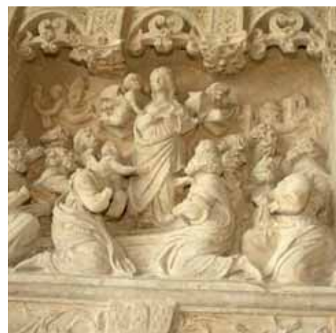
Le retable Renaissance de la vie de la Vierge provenant du monastère de Saint-Arnould à Crépy-en-Valois, sera présenté au Cloître.

Sculptures et éléments architecturaux provenant de nombreux autres édifices religieux de Compiègne et de la région seront également exposés afin de restituer le mobilier liturgique présent dans les monastères et églises contemporaines de l'abbaye de Saint-Corneille. Ainsi, parmi les sépultures habituellement situées dans les nefs et chœurs des