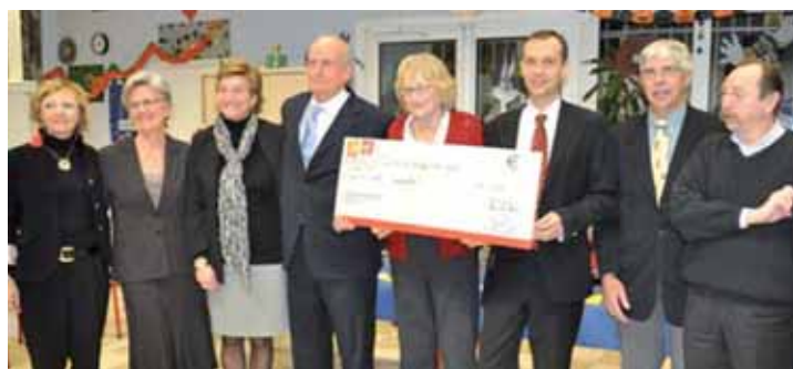
L'action de l'association Service Emploi Citoyenneté soutenue par la Caisse d'Épargne de Picardie.

La Fondation des Caisses d'Épargne a remis un chèque de 4 600 euros à l'association Service Emploi Citoyenneté.