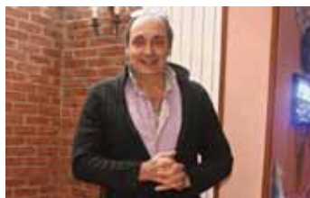
Chez Attilio - Pizza Pasta, 6 rue des Pâtisseries.