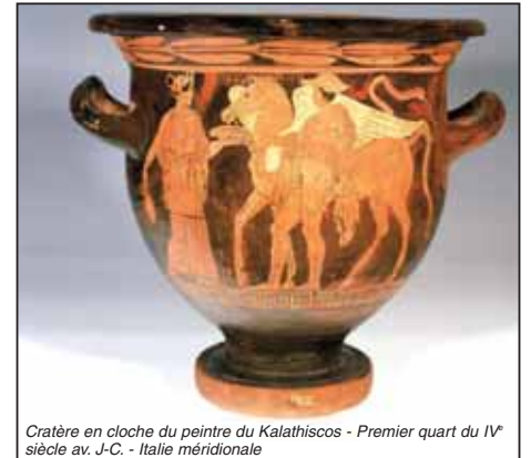
Cratère en cloche du peintre du Kalathiscos - Premier quart du IV e siècle av. J.-C. - Italie méridionale

Parallèlement, des expositions thématiques renouvelées annuellement permettront de présenter plus largement les collections archéologiques en privilégiant la présentation à différentes activités de la vie quotidienne : "se nourrir", "se vêtir", "habiter", "mourir". ■