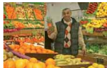
Casa Délice, 25 bis Cours Guynemer.