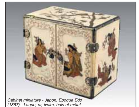
Cabinet miniature - Japon, Epoque Edo (1867) - Laque, or, ivoire, bois et métal