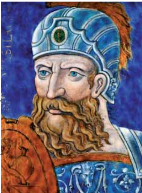
Protésilas par Léonard Limosin, émailleur à Limoges, vers 1540 - Email peint sur cuivre avec rehauts d'or.