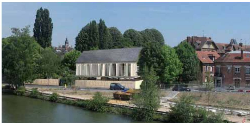
La maison de l'archéologie, vue des bords de l'Oise.

Au sein de la Maison de l'archéologie, les équipes du musée Antoine Vivenel, de Conservare et du CRAVO pourront développer sur la base du programme pédagogique mis en place par le service des publics du musée, un programme enrichi de volets scientifiques portant sur l'étude et la recherche en archéologie et la conservation-restauration du patrimoine, permettant ainsi une mise en valeur plus dynamique des collections auprès des publics. Des espaces spécifiques, salle pédagogique ou salle de conférences et atelier polyvalent de restauration pourront accueillir un public très