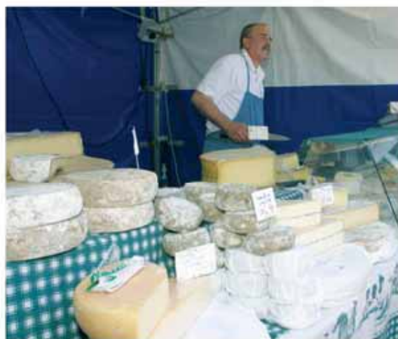
Tour de France de la gourmandise cette année encore pour la 17 ème Foire aux Fromages et aux Vins.