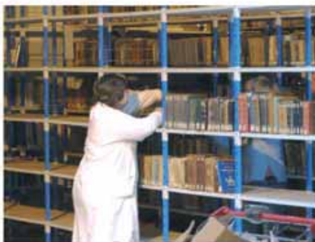
Les réserves de la bibliothèque Saint-Corneille se sont vidées en un temps record.

Nos efforts ont porté leurs fruits : malgré un site en moins sur un semestre, nos lecteurs inscrits, au nombre de 5 402, sont 4,5 % plus nombreux qu'il y a un an. Et notre indicateur principal d'activité, le nombre de prêts, est aussi en hausse : les lecteurs ont effectué 11 % d'emprunts de documents en plus (204 308 emprunts). Ils ont bien voulu remarquer l'effort général de communication du service, l'amélioration et la simplification de l'accueil ; ils ont surtout apprécié l'accroissement et la bonification de l'offre documentaire des Bibliothèques par une politique d'acquisition ambitieuse et raisonnée".