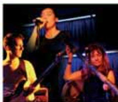
Le groupe Magma.

pièces comme les enthousiasmes les plus inconditionnels 1 re partie : OUIJA (Compiègne) Entrée 20 euros