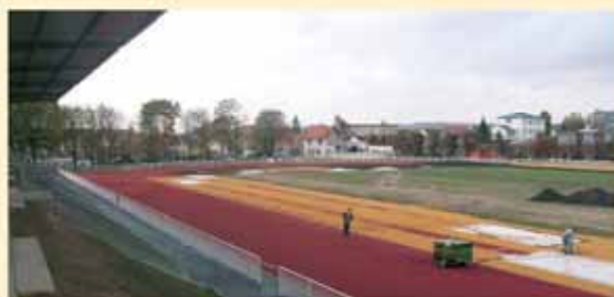
Le stade Paul Petitpoussin accueillera très prochainement ses premières compétitions.

Ambition ensuite par l'importance des chantiers financés. En effet, de gros efforts seront consacrés cette année à la rénovation de la bibliothèque Saint-Corneille (2,5 millions d'euros), au futur Mémorial de la déportation (1,5 million d'euros), sans oublier l'achèvement du stade d'athlétisme (1,1 million d'euros). Culture et sport ainsi mis à l'honneur, Compiègne se veut une ville vivante qui apporte à ses habitants les moyens de cultiver leur corps et leur esprit.