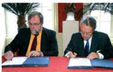
La signature de la convention passée entre la Mission locale et le Conseil régional marque la simplification des démarches de jeunes qui auront désormais pour interlocuteur que la Mission locale.

Cette convention permet à la Mission locale d'apporter aux jeunes de 16 à 25 ans une information complète sur les formations régionales qui leur sont ouvertes. La Mission locale devient désormais le seul interlocuteur des jeunes en recherche d'emploi, gage de rapidité de traitement de leur dossier. "Cet accord va vraiment dans le bon sens, celui de la simplification au service des