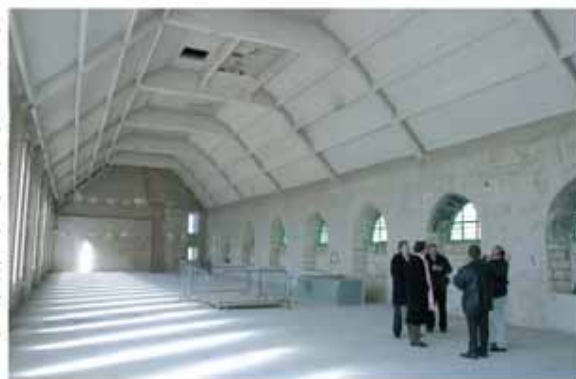
La bibliothèque Saint-Cornille telle que vous ne l'avez jamais vue !

Samedis 13 mai et 10 juin à 16h à la bibliothèque Jacques-Mourichon.