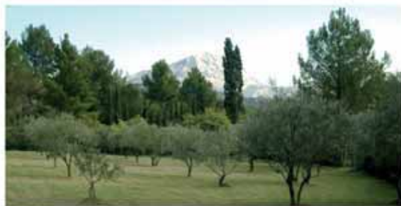
La région Provence Alpes Côte d'Azur sera l'invitée d'honneur de ces deux journées.

L'entrée de la foire sera libre et gratuite de 9h à 20h le samedi et de 9h à 19h le dimanche.