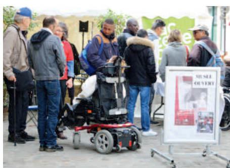
◀ La Bibliothèque Saint-Corneille s'associe à l'opération "J'accède 2017" aux côtés de la Caravane de l'accessibilité.

34 exposants présentent leurs créations et leur savoir-faire lors du Salon des métiers d'art et du patrimoine aux salles Saint-Nicolas.