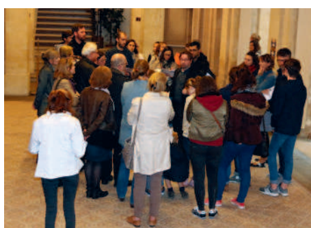
◀ Passionnés et amateurs d'art lyrique pénètrent dans l'univers de l'opéra, au Théâtre Impérial.

Le Salon de la Fleur séduit les initiés et jardiniers en herbe.