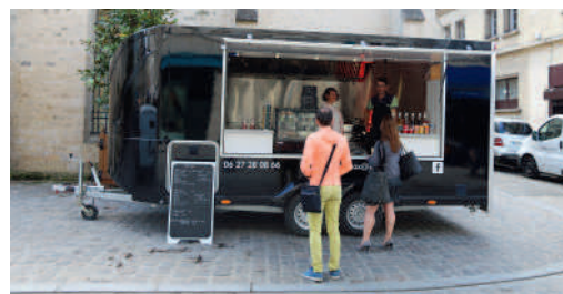
Chez Max, Foodtruck Les lundi et mercredi rue du Général Weygand et les mardi, jeudi et vendredi rue Saint-Corneille