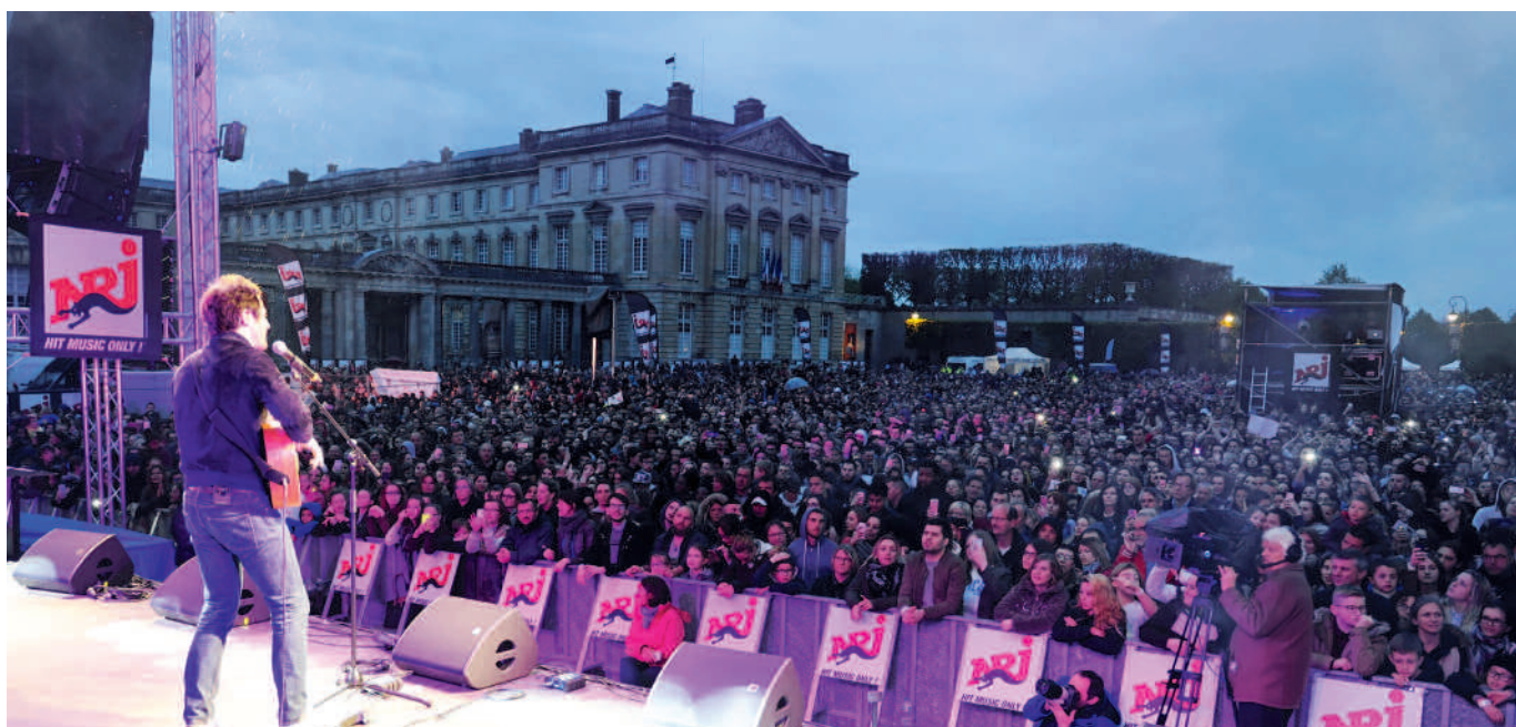
Record battu cette année. 25 000 spectateurs assistent au couronnement de la Reine et au concert du NRJ Music Tour, place du Palais.