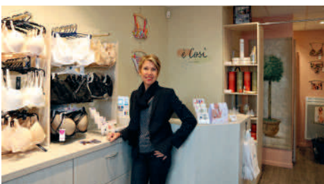
à Cosi Lingerie 5 rue Jean Legendre