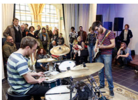
◀ Coup d'essai confirmé pour le Festival Le temps qui fuzz.

L'association Compiègne, Les Vitrines de Votre Ville propose aux Compiégnois de renouer avec les joies du potager urbain.