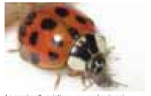
La coccinelle asiatique, une espèce invasive nuisible.

Pour lutter efficacement contre ces espèces invasives, il convient de rééquilibrer l'écosystème par des mesures simples : par exemple en prévoyant nichoirs et nourriture pour les oiseaux dans son jardin afin d'attirer mésanges et hirondelles qui se feront un plaisir de vous aider dans la lutte contre les parasites. ■