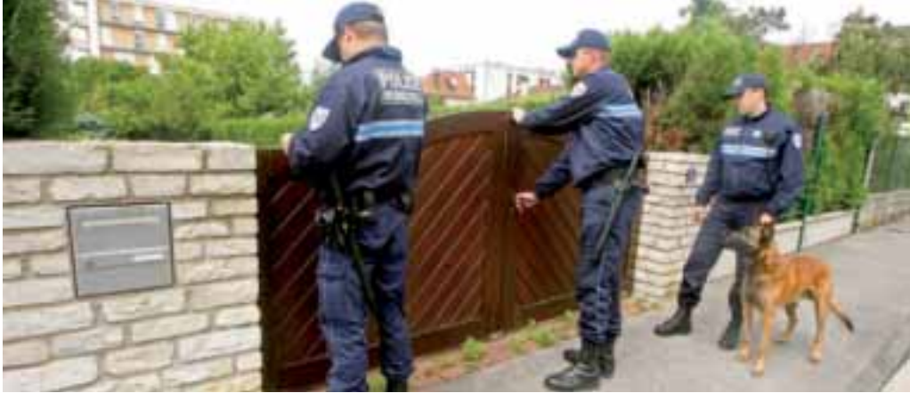
La Police municipale organise des rondes et patrouilles durant la période des vacances. Les policiers veillent à la bonne fermeture des accès des habitations. Une attestation de passage est alors délivrée dans la boîte aux lettres.

L'été, c'est le temps des vacances, de la détente et durant lequel on oublie les soucis du quotidien. Mais parfois le retour à la maison réserve quelques mauvaises surprises. Volets forcés, armoires ou coffres fracturés, valeurs ou objets dérobés. Là aussi, le dicton "il vaut mieux prévenir que guérir" mérite d'être appliqué.