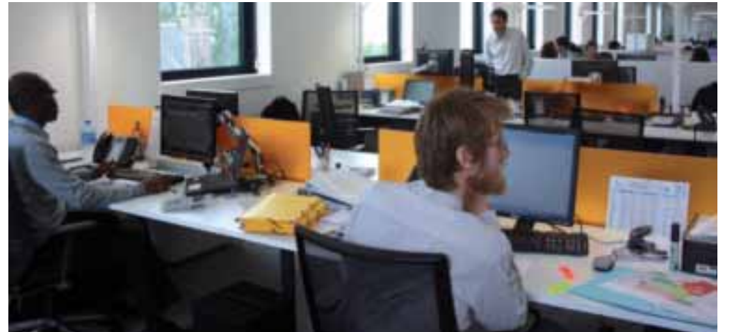
L'entreprise Brézillon transfère son siège Zac des Deux Rives.

La ZAC des Deux rives autour du Pont Neuf a vu arriver ses premières activités, avec l'emménagement de la société Brézillon le 4 juin, dans un bâtiment basse consommation qui s'intègre parfaitement à son environnement. Cette entreprise locale réputée a construit un siège comprenant 250 postes de travail, des salles de réunions, une salle