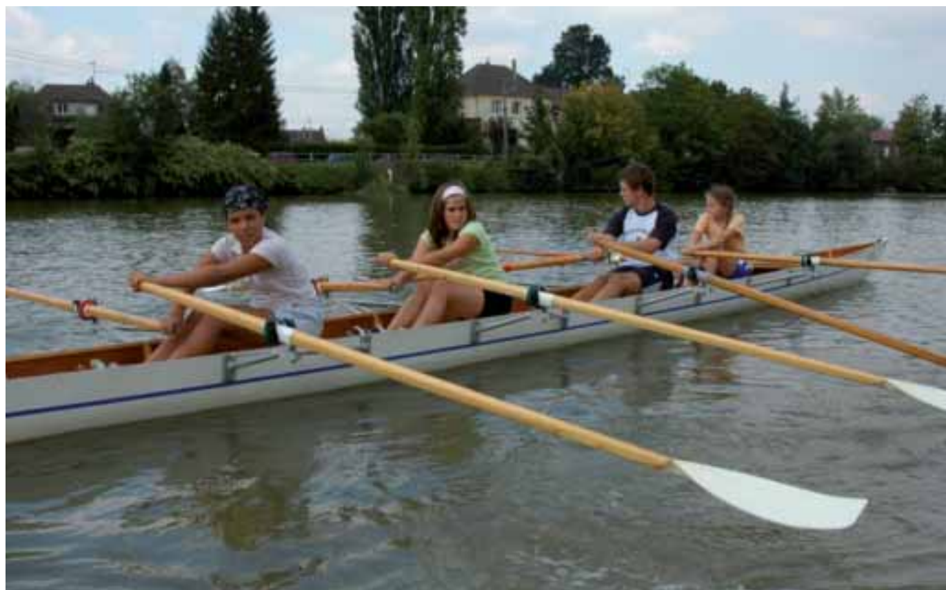
Profitez de l'Eté des jeunes pour aller à la découverte d'une nouvelle activité sportive ! Tout le programme page 11.

Des cuisines à la table de l'Empereur, empruntez le chemin des cuisiniers et découvrez comment se préparaient et s'organisaient les repas... avant de décorer une assiette en atelier. Les 2, 4, 5, 6, 9 et 11 juillet à 15h.