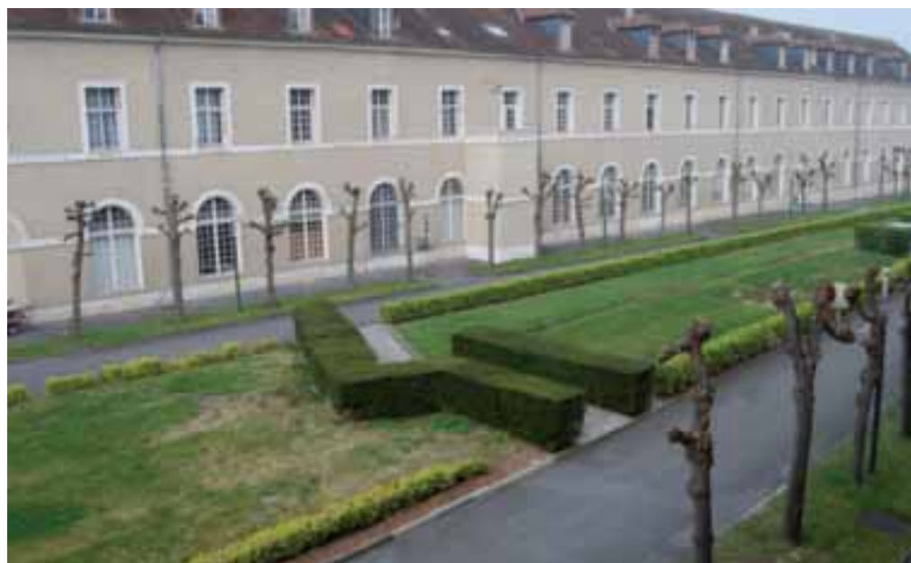
Le site de l'Ecole d'Etat-Major offrira de nouvelles perspectives de développement.

Ce Centre de Congrès sera réalisé dans une seconde phase du projet, en plein cœur du site, à l'emplacement de l'ancien manège et du gymnase de l'Ecole d'Etat Major. Il pourra accueillir quelques 450 participants et sera associé à la création d'un hôtel 3 ou 4 étoiles à l'angle du cours Guynemer et de la rue Othenin.