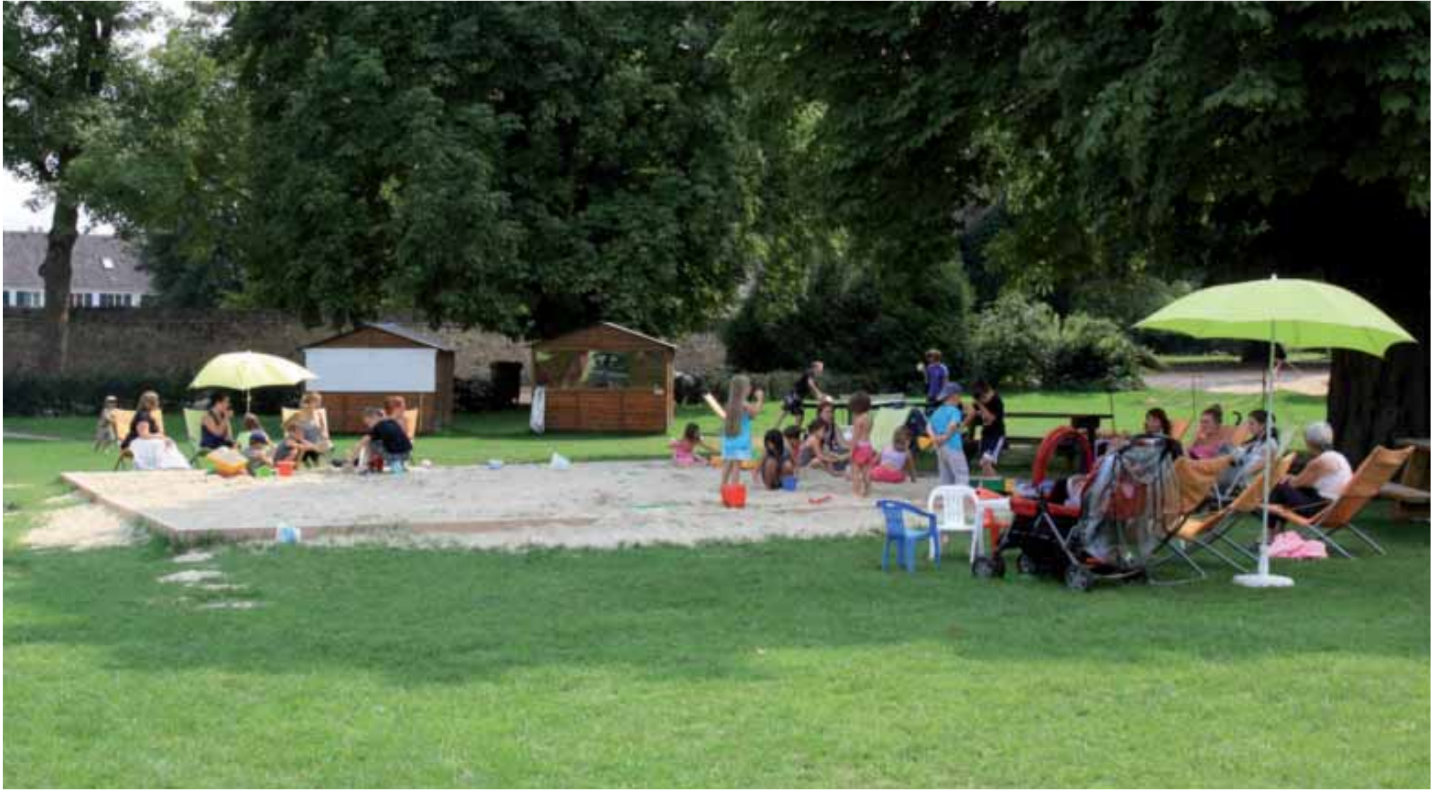
Compiègne plage au parc de Bayser, du 9 juillet au 24 août.