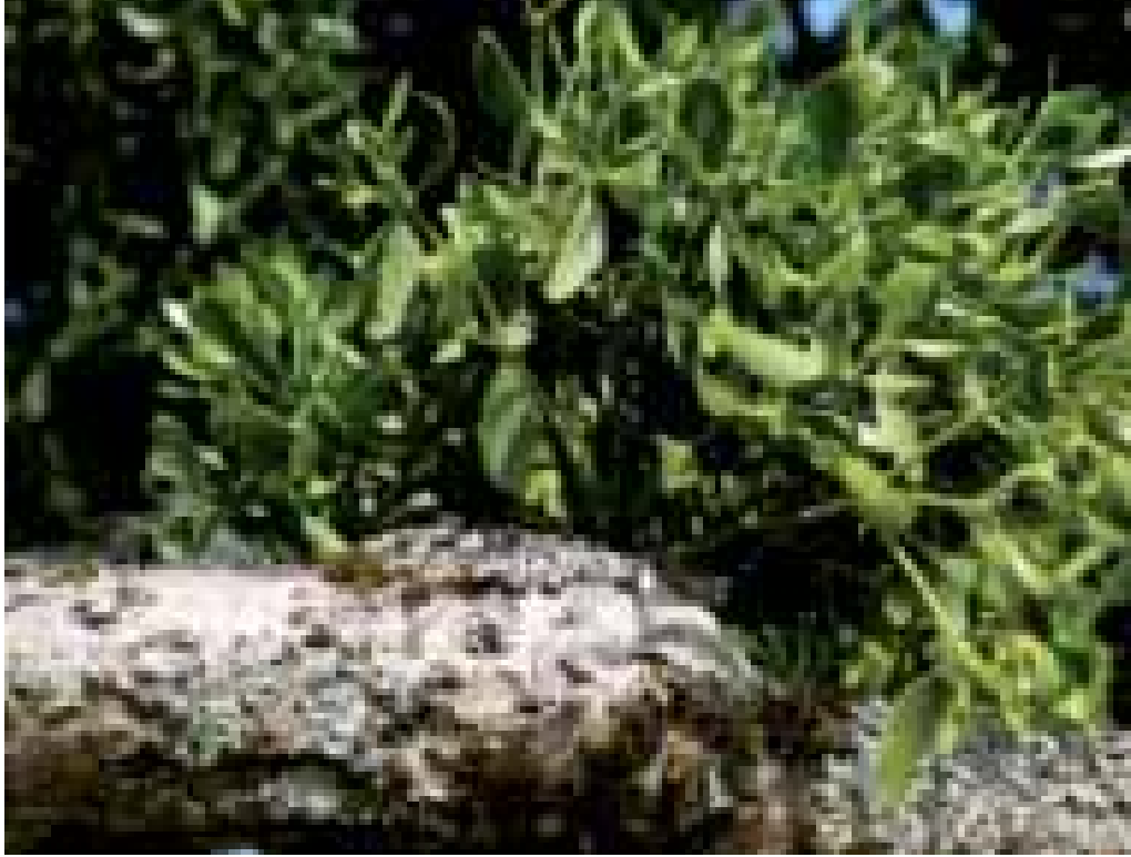
Le gui, plante parasite par excellence.

Avec le retour des beaux jours, il est agréable de voir les arbres bourgeonner et fleurir, mais on oublie trop souvent que c'est également à cette période de l'année que les parasites prolifèrent, avec ce qu'ils peuvent engendrer comme maladies pour les végétaux. Voici quelques conseils pour lutter contre leur développement.