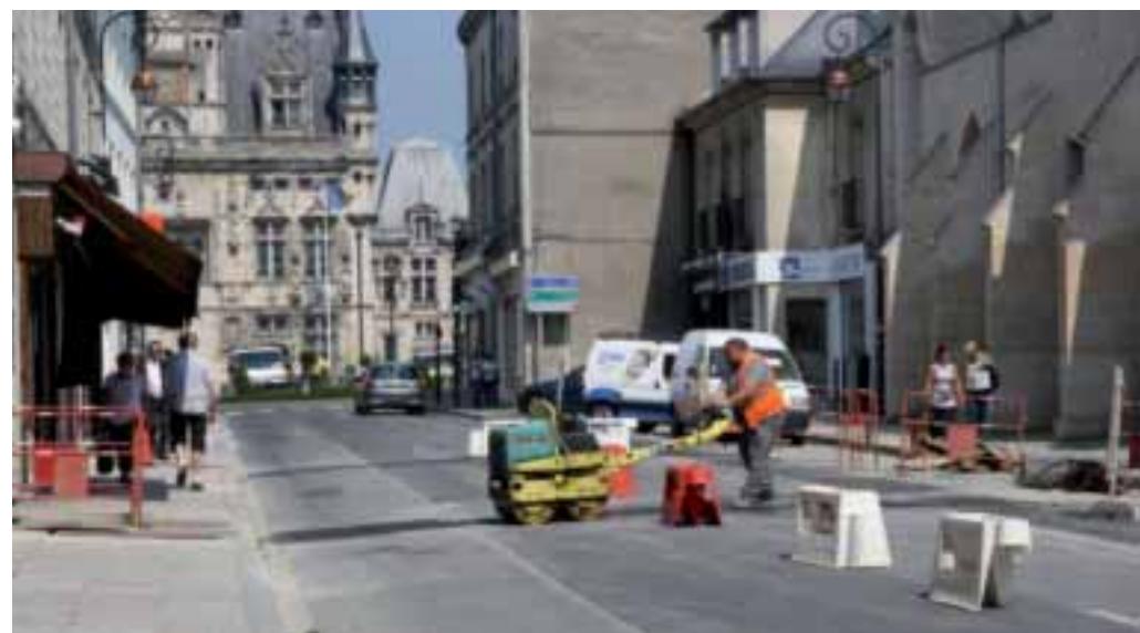
La rue Saint-Corneille, en travaux.

La période estivale est chaque année mise à profit par les services techniques pour entretenir, rénover les bâtiments municipaux et entreprendre les gros travaux de voirie susceptibles d'engendrer quelques perturbations de circulation. Voici le programme établi pour cet été.