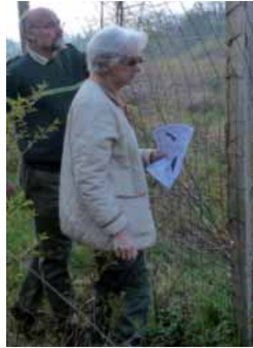
Des enclos ont été aménagés pour protéger les plantations.

La forêt est vivante et pour la transmettre aux générations futures, il faut qu'elle se régénère avec des essences adaptées. Cette