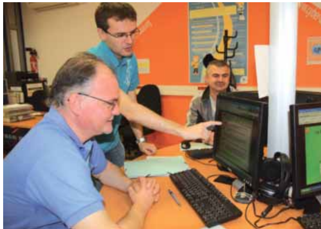
Des ateliers informatiques pour tout public.

En partenariat avec le Pôle emploi et la Maison de l'Emploi et de la Formation, des ateliers informatiques sont proposés dans les espaces Cyber-base de Compiègne.