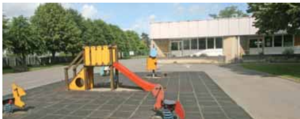
Les établissements scolaires feront eux aussi l'objet de toutes les attentions pour permettre une rentrée dans les meilleures conditions.