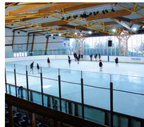
Patinoire de Mercières.

mité de la patinoire. Ceux-ci consisteront, d'une part, à changer le groupe froid permettant la circulation du liquide frigorigène, conforme à la réglementation et, d'autre part, à remplacer le support en sable recevant le tapis glacé, par une dalle en béton très stable mécaniquement. Cette opération, d'un montant de 1 662 200 euros TTC, prendra fin au 31 octobre 2014.