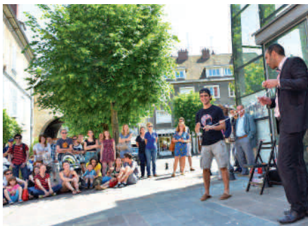
Les étudiants de l'UTC ▶ ont consacré une semaine au Festupic 2014. Concerts, spectacles et scènes de rues étaient au menu.