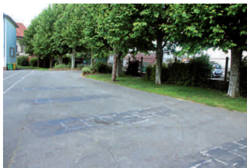
Cour de l'école Hammel.