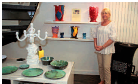
Au relais des tendances - Décoration contemporaine 4, rue Jean Legendre