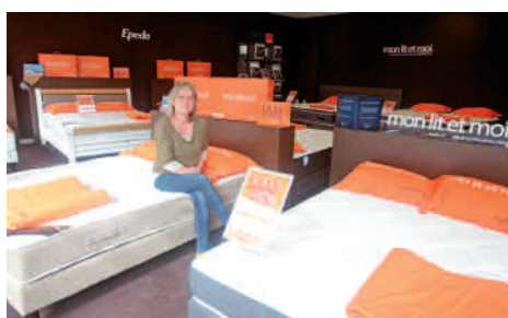
Mon lit et moi - Literie 4, rue des Domeliers