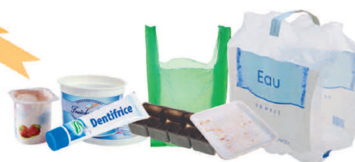
Les emballages en plastique