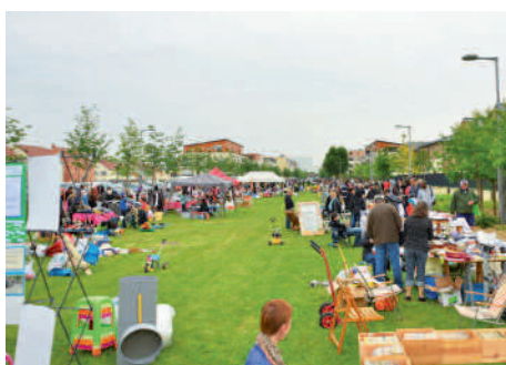
◀ Brocante du Camp de Royallieu Avec un peu plus de 100 exposants, cette 2 e édition a attiré bon nombre de visiteurs.