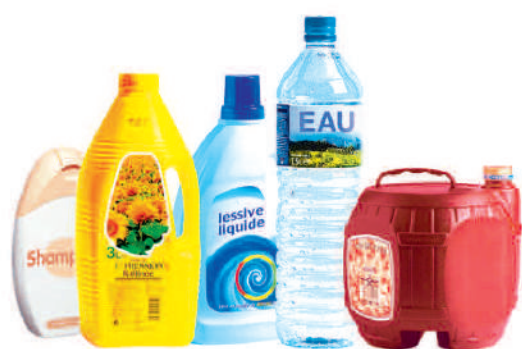
Les bouteilles et flacons en plastique