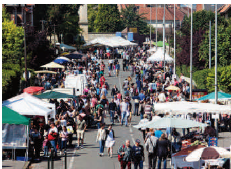
Tout le quartier Saint-Germain ▶ était envahi pour les traditionnelles Capucinades.