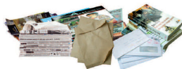
Les papiers, journaux, magazines, enveloppes...