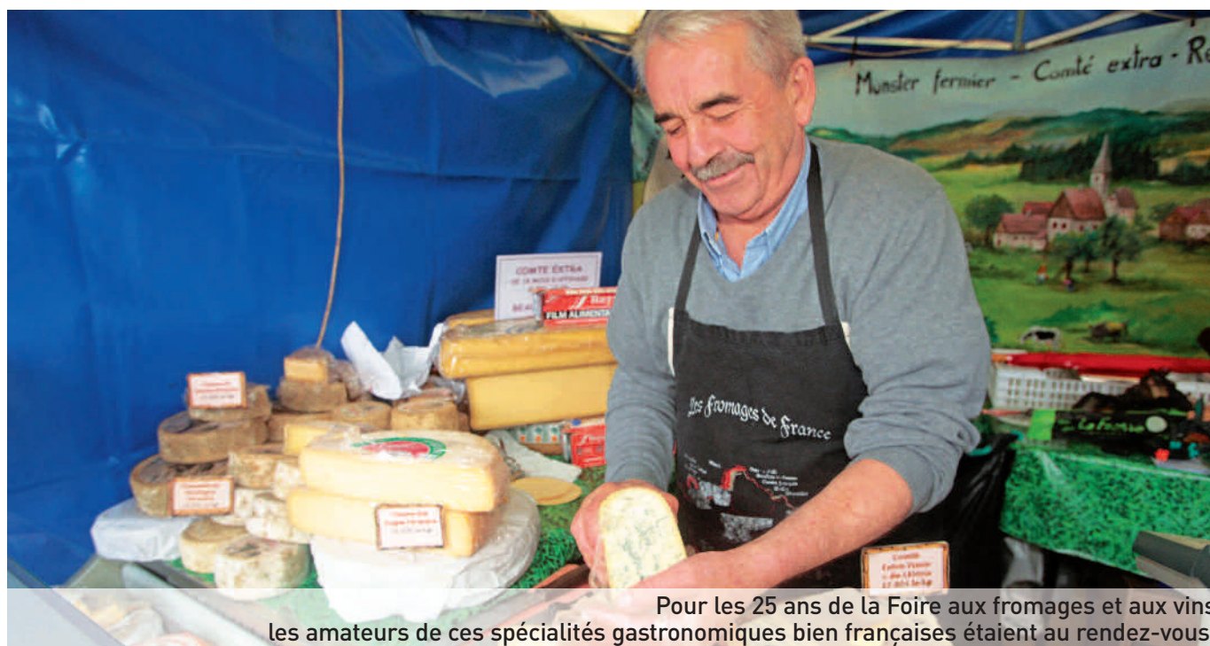
Pour les 25 ans de la Foire aux fromages et aux vins les amateurs de ces spécialités gastronomiques bien françaises étaient au rendez-vous.