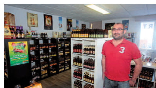
Bières et Compagnie - Gros et Détail 4, avenue Henri-Adnot (Zac de Mercières)