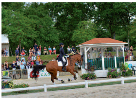
◀ Internationaux de dressage Un large public est venu applaudir les cavaliers de cette 4 e édition.