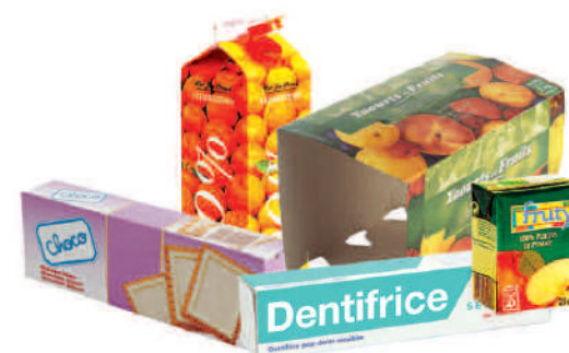
Les cartons et briques alimentaires