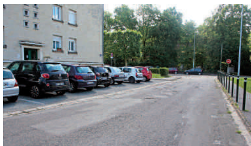
Rue de Champagne avant travaux.

Par ailleurs, dans le cadre des travaux d'aménagement de l'ex-cinéma "Les