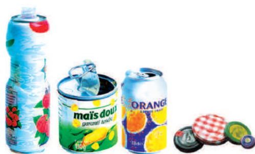
Les emballages, couvercles et capsules métalliques