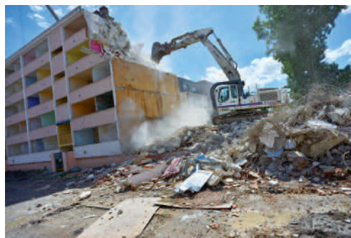
Démolition de l'immeuble square Gérard de Nerval.

La démolition des immeubles programmée dans le cadre de l'ANRU a repris au Clos des Roses. Fin mai, le quartier a vu l'immeuble du square Gérard de Nerval construit en 1967 et ses 30 logements, être progressivement détruits. D'ici la fin de l'été, ce sera au tour des résidences situées rues Paul Verlaine et Alexandre Dumas d'être démolies. Le dernier immeuble concerné étant celui de la rue Pierre Loti.