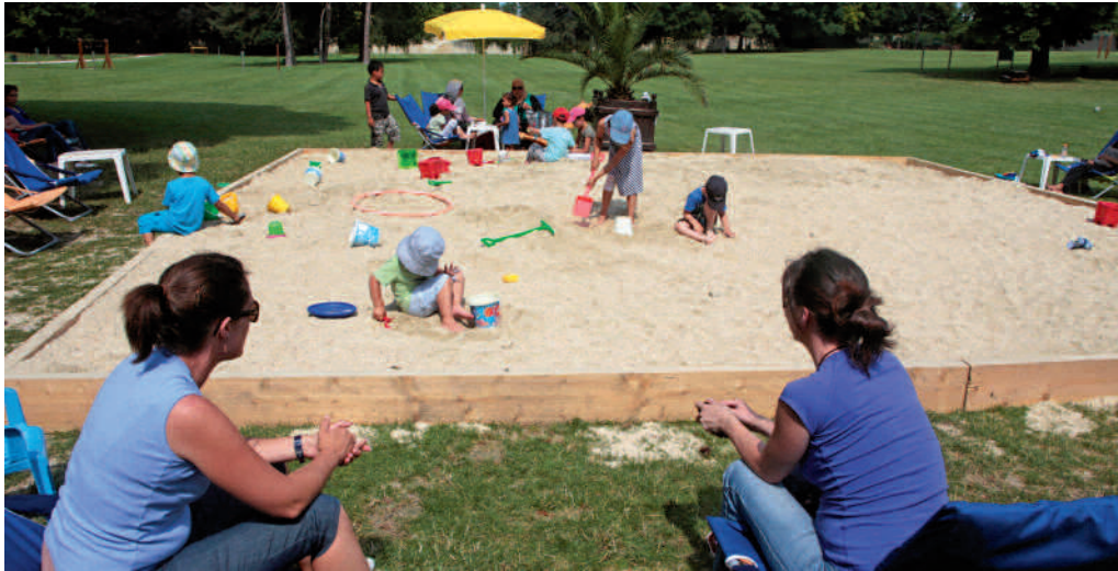
Compiègne Plage au Parc de Bayser, entre amusement et détente.

Avec les beaux jours vient le temps des vacances, de partager des moments de joie entre amis, de s'adonner à des activités sportives, culturelles et ludiques que l'on n'a pas forcément l'habitude de pratiquer pendant l'année. L'Été des Jeunes, avec une multitude d'animations, est là pour vous faire profiter au maximum de cette période estivale et vous permettre de découvrir de nouveaux horizons, pour des vacances réussies !