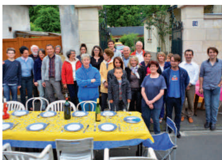
◀ La Fête des Voisins, un peu partout dans la ville.