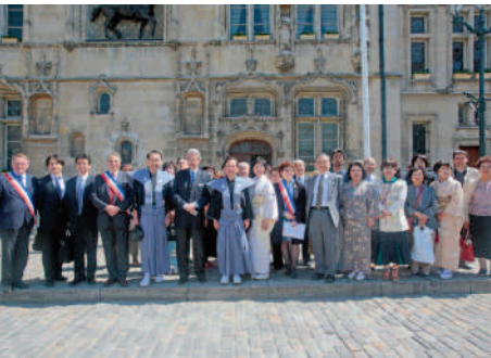
◀ 25 ans de jumelage avec Shirakawa Une délégation de la cité nipponne était en visite à Compiègne.