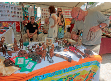
◀ Le 2 ème marché africain s'est tenu place Saint-Jacques avec musique, vêtements colorés et spécialités gourmandes.