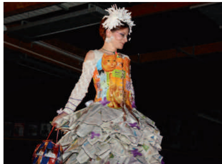
Un défilé bien recyclé ▶ où savoir-faire et imagination se sont exprimés.