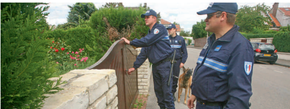
Des rondes de surveillance sont organisées par la police municipale durant ces vacances estivales. Les policiers veillent à la bonne fermeture des accès et peuvent agir en cas de besoin.

"Il convient avant tout de ne pas être cambriolable !" C'est le premier conseil dispensé par les policiers municipaux qui veillent comme chaque année aux demeures laissées par leurs habitants pour un temps de repos estival.