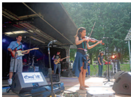
Festupic 2013 ▶ Les étudiants de l'UTC ont partagé des instants de fête avec les Compiégnois.