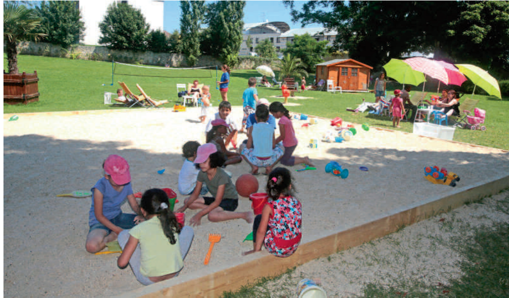
Venez profiter des nombreuses activités de plein air au Parc de Bayser !

Les grandes vacances approchent... C'est l'occasion pour nos enfants de goûter un repos mérité après une année scolaire bien remplie. La Ville et les associations compiégnoises se mobilisent durant tout l'été pour accueillir dans les meilleures conditions les enfants et les jeunes en leur proposant des activités attrayantes et dynamiques, gages de vacances réussies.