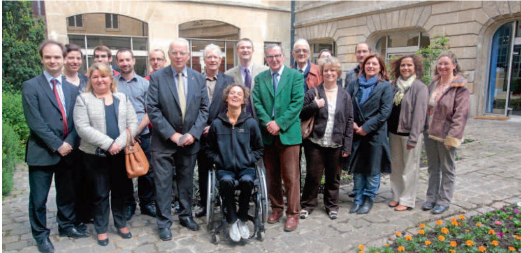
Les lauréats de ce Trophée du handicap ont été choisis par les clubs service.

Initiés par les clubs service de Compiègne et par l'élu municipal délégué au monde handicapé, Rémi Lemaistre, les Trophées du handicap sont décernés tous les deux ans.