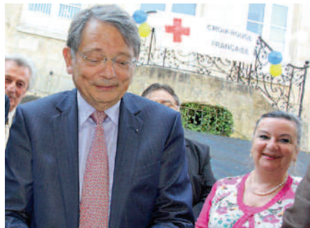
La Crèche de la Croix-Rouge ▶ inaugure ses structures multi-accueil en présence de Jean-François Mattei.