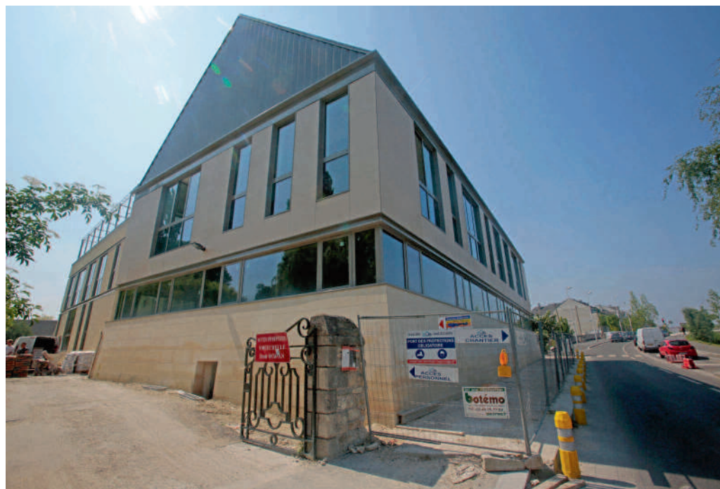
Le Centre d'études et d'exposition Antoine Vivenel sera opérationnel à l'automne.

Comme chaque année, la période estivale est mise à profit pour entretenir, rénover les installations existantes et réaliser le maximum de travaux avant la rentrée. Point sur le programme de cet été.