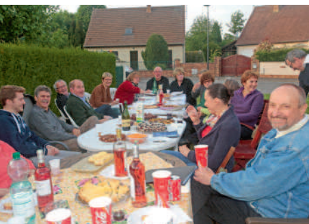
◀ De nombreux Compiégnois se sont réunis pour la Fête des voisins.