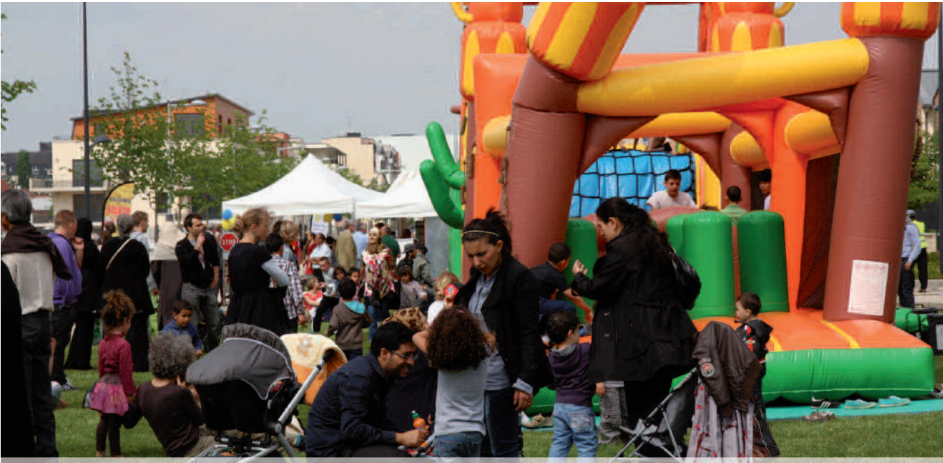
Fête du quartier du Camp de Royallieu. Les rues de ce secteur de Compiègne ont été officiellement inaugurées.