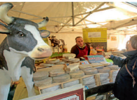
◀ La 24 ème édition de la foire aux fromages et aux vins a reçu près de 50 000 visiteurs.