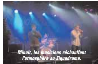
Minuit, les musiciens réchauffent l'atmosphère au Ziguodrome.