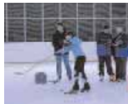
20 heures, c'est parti pour le décastade de l'Office des Sports !

Avec plus de 43 000 euros de dons, les Compiègnais ont encore prouvé qu'ils savaient se mobiliser pour le Téléthon. Pluie, vent, et froid n'auront pas eu raison des coureurs qui ont assuré le fil rouge sur 24 heures, ni des motards réunis sur le champ de manœuvres du 25 ème RGA pour les 20 heures d'endurance motos, ni de ceux qui tenaient tout simplement un stand. Félicitations et merci à tous, associations, entreprises et donateurs, et à l'année prochaine.