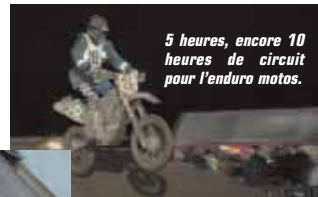
5 heures, encore 10 heures de circuit pour l'enduro motos.