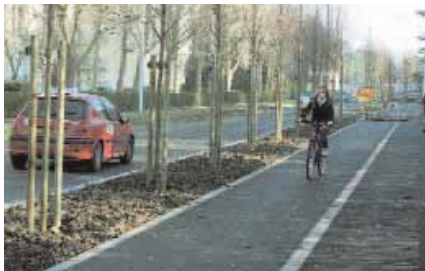
Les cyclistes doivent emprunter les pistes cyclables qui leur sont réservées.

Trop souvent les deux-roues et particulièrement les vélos, sont victimes d'accidents. Trop souvent aussi, les cyclistes et utilisateurs de scooters et autres deux-roues motorisés se rendent coupables d'infractions. A ce titre, les animateurs de clubs cyclistes sont notamment de bon conseil.