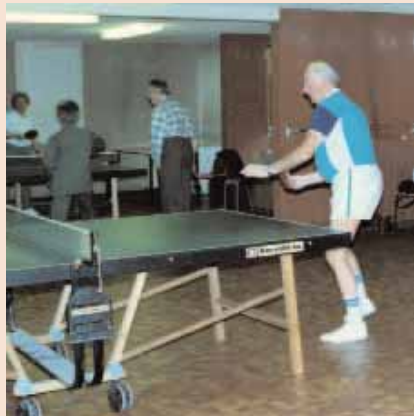
Séance de tennis de table de l'ASPAC.