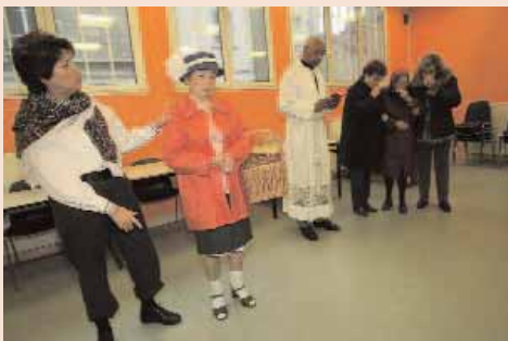
Le théâtre permet au corps de s'exprimer et à la mémoire de s'exercer. Un très bon exercice et une occasion unique d'échanger dans la bonne humeur.

Tous les vendredis de 15h à 17h, rue de la Surveillance.