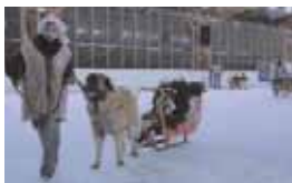
Interlude sur la glace avec Compiègne Education Canine.