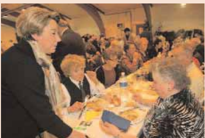
Le repas de fin d'année des anciens est une occasion pour échanger et se rencontrer autour d'un bon repas.

Le repas de fin d'année offert par la Ville et les clubs et loisirs des retraités réunit chaque année plus de 1000 convives au Centre de rencontres de la Victoire. Un après-midi convivial que les personnes retraitées partagent entre amis peu avant les fêtes de Noël.