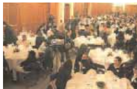
Les salles Saint-Nicolas ont servi de cadre à cette première opération "Partageons le CV" qui a vu la participation de plus de deux-cent cinquante demandeurs d'emplois qui ont pu rencontrer des employeurs potentiels.

En matière de lutte contre le chômage il n'existe pas, loin s'en faut, de recette miracle. La formule des chantiers d'insertion se présente toutefois comme un moyen efficace de retrouver un travail. Compiègne joue pleinement cette carte dans trois domaines notamment. Le bâtiment avec l'association Elan CES, l'entretien des jardins et espaces verts avec l'opération "un château pour un emploi" menée en partenariat avec le domaine du château de Compiègne, la restauration avec l'association Service emploi citoyenneté et le cercle mess de l'Ecole d'Etat-Major de l'Armée de Terre. Grâce à ces chantiers, les bénéficiaires acquièrent une formation et une expérience professionnelle qui facilitent leur engagement professionnel.