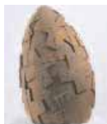
Egg - David Nash

Sculpture et estampe sont à l'honneur en ce début d'année à Compiègne. Une exposition consacrée à David Nash, artiste-plasticien britannique de renom, met l'accent sur ses œuvres sculptées en forme d'œufs ou de bourgeons, des volumes aux formes simples d'une belle expressivité.