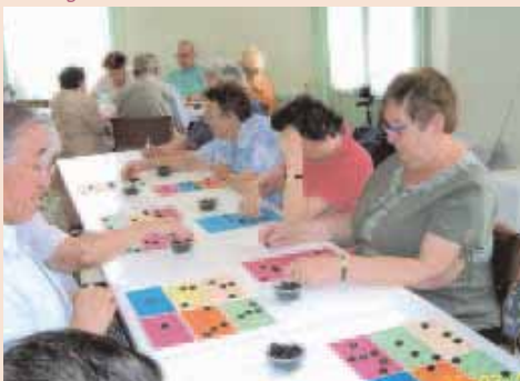
Une séance de loto pour se distraire.

• Jeux et activités sont également le quotidien des quatre foyers-clubs de Compiègne auxquels la Ville apporte son soutien logistique et financier. Chaque jour, les personnes peuvent se retrouver autour de jeux de société, tarot, scrabble, rami, belote, jouer aux boules, participer à l'atelier lecture ou encore faire des activités manuelles telles que du tricot ou de la broderie.