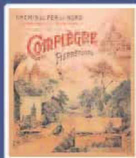
Exposition "100 ans de tourisme, Compiègne s'affiche" p.19