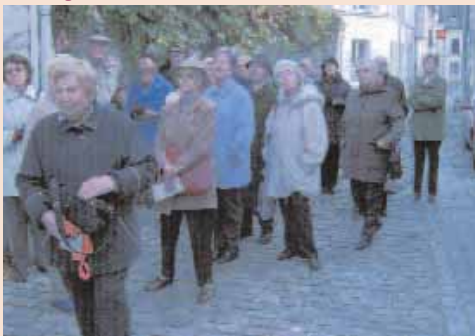
La visite d'une ville permet de poursuivre sa quête de connaissance et de la transmettre à son entourage.

• Les conférences "Connaissance du monde" proposées au cinéma Les Dianes sont l'occasion de découvrir divers pays et de réaliser le temps de la projection du film, un voyage culturel à moindre coût !