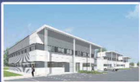
Holdiparc sort de terre p.7