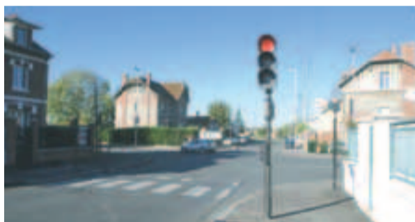
Angle du boulevard Gambetta, de la rue des Frères Gréban et de l'avenue Weygand