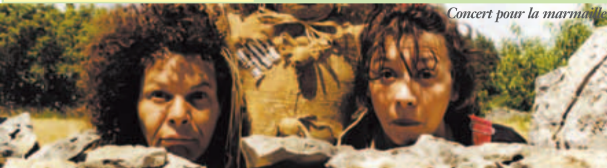
Concert pour la marmaille