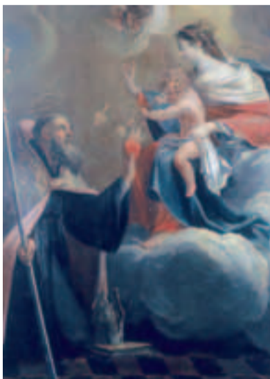
Saint Augustin offrant son cœur à la Vierge, école française du XVII e me.

Visites, animations : Service des publics des musées : Luc Camino - Tél. 03 44 20 26 04.