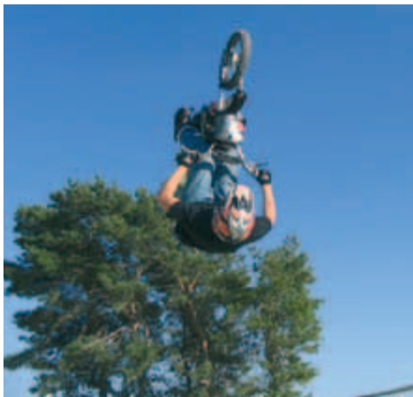
Des démonstrations de free style se dérouleront au stade Lucien Genaille.