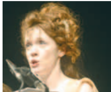
Jane Birkin, Jeanne Moreau, Madeleine Potter et Greta Scacchi parlent avec émotion d'Ismail Merchant.