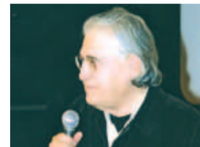
Patricio Guzman, réalisateur, scénariste chilien présente "Mon Jules Verne".