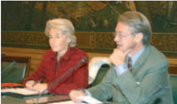
Le partenariat entre Beauvais et Compiègne se poursuit. Une nouvelle rencontre a eu lieu dans la cité impériale.

Une nouvelle rencontre a eu lieu entre élus et responsables administratifs de Compiègne et de Beauvais. Un partenariat né en 2004 qui trouve sa principale illustration dans ces fréquents échanges d'informations et d'expériences.