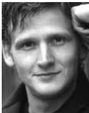
Dennis Gansel, réalisateur, scénariste, producteur allemand, remporte le Prix du Public pour son film émouvant "NAPOLA"