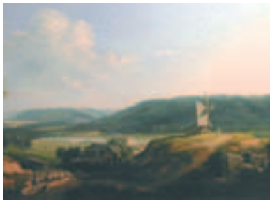
Vue du moulin de Choisy-au-Bac.

Le musée Antoine Vivenel, avec l'aide de l'Association des Amis des musées, vient d'acquies à Paris deux toiles de Charles Claude Delaunay (Paris, 1793 - ap. 1848) : Vue du moulin de Choisy-au-Bac et Vue de l'église de Choisy-au-Bac, datables du début des années 1830. Le Moulin, reconstruit en 1773, fonctionna jusqu'au Second Empire ; l'Eglise paroissiale de la Sainte Trinité, des XII e et XIII e siècles, classée Monument Historique en février 1920, fit l'objet d'une restauration radicale de 1856 à 1885. Le calvaire, à gauche, subsiste, déplacé, souvenir d'un cimetière désaffecté en 1933. Les deux tableaux témoignent donc d'un état disparu de cette localité de la vallée de l'Oise.