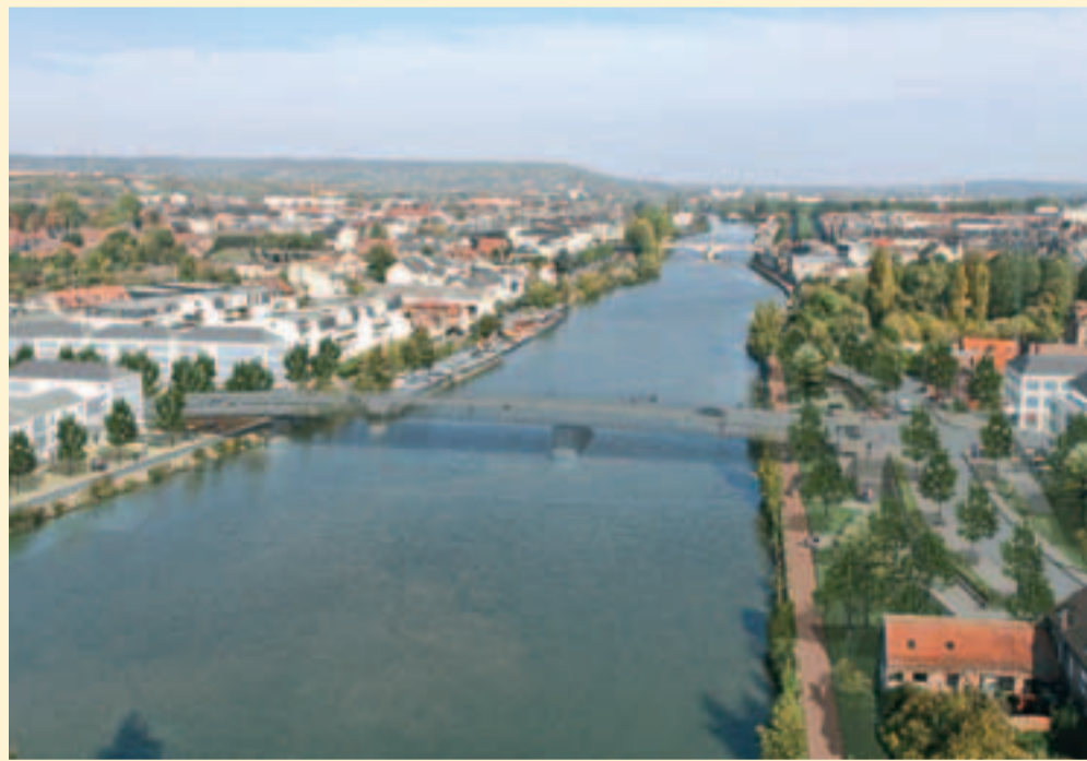
Esquisse du futur pont urbain et des aménagements envisagés à son débouché sur la rive droite et la rive gauche de l'Oise. Au fond le pont Solférino.

Philippe MARINI Président de l'ARC Maire de Compiègne Sénateur de l'Oise