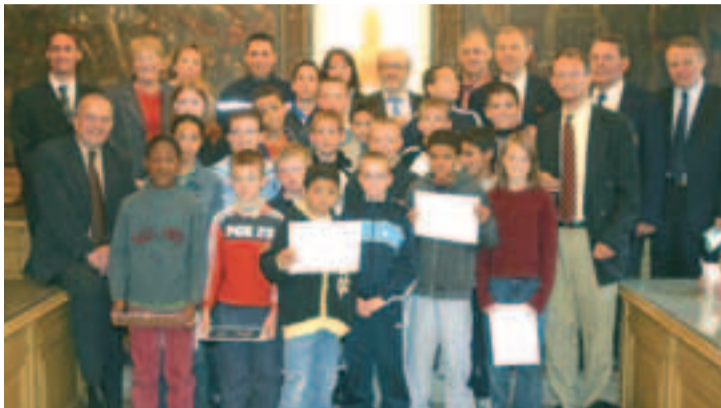
Les jeunes participants à l'opération Vie Ville Vacances ont reçu leur attestation de formation aux gestes de premiers secours. Une expérience qui va se renouveler.

Cérémonie très particulière dans la salle du conseil de l'hôtel de ville. Dix-huit jeunes enfants des quartiers de Compiègne ont reçu leur attestation de formation aux gestes de premiers secours.