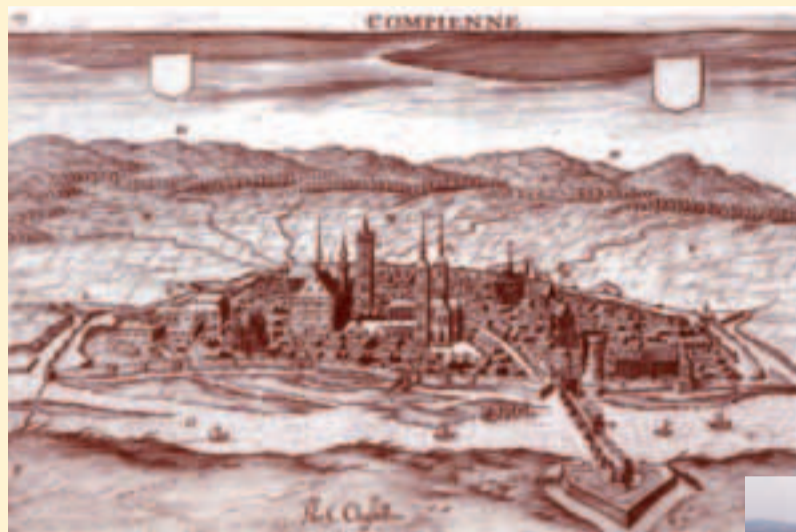
Compiègne en 1641. La ville est fortifiée et parée de nombreux édifices religieux.

Aujourd'hui, une nouvelle phase s'impose. Donner un nouveau souffle et de la fluidité au centre-ville, mieux relier les deux rives de l'Oise et équilibrer le cœur d'agglomération, répondre à la forte demande de logements de la part des particuliers mais aussi d'espace pour permettre le développement de l'UTC et de la polyclinique Saint-Côme, enfin corriger certains aspects négatifs de l'habitat collectif des années 60 au Clos des Roses, les enjeux sont nombreux.