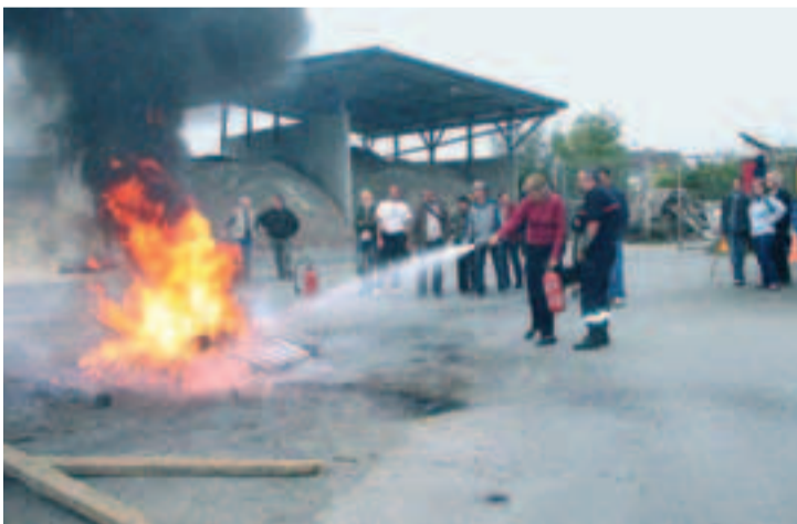
Premier exercice du genre pour les membres du DSQ, apprendre à lutter contre un début d'incendie. Un entraînement qui peut être salutaire.

Exercice grandeur nature pour un groupe de personnels qui œuvre quotidiennement au sein du Développement social des quartiers. Il s'agissait de procéder à l'extinction d'un début d'incendie.