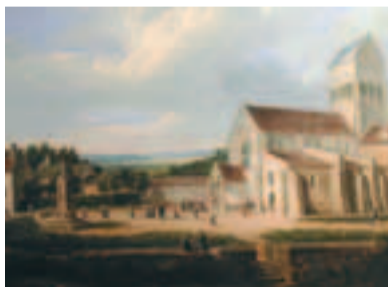
Vue de l'église de Choisy-au-Bac.

Le musée Antoine Vivenel, avec l'aide de l'Association des Amis des musées, vient d'acquies à Paris deux toiles de Charles Claude Delaunay (Paris, 1793 - ap. 1848) : Vue du moulin de Choisy-au-Bac et Vue de l'église de Choisy-au-Bac, datables du début des années 1830. Le Moulin, reconstruit en 1773, fonctionna jusqu'au Second Empire ; l'Eglise paroissiale de la Sainte Trinité, des XII e et XIII e siècles, classée Monument Historique en février 1920, fit l'objet d'une restauration radicale de 1856 à 1885. Le calvaire, à gauche, subsiste, déplacé, souvenir d'un cimetière désaffecté en 1933. Les deux tableaux témoignent donc d'un état disparu de cette localité de la vallée de l'Oise.