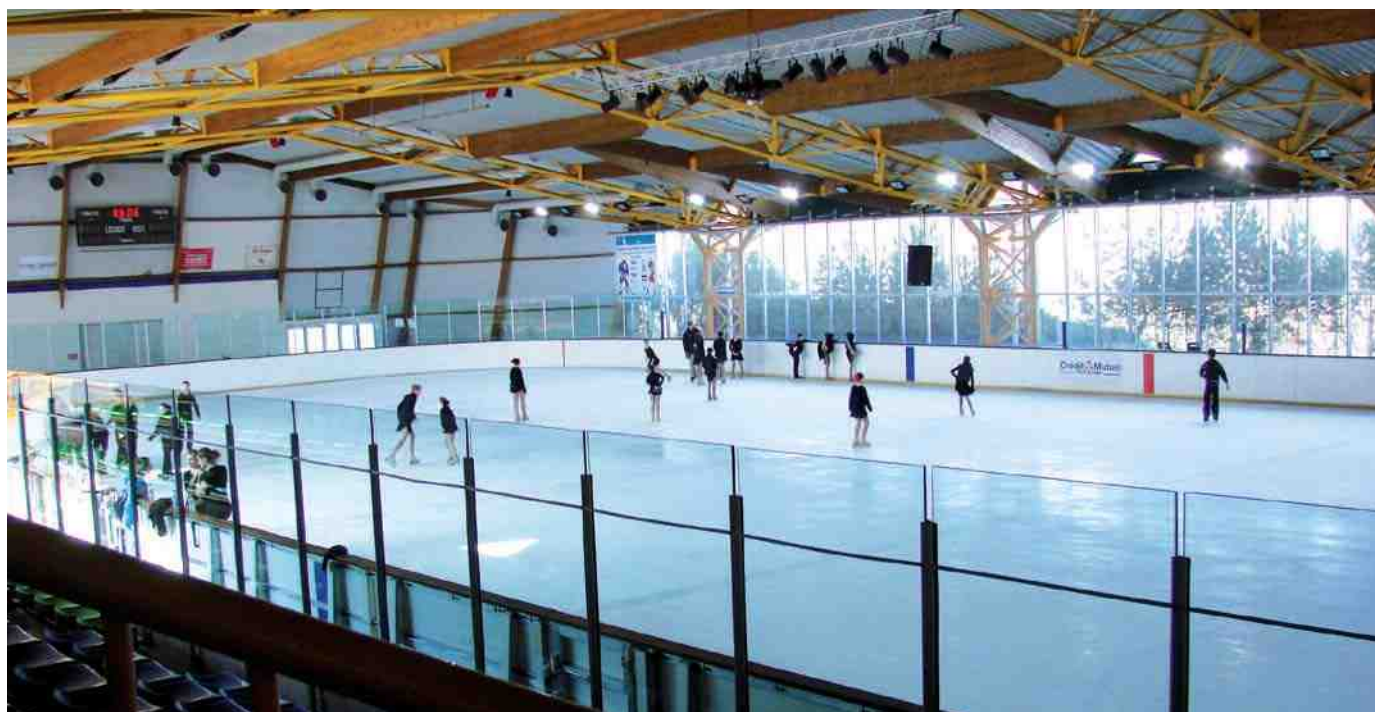
Priorité sera donnée aux opérations pluriannuelles déjà en cours comme le programme de rénovation urbaine au Clos des Roses, ou encore à la réhabilitation du Musée Vivenel et la mise aux normes de la patinoire.

Des économies seront réalisées au niveau des charges de gestion courantes, et les charges de personnel seront pratiquement reconduites à leur montant de 2013. Le remplacement des agents partant à la retraite fera l'objet d'un