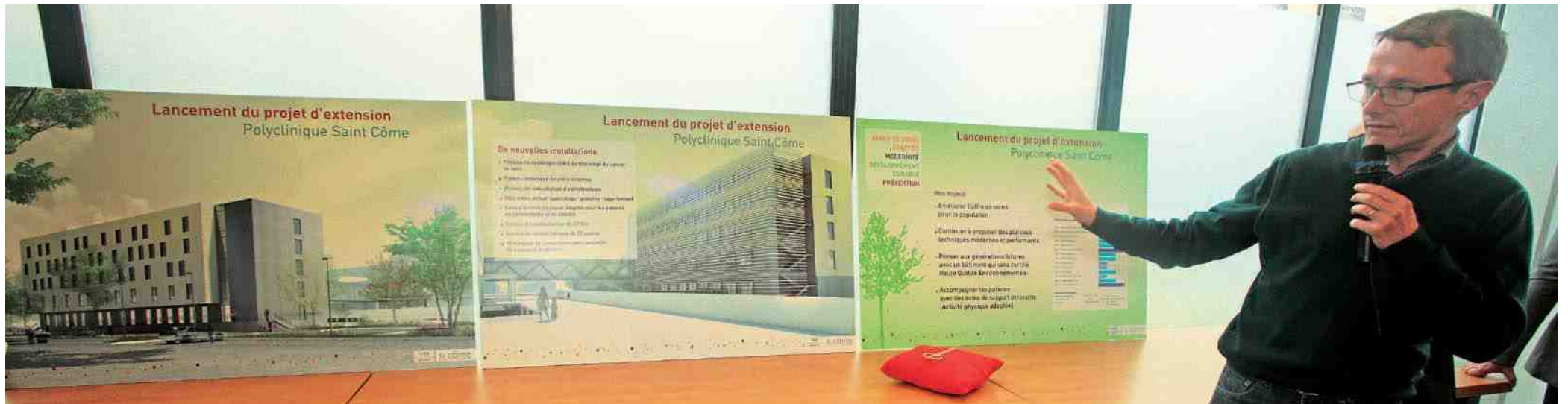
Présentation du futur bâtiment de l'extension de Saint-Côme par son architecte. L'ouverture est prévue pour début 2016.

Dotée de nouveaux locaux installés en 2009 sur le site de l'ancien camp militaire de Royallieu, la clinique Saint-Côme a joué la carte de l'avenir. Aujourd'hui l'établissement reçoit 40 000 patients à l'année dont 16 000 en urgence. Dans la même année, 1400 accouchements sont enregistrés. Par ailleurs, Saint-Côme traite un cancer sur trois soit près de 30% de la cancérologie du Département et s'inscrit comme le premier pôle de chirurgie ambulatoire de la région Picardie.