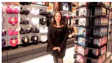
DIM, lingerie hommes, femmes, enfants. 2, rue Saint-Corneille