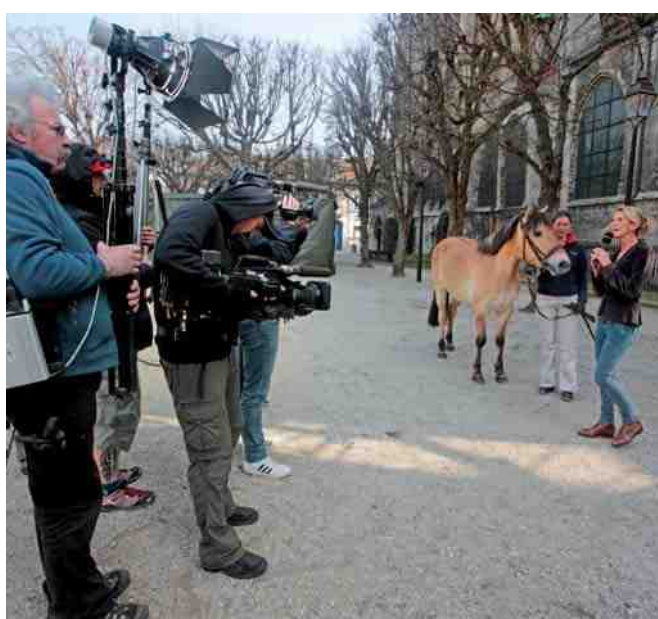
Un habitué du Marquenterre, le Henson, a fait le voyage pour être présent à Compiègne sur le plateau de Midi en France .