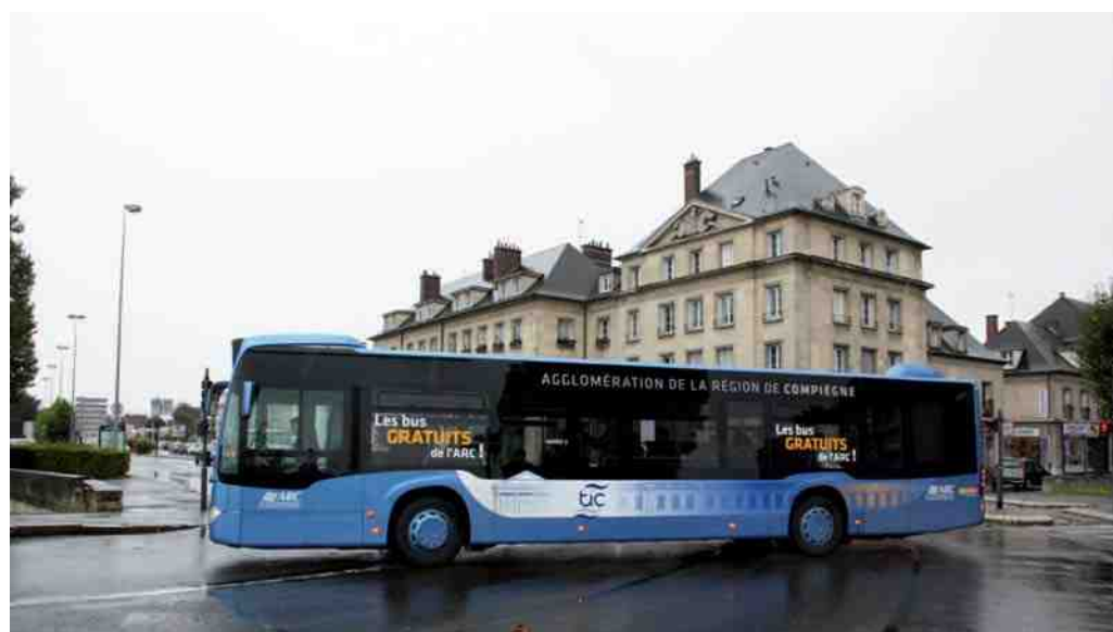
Un service "express" est mis en place sur la ligne 2.

Depuis juillet 2013, date à laquelle les transports intercommunaux ont fait l'objet d'un important remaniement, la ligne 2, qui a été prolongée jusqu'au centre commercial de