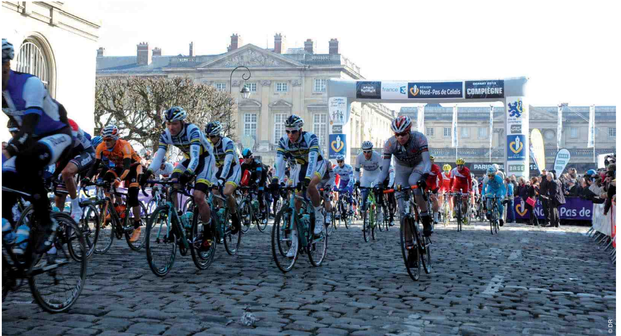
Le départ du 112 ème Paris-Roubaix aura lieu le 13 avril à 10h15, place du Palais.