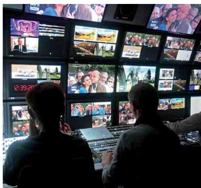
Dans l'ombre du car régie de France 3 ont été réalisées les cinq émissions de Midi en France à Compiègne.