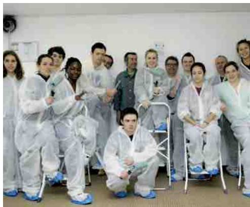
7 paliers ont été repeints au 1 square Berlioz. Une opération soutenue et encouragée par Picardie Habitat.

Le 19 février dernier, ils étaient une centaine de nouveaux étudiants arrivés récemment à Compiègne, à mettre leurs talents, leur dynamisme et leur générosité, au service de la Cité.