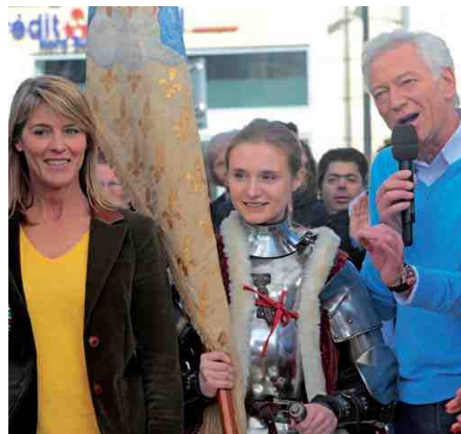
Jeanne d'Arc demeure un personnage essentiel de Compiègne, ce qui explique sa présence au cours de l'émission.