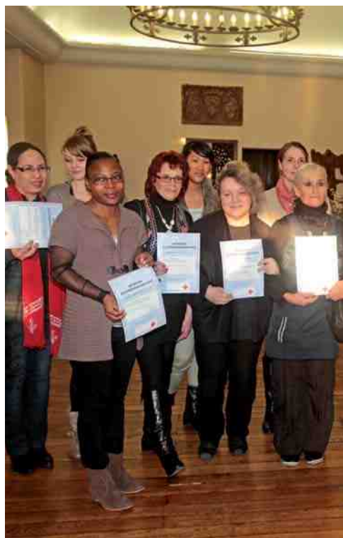
La cérémonie de remise des diplômes s'est déroulée à l'Hôtel de Ville.

Dix-sept salariées de l'atelier d'insertion Au Fil de l'Eau ont reçu leurs attestations de formation aux premiers secours dispensée par la Croix-Rouge.