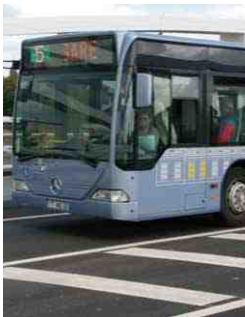
L'utilisation des transports urbains contribue à limiter l'émission de gaz à effet de serre.