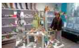
Charles Abel Chaussures 11 rue du Général Leclerc

Pour la 10 ème année, l'association Le sourire d'un enfant illumine le monde organise un forum pour l'emploi "A la rencontre des entreprises" destiné à favoriser un contact direct entre les demandeurs d'emploi et les responsables d'entreprises.