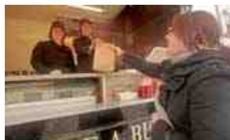
Le Kiosque à Burgers rue Saint-Corneille