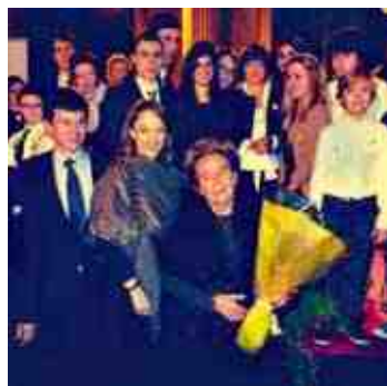
Pour Bernadette Chirac, la clôture nationale des Pièces jaunes organisée à Compiègne "est la plus belle depuis 24 ans !"

Samedi 16 février, la clôture nationale de l'opération Pièces jaunes a eu lieu au Palais impérial en présence de Bernadette Chirac, Présidente de la Fondation Hôpitaux de Paris-Hôpitaux de France.