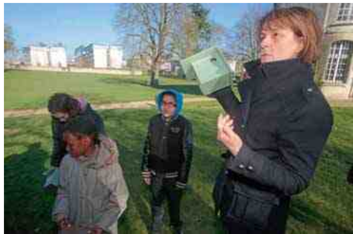
Chaque nichoir à mésanges porte le nom de l'enfant qui l'a fabriqué.

Un partenariat entre le Service des Espaces Verts de la Ville et le service d'animation du Développement Social des Quartiers a permis de voir naître dans différents quartiers de la ville ainsi que dans les parcs municipaux des nichoirs à mésanges.