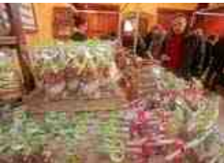
Le 2 ème salon Chocolat en Fête des Lions clubs a conduit des milliers de visiteurs aux salles Saint-Nicolas.

Cérémonies du Bataillon de France La ville rend hommage au sacrifice de 17 jeunes Compiégnois engagés dans le combat contre l'ennemi nazi.