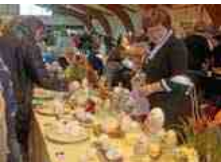
Le Salon des œufs décorés a accueilli près de deux mille visiteurs et collectionneurs.

Concours de stylisme amateur organisé par l'Association Miss Ronde.