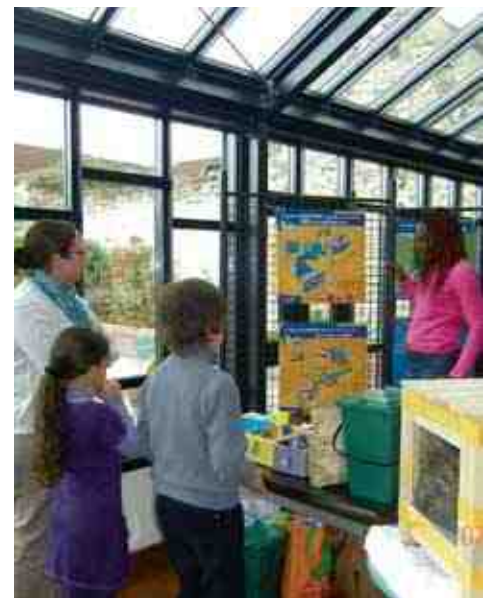
L'agglomération de la Région de Compiègne organise régulièrement des animations afin de sensibiliser le public à la revalorisation des déchets.

Proches des différents acteurs de la vie locale, elles sont également les mieux placées pour les mobiliser et favoriser l'évolution des comportements des citoyens.