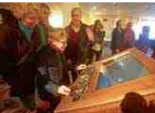
Le Festival Les Composites, extraordinaire mariage de la technologie et de l'art, a vécu sa seizième édition.

Bourse du Schako Le rendez-vous des collectionneurs d'armes anciennes.