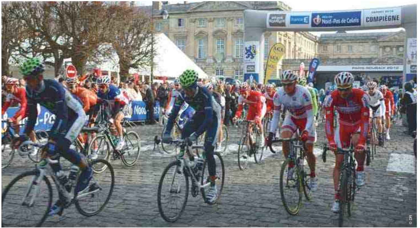
Le départ du 111 ème Paris-Roubaix aura lieu le 7 avril à 10h20, place du Général de Gaulle.