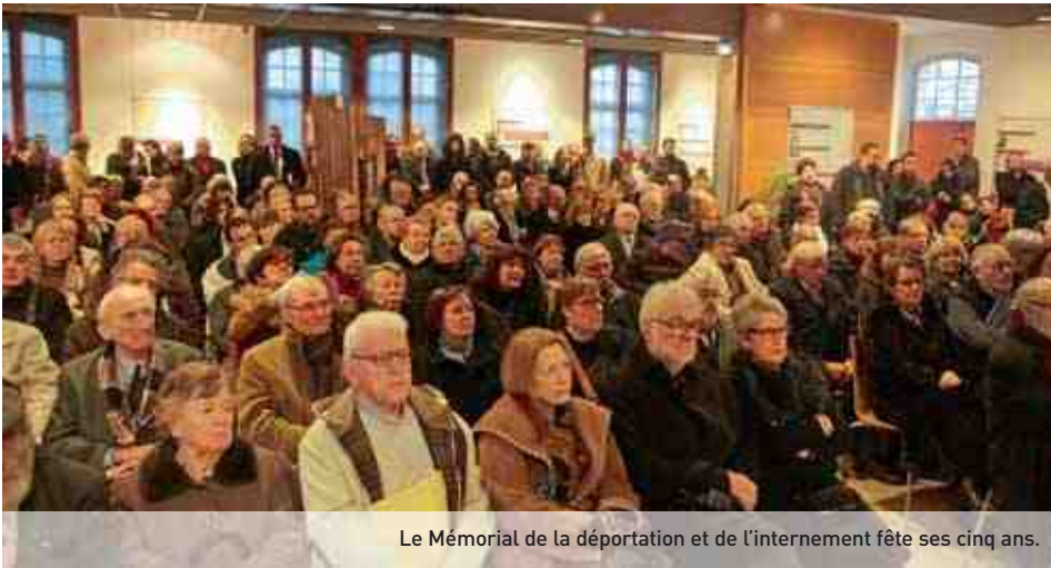
Le Mémorial de la déportation et de l'internement fête ses cinq ans.