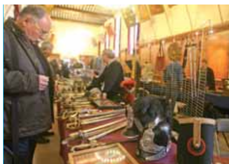
Le salon d'armes anciennes et d'antiquités militaires du Schako ▶ toujours très prisé des collectionneurs.