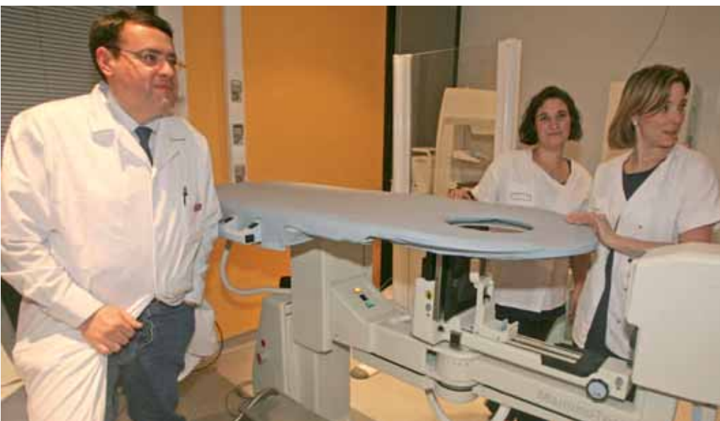
Le mamotome, nouvel équipement dont s'est dotée la clinique Saint-Côme, apporte un "plus" considérable dans la détection du cancer du sein.

L'appareil n'est certes pas imposant mais sa fonction permet de lutter avec plus d'efficacité encore contre le cancer du sein qui, chaque année, touche près de 50 000 femmes en France.