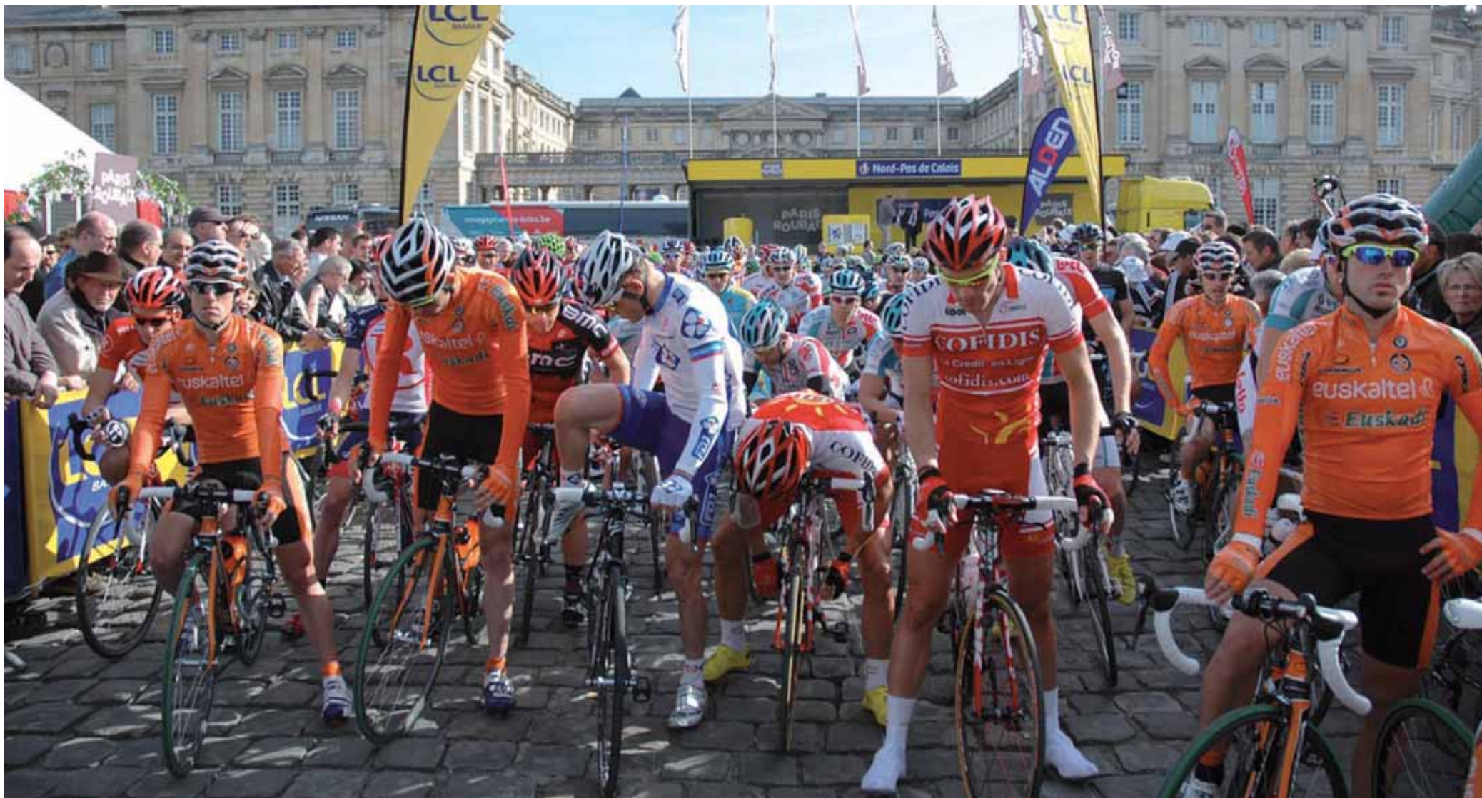
Le départ du 110 ème Paris-Roubaix aura lieu le dimanche 8 avril à 10h10, place du Palais.