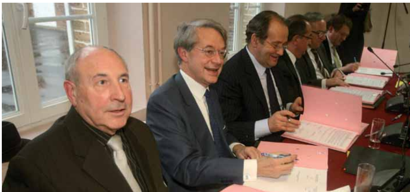
Le plan de financement de Paris Oise, port intérieur a donné lieu à la signature d'une convention cadre entre les différents partenaires du projet. Le montant de l'investissement s'élève à plus de 17 M€HT.