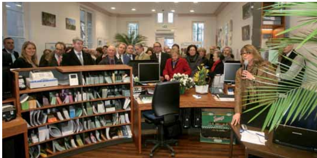
L'inauguration des nouveaux locaux de l'Office de tourisme de l'ARC a permis d'apprécier l'ambiance modernisée de cette institution.

Quatre semaines de travaux ont été consacrées à la rénovation et à la modernisation des locaux de l'Office de Tourisme. Les aménagements, réalisés sur une durée volontairement courte, permettent désormais d'accueillir tous les publics dans des conditions optimales.