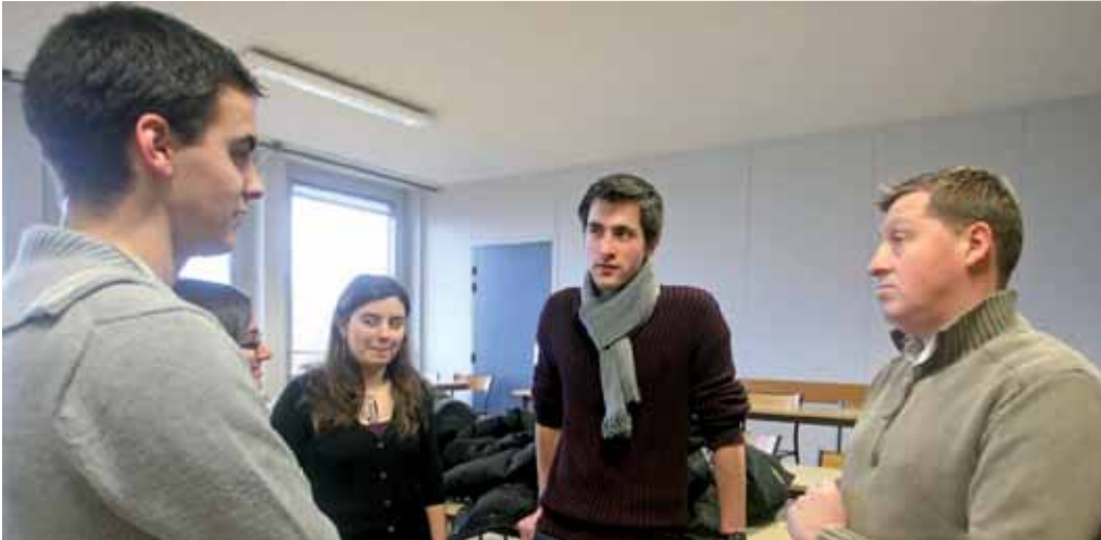
Le lycée Pierre d'Ailly offre aux étudiants la possibilité de commencer à Compiègne des études supérieures en classes préparatoires littéraires ou scientifiques.

Vous souhaitez intégrer une école d'ingénieurs ou passer des concours mais préférez passer par deux années de classes préparatoires, le lycée Pierre d'Ailly offre aux étudiants la possibilité de commencer à Compiègne des études supérieures en classes préparatoires littéraires ou scientifiques. Un véritable tremplin pour la poursuite d'un cursus réussi.