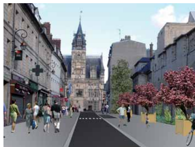
Vue de synthèse de la nouvelle rue Saint-Corneille.

Le prêteur habituel, Dexia Crédit local, a en fin d'année 2011 disparu de cet environnement et nous sommes en attente d'une nouvelle entité qui regrouperait l'Etat, la Caisse des Dépôts et Consignations et la banque Postale. De plus dans ce contexte de rareté de l'offre bancaire, les taux pratiqués sont élevés. Le taux fixe de 15 ans est actuellement coté entre 5 et 6% alors que l'an dernier à pareille époque les taux étaient inférieurs à 4%. Malgré ces difficultés notoires, la ville entend rester optimiste et poursuit sa volonté d'être un acteur économique de poids en donnant du travail aux entreprises, notamment à celles du bâtiment". ■