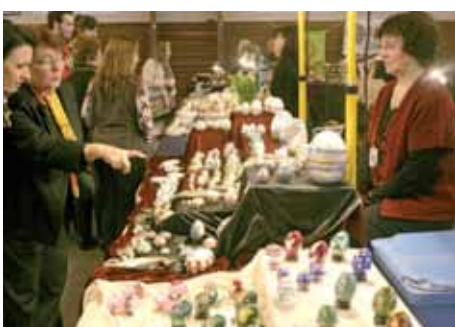
◀ 25 ème Salon International des Œufs Décorés Les visiteurs étaient au rendez-vous.