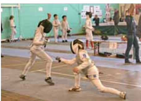
◀ 150 escrimeurs participent au challenge de la Ville de Compiègne.