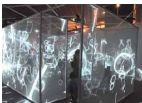
15 ème Festival Les Composites ▶ L'installation XYZT - Les Paysages abstraits, a émerveillé le public.