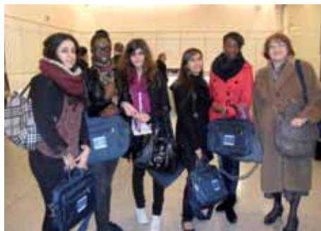
Opération "Génération réussite" ▶ Cinq lycéennes compiégnaises visitent le parlement européen.