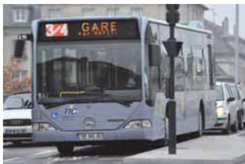
Un cadencement à 30 minutes est mis en place sur la ligne 3/4.

En octobre 2011, suite à la refonte de la ligne 5, l'itinéraire de la ligne 3/4 avait été étendu jusqu'au Centre Hospitalier de Compiègne (terminus Belin). Pour mieux répondre aux attentes exprimées par les usagers, l'ARC en charge des transports intercommunaux a décidé d'améliorer l'offre de service sur cette ligne.