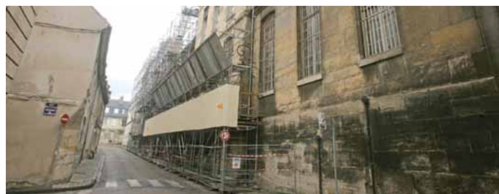
Les échafaudages recouvrent les murs du Palais de Compiègne pour d'importants travaux de rénovation de la toiture.