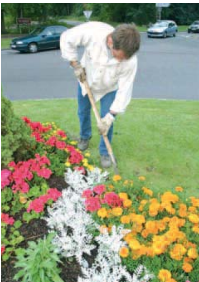
Les Services Techniques de la Ville entretiennent régulièrement les espaces publics.

Le nettoyage de la voirie, l'entretien des espaces verts sont des aspects essentiels de l'embellissement de la ville. Mais la propreté d'une ville, c'est aussi l'affaire de tous. Le respect des horaires de collecte des ordures ménagères, le ramassage des déjections de son animal de compagnie, le respect des équipements et biens d'autrui sont autant d'actes de civisme qui contribuent à embellir notre ville, à embellir notre vie... et celle de nos voisins.