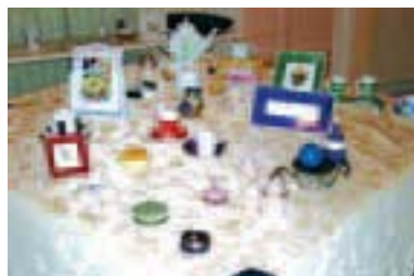
Art-déco-cadeaux, 17, rue du Grand Ferré.

porcelaine, bois, des encadrements classiques et modernes, des bijoux en or, argent et fantaisie, de l'artisanat mexicain ainsi que la possibilité de commander des cadeaux personnalisés, pour toutes sortes d'occasions. Le magasin sera ouvert du mardi au samedi de 10h à midi et de 13h à 19h.