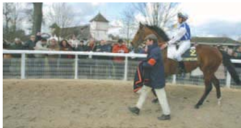
Jour de rentrée sur l'hippodrome du Putois. Un nouveau rendez-vous du quinté est au programme de la saison.

Une nouvelle saison s'est ouverte sur l'hippodrome du Putois. Sous l'impulsion de la Société des courses de Compiègne, un nombre croissant de rendez-vous est inscrit au calendrier.