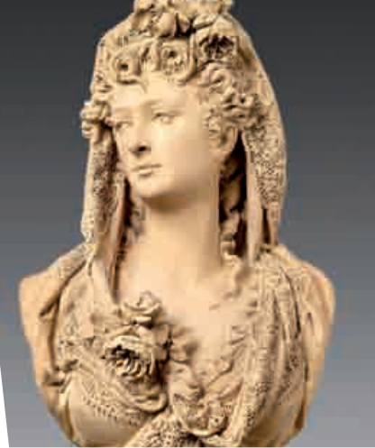
Buste de Marguerite Bellanger

De nombreuses animations gratuites, dont une grande loterie, seront une nouvelle fois au programme pour ce rendez-vous incontournable de l'été compiégnais.