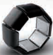
Bracelet connecté FeelTact