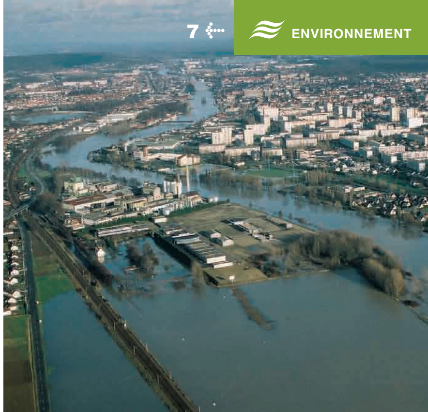
> Venette et Compiègne