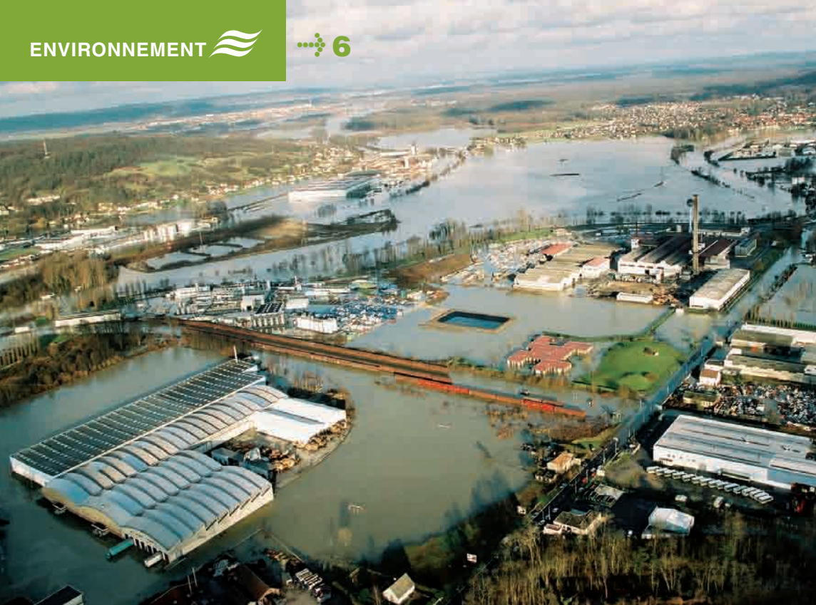
&gt; Compiègne ZI Nord