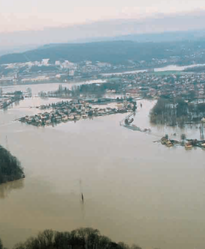
Bac) et l'Oise ont largement débordé de leur lit !