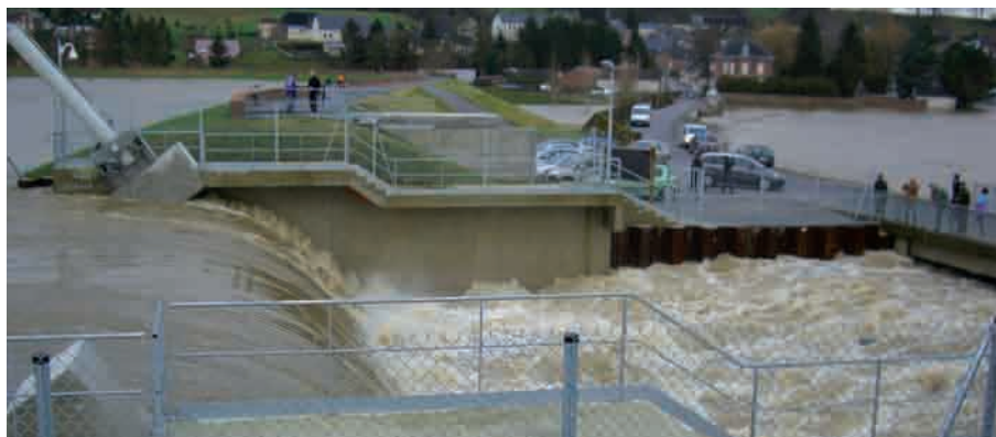
> L'aménagement de régulation de Proisy (Aisne)

L'ensemble de ces actions contribue à réduire la hauteur maximale atteinte par les inondations.