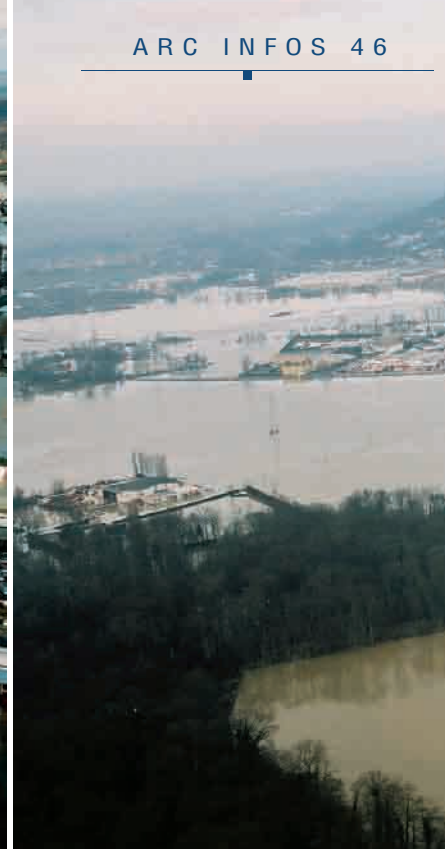
&gt; L'Aisne (comme ici à Choisy-au-)