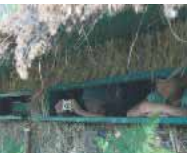
A la découverte de la faune sauvage