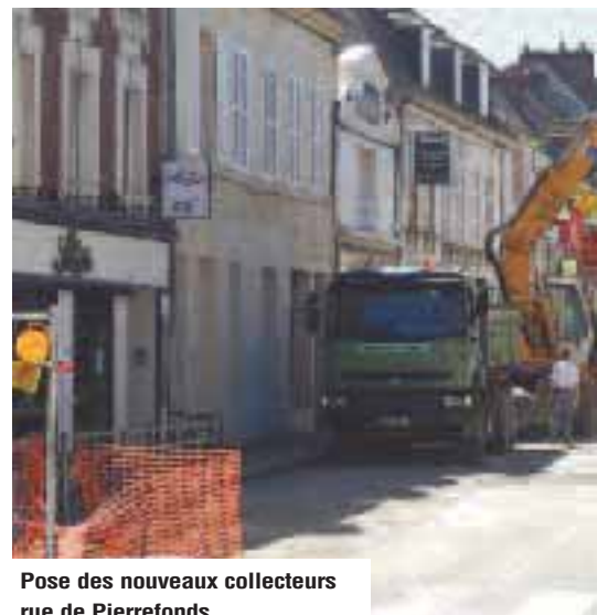
Pose des nouveaux collecteurs rue de Pierrefonds