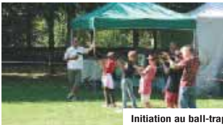
Initiation au ball-trap