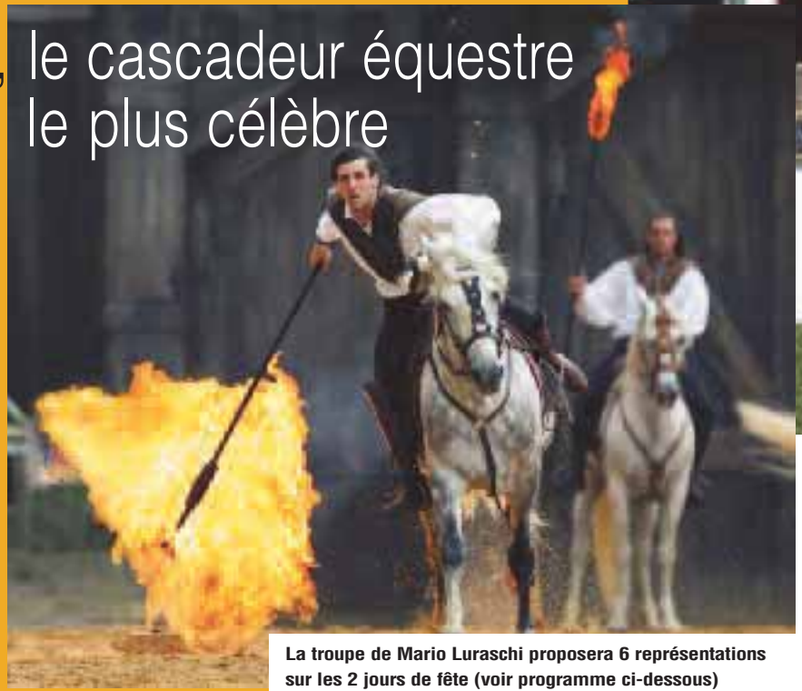
La troupe de Mario Luraschi proposera 6 représentations sur les 2 jours de fête (voir programme ci-dessous)

La troupe de Mario Luraschi proposera pendant deux jours des cascades à cheval, des voltiges... Mario Luraschi est célèbre pour avoir contribué à 400 tournages dont des publicités et des films de renom (Lucky Luke en 2009, Jeanne d'Arc en 1999, Astérix et Obélix contre César en 1998, l'Ours en 1988, la Folie des grandeurs en 1971...) et monté des spectacles magnifiques ("Excalibur" à Las Vegas, "Buffalo Bill Wild West show" à EuroDisney, "La légende du Far West" présentée à Bercy, "Ben Hur" au Puy du Fou...). Ce "magicien" des chevaux leur parle comme personne. Il réussit à leur faire accomplir des prouesses et son équipe épatera plus d'un visiteur par ses démonstrations lors de cette fête.