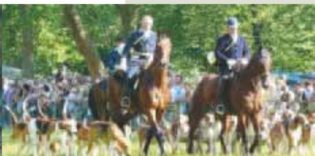
Présentation d'équipage de vénerie