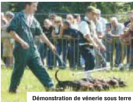
Démonstration de vénerie sous terre