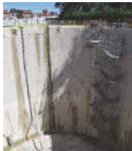
Le bassin d'orages rue de l'Oise (28,5 m de diamètre et 20 m de profondeur) sera entièrement enterré

Rue d'Austerlitz, les travaux de redimensionnement du réseau d'assainissement qui avaient été menés au printemps dernier ont été achevés début août pour la partie haute de la rue. La nécessité de bloquer partiellement le carrefour avec la rue de Bouvines avait conduit à différer l'achèvement de ce chantier. ■