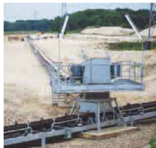
Le transport des matériaux extraits du site du futur bassin se fait par voie d'eau

extraits sera évacuée par voie fluviale et transportée par barges de 700 tonnes, à raison de deux convois par jour, vers les installations de traitement installées à Chevières et Longueil-Sainte-Marie. Cela évite ainsi 63 camions par jour, ce qui est plus écologique, et limite le trafic de poids lourds à l'entrée de Choisy-au-Bac. ■