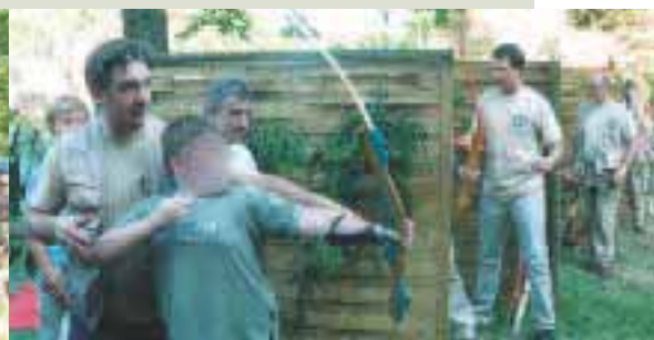
Initiation au tir à l'arc