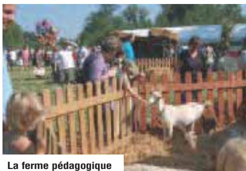
La ferme pédagogique

Un programme riche où tout le monde trouvera son intérêt, voilà ce qui est proposé les 11 et 12 septembre dans le parc du Palais impérial de Compiègne !