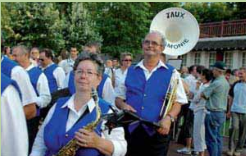
L'Harmonie de Jaux défile en fanfare