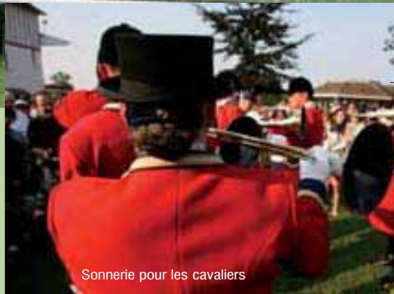
Sonnerie pour les cavaliers