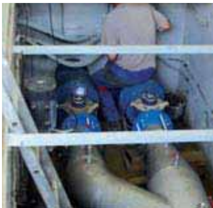
Installation de la nouvelle canalisation de production d'eau des Hospices

La construction d'un nouveau bâtiment a été nécessaire pour abriter l'unité de traitement. Les travaux, réalisés par une entreprise spécialisée, Sogea, ont été menés entre avril et août. Ils représentent un coût de 700 000 euros pour l'ARC. Ils n'auront pas de répercussion sur le prix de l'eau payé par les usagers. Le captage de Baugy sera équipé d'un traitement d'ici 2008.