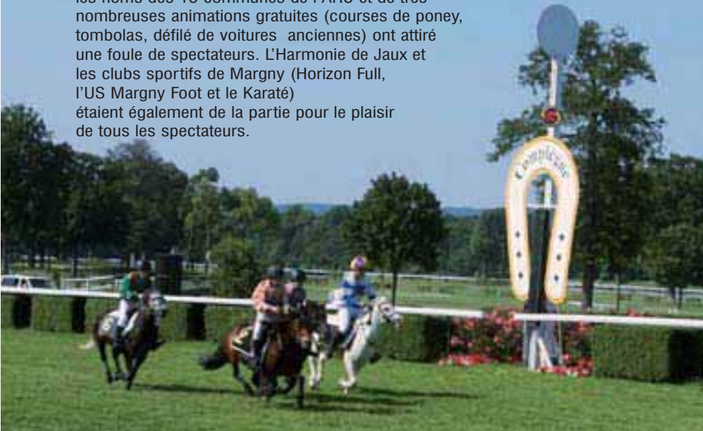
Deux courses de poneys étaient aussi au programme