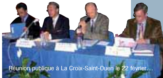
Réunion publique à La Croix-Saint-Ouen le 22 février...

cœur. Le verre de l'amitié conclura la rencontre et permettra des échanges informels. Une exposition présentant les grands domaines d'action de l'agglomération sera également présentée dans le hall du Centre de Transfert.