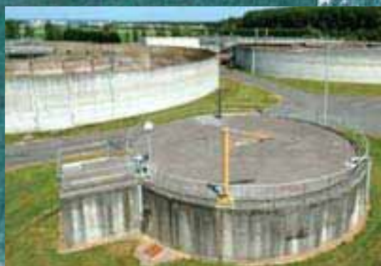
La station d'épuration de La Croix-Saint-Ouen

la lutte contre les inondations : l'intercommunalité installe des postes de crue et prépare le projet de bassin d'atténuation des crues de Choisy-au-Bac.