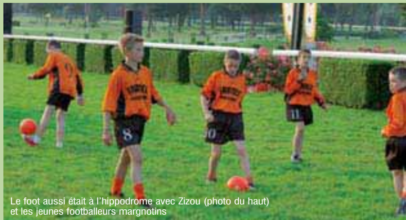
Le foot aussi était à l'hippodrome avec Zizou (photo du haut) et les jeunes footballeurs margnotins