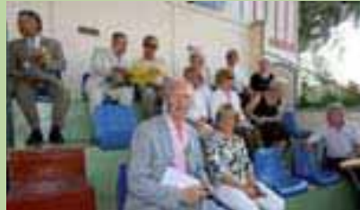
Dans les tribunes, les maires de l'ARC suivent la course