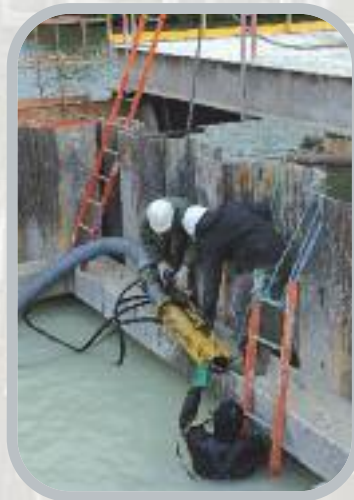
Béton immergé, mise en place de la suceuse

En images, quelques temps forts de ces dernières semaines.