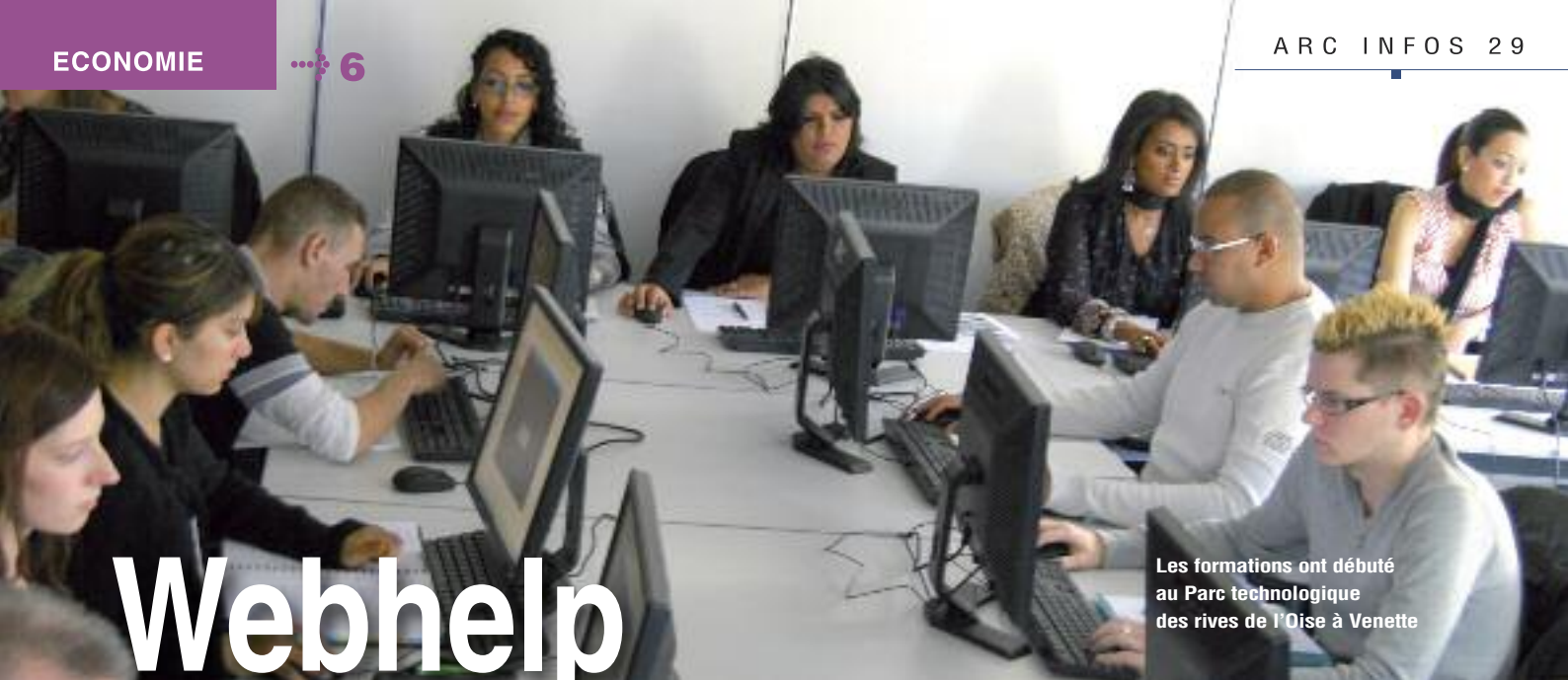
Les formations ont débuté au Parc technologique des rives de l'Oise à Venette