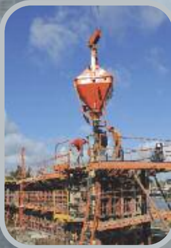
Bétonnage des 1 ères élévations de la culée creuse