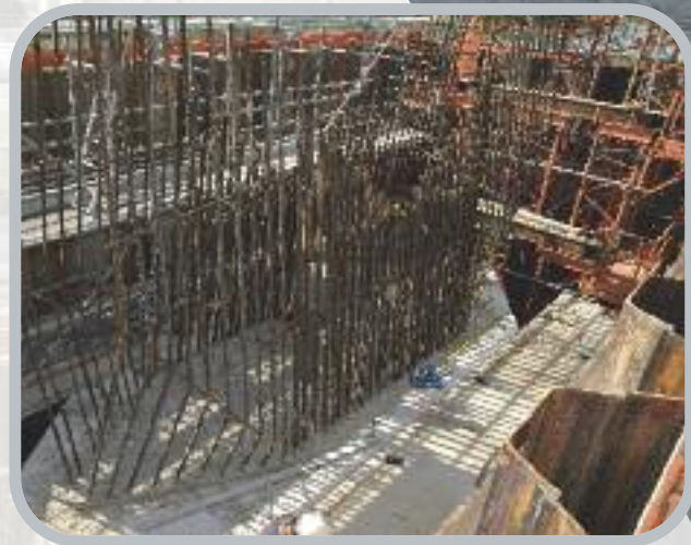
Préparatifs au ferrillage du fût de la pile 2