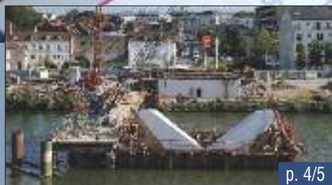
Le nouveau pont urbain sort de l'eau