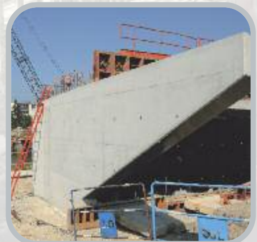
Mur en retour et ferrillage de la pile en rivière