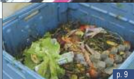
Le compostage pour la réduction des déchets