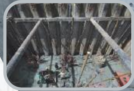
Les pieux du batardeau de la pile en rivière

Bien visible en cœur d'agglomération, le chantier du pont urbain se poursuit et se terminera l'été prochain.