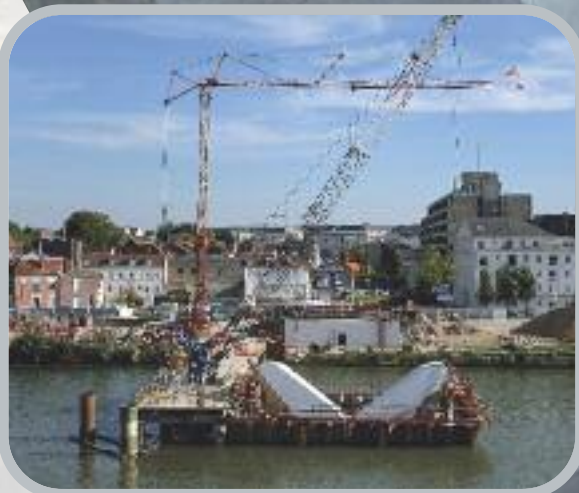
Décoffrage de la pile en rivière