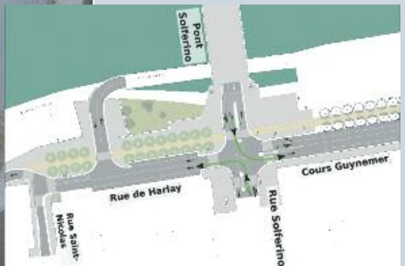
Les aménagements prévus à hauteur du pont Solferino