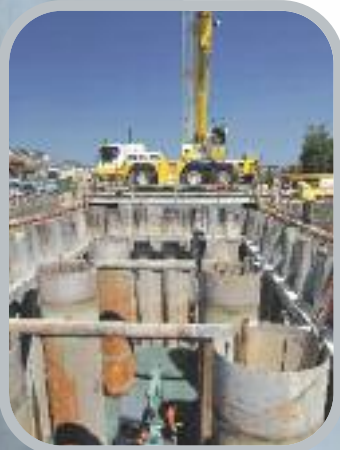
Nettoyage du batardeau après assèchement

Le nouveau plan de circulation étend le secteur piéton et le rend attractif. Il maintient cependant la possibilité de traverser le centre de la ville en voiture afin de conserver son accessibilité.