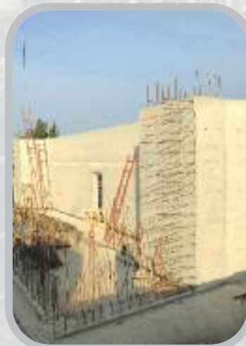
Coffrage des 1 ères élévations de la culée creuse côté Compiègne