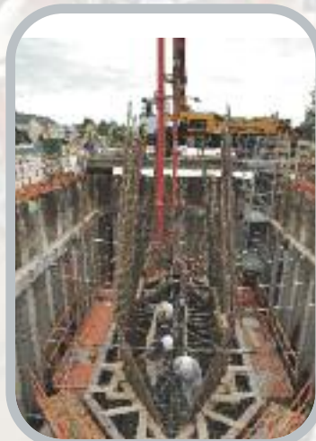
Finition des préparatifs au bétonnage du raidisseur de la pile en rivière