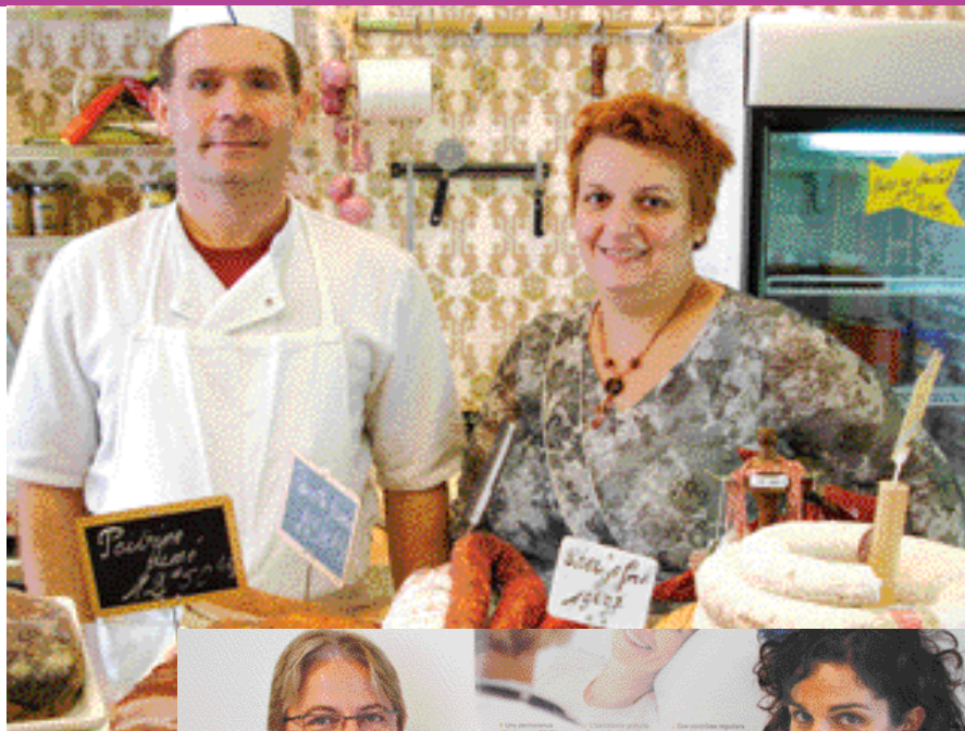
Ils reprennent l'activité du traiteur du village fermé depuis fin septembre 2005.

Partenaire de l'Agglomération de la Région de Compiègne, la Plate-Forme d'Initiative Locale Oise-Est Initiative accompagne les futurs créateurs et repreneurs d'entreprises.