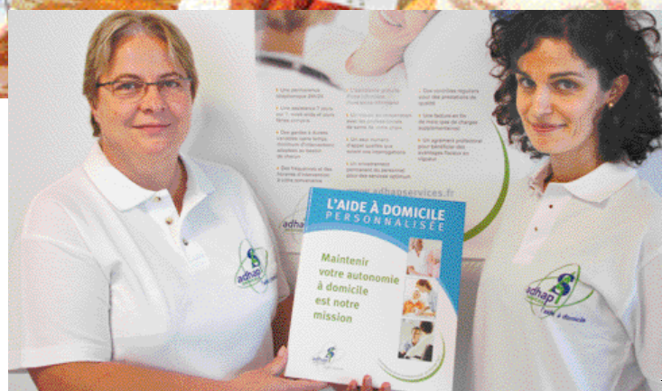
“Vous aider à conserver votre autonomie à domicile est notre mission”.

Partenaire de l'Agglomération de la Région de Compiègne, la Plate-Forme d'Initiative Locale Oise-Est Initiative accompagne les futurs créateurs et repreneurs d'entreprises.