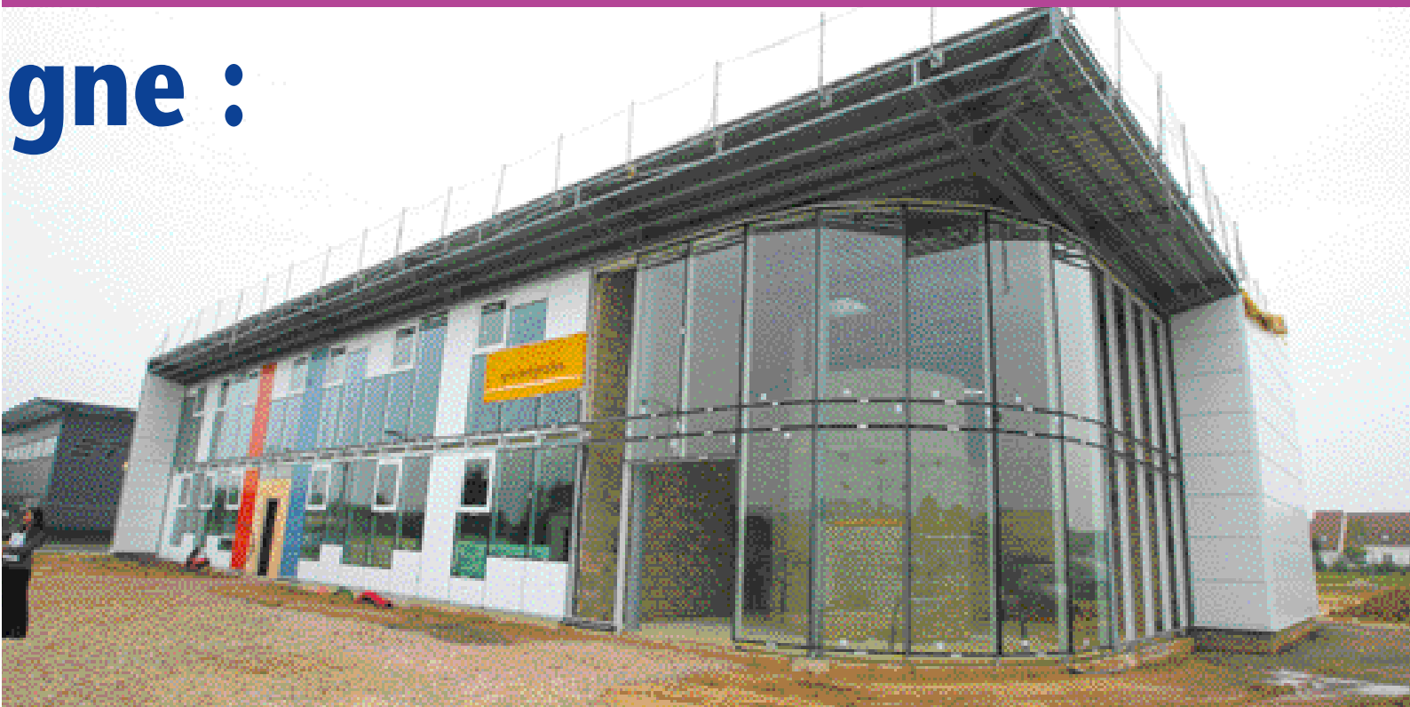
Les locaux de Bail Immo Nord en cours de construction au Parc scientifique et tertiaire de La Croix-Saint-Ouen.

prises créatrices d'emplois qui s'installent et se développent dans l'agglomération.