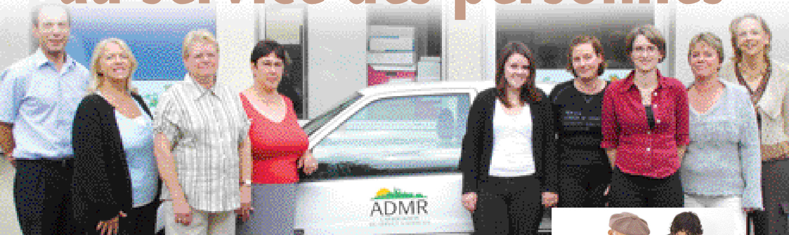
Le personnel de la Fédération départementale.

ADMR : vous avez sûrement aperçu ce sigle à l'entrée de villes et villages, dans toute la France. L'ADMR, l'association du service à domicile, a aujourd'hui 60 ans, et compte 110 000 bénévoles et presque 73 000 salariés sur toute la France.