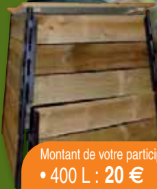
Composteur en bois