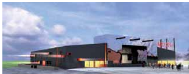
> Vue du futur pôle événementiel, depuis le tarmac angle sud-est