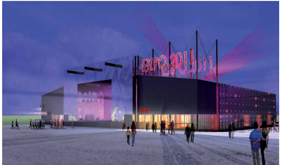
> Le futur pôle événementiel des Hauts de Margny