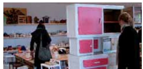
> «La bonne pioche» la boutique de la Recyclerie de l'Agglomération du Compiénois (RAC) est une des activités du site

Ces ensembles boisés faciliteront le déplacement de la faune sur le plateau et offriront une belle entrée d'agglomération. Pour la zone d'activité du Muid Marcel, des placettes belvédères, offrant des points de vue sur l'agglomération le long de la RN 1031, seront aménagées.