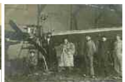
> Aviateurs à Corbeaulieu en 1911