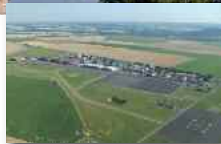
> Les Hauts de Margny

Le budget global de l'ARC, en 2011, représente un peu plus de 155 millions d'€ et se compose en réalité de 12 budgets. 10 "budgets annexes" ont été votés au mois de décembre, les budgets "principal" et "aménagement" le 15 avril. Dans un contexte de reprise économique, l'agglomération a choisi de mener une politique d'investissement dynamique.