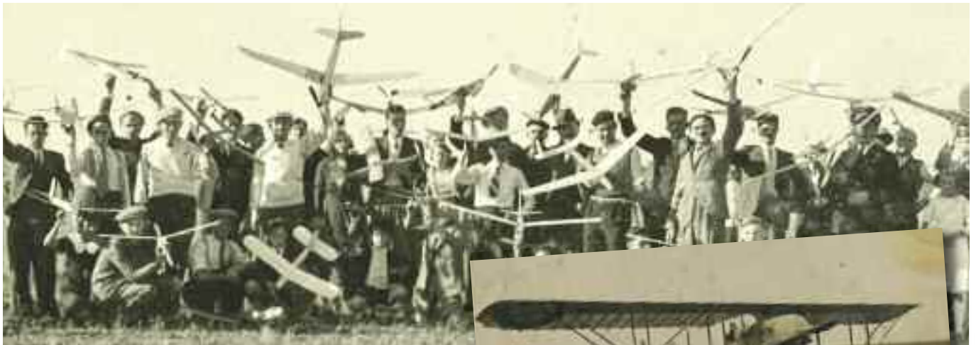
> Concours interrégional de modèles réduits sur le terrain de Margny-lès-Compiègne