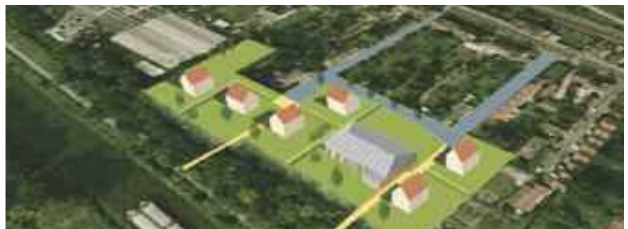
> Le projet d'aménagement du quai de l'Ecluse à Venette

• 7,7 millions d'€ permettront de mener différentes études sur l'habitat ainsi que la poursuite de l'aménagement du quartier des Jardins à La Croix Saint Ouen, du Clos Féron à Le Meux, le démarrage de l'aménagement du centre-bourg de Saint-Sauveur, de celui de Jaux et du quartier du quai de l'Ecluse à Venette.