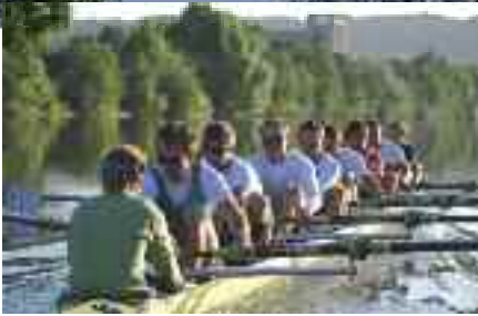
> Une étude sur le déplacement du Sport Nautique Compiégnois est prévue