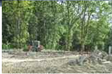
> Travaux d'aménagement d'un lotissement