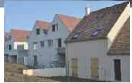
> Le Clos Féron, un nouveau quartier aménagé par l'ARC à Le Meux

et école de la Prairie à Venette, école de Vieux-Moulin, crématorium de Saint-Sauveur, étude pour le déplacement du Sport Nautique Compiégnois, halle de sports de La Croix Saint Ouen...).