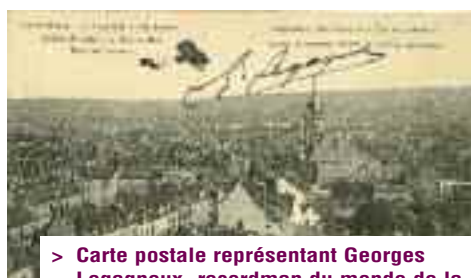
> Carte postale représentant Georges Legagneux, recordman du monde de la hauteur, doublant l'Hôtel de ville, le 14 avril 1911

> Exposition sur le centenaire du vol à la mairie de Margny-lès-Compiègne jusqu'au 11 juillet et du 5 au 31 octobre à la mairie de Compiègne