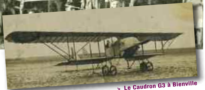
> Le Caudron G3 à Bienville

De 1911 à nos jours, les grands moments de notre histoire aéronautique