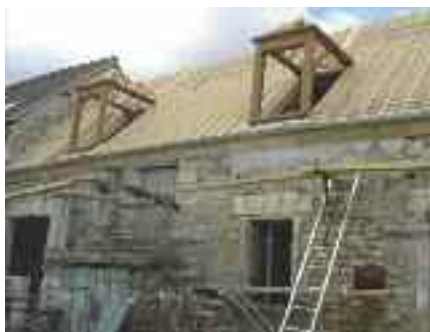
> OPAH, une aide à l'amélioration du patrimoine privé

1 La réalisation d'infrastructures : 10, 7 millions d'€. Ce sont le "Pont neuf", qui sera inauguré le 10 septembre, (6 millions d'€) et la rocade nord-est (3,9 millions d'€) mais aussi les pistes cyclables (prolongement de la piste