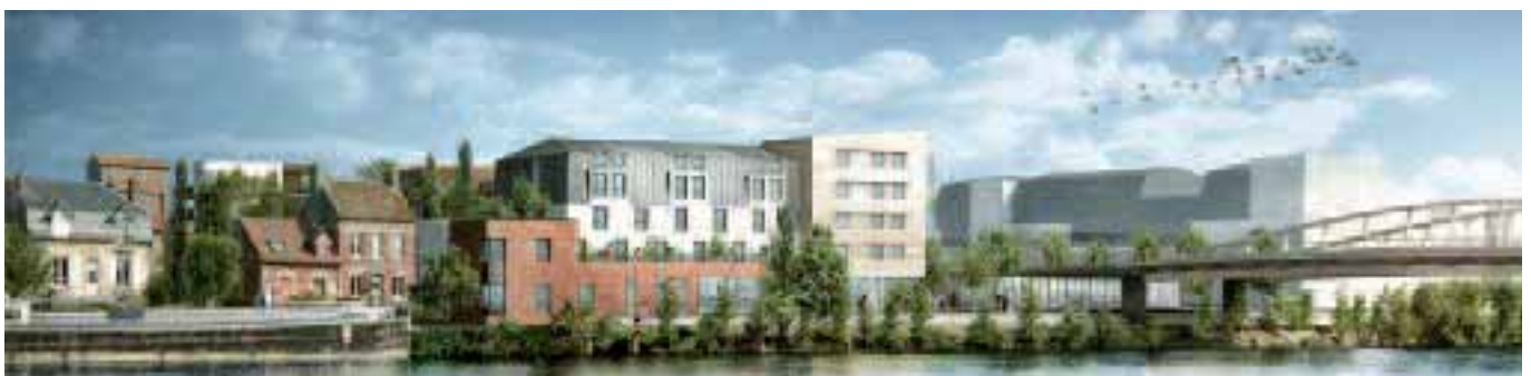
Vue depuis Compiègne sur l'hôtel 4*

Les plans et images de synthèse présentés illustrent les projets d'aménagement de la ZAC des Deux rives et sont susceptibles d'évoluer.