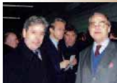
Inauguration du bouldrome intercommunal en janvier 2000