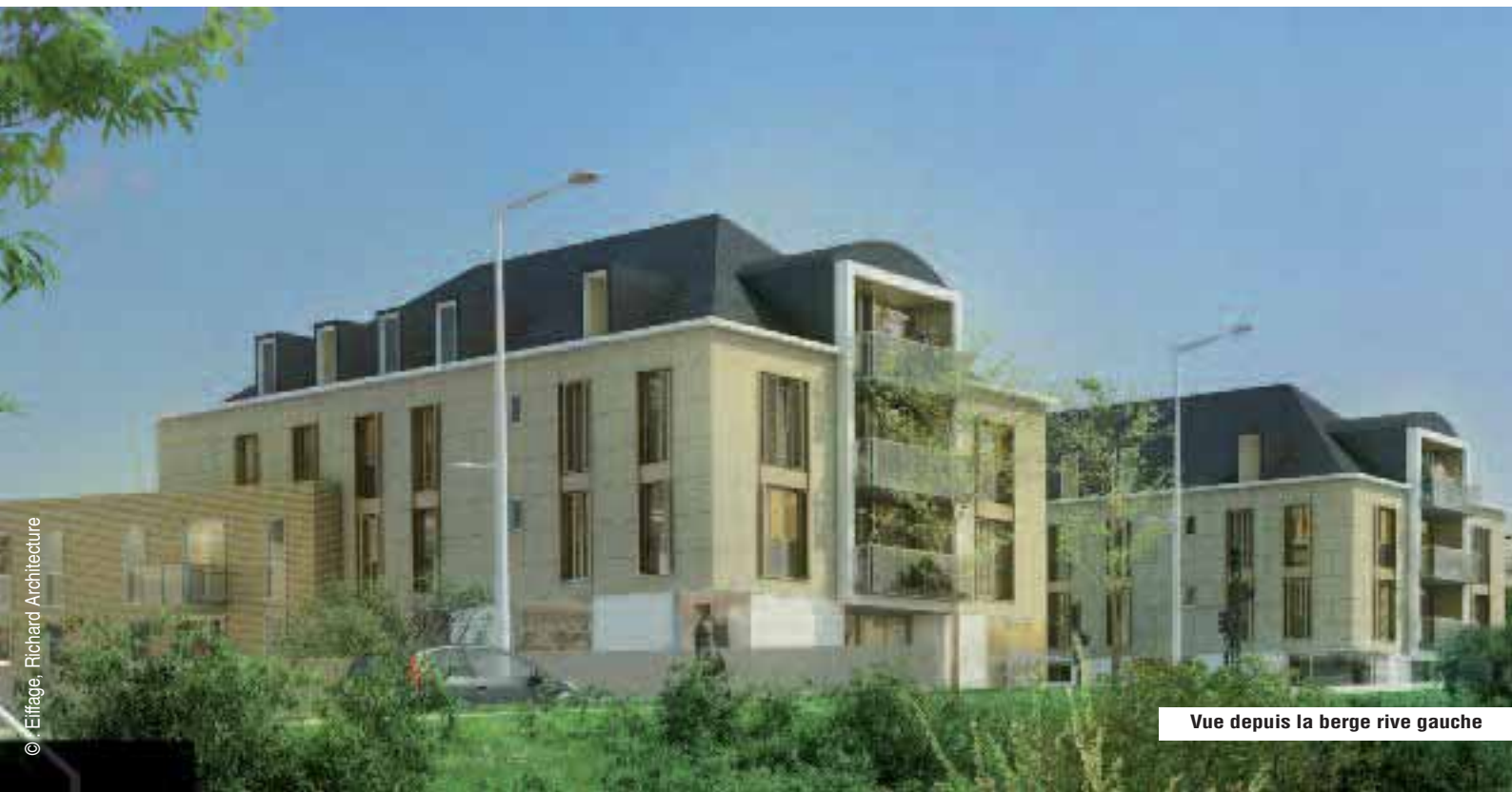
Vue depuis la berge rive gauche