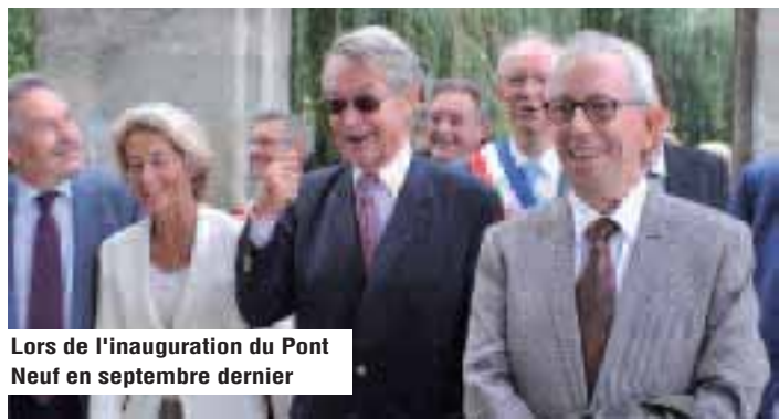
Lors de l'inauguration du Pont Neuf en septembre dernier