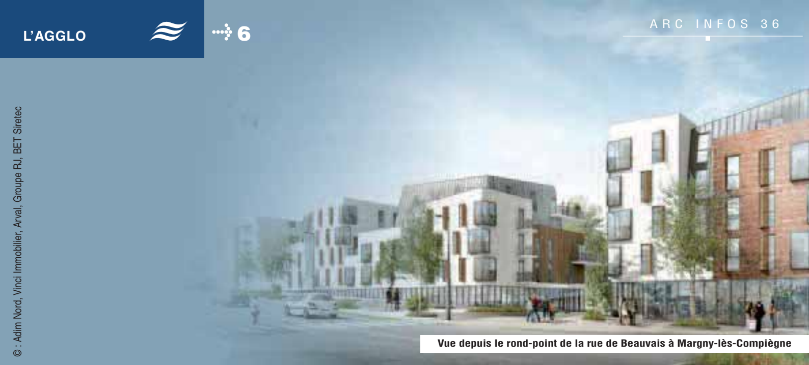
Vue depuis le rond-point de la rue de Beauvais à Margny-lès-Compiègne