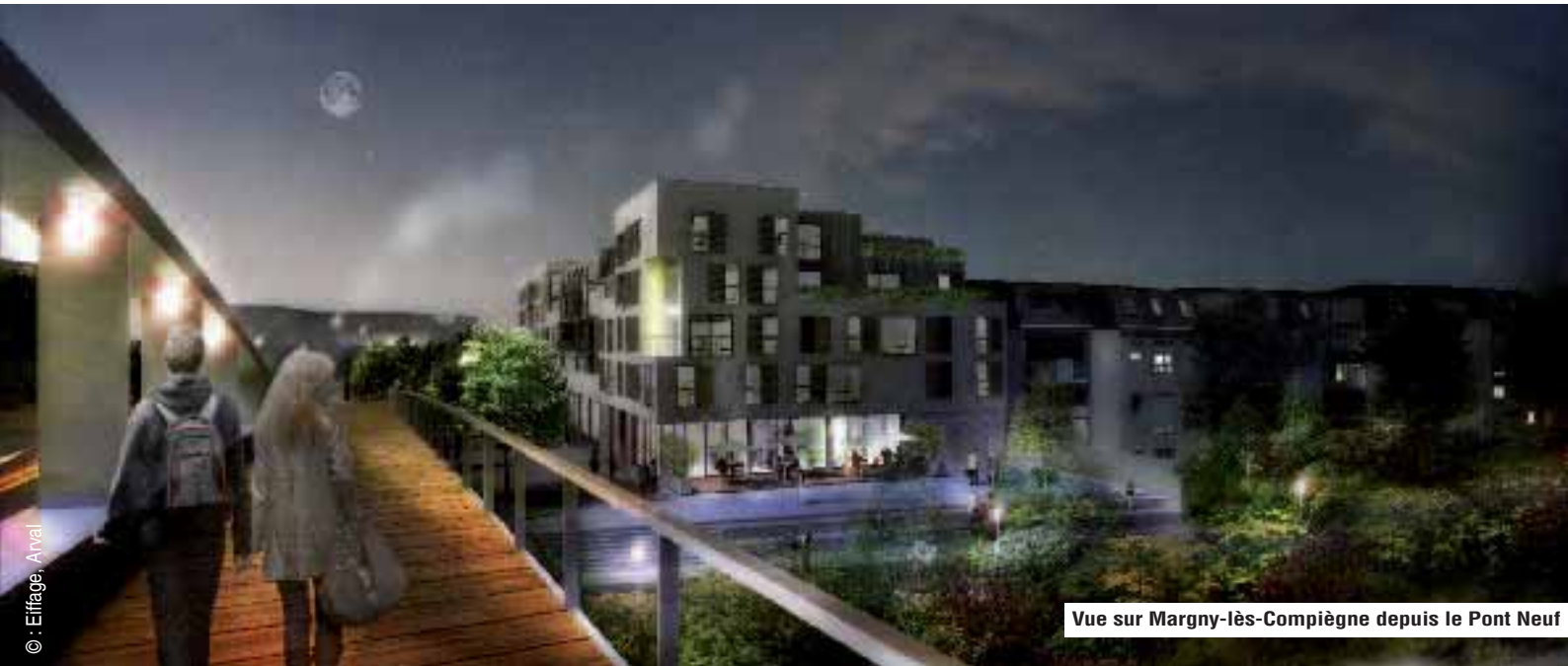
Vue sur Margny-lès-Compiègne depuis le Pont Neuf