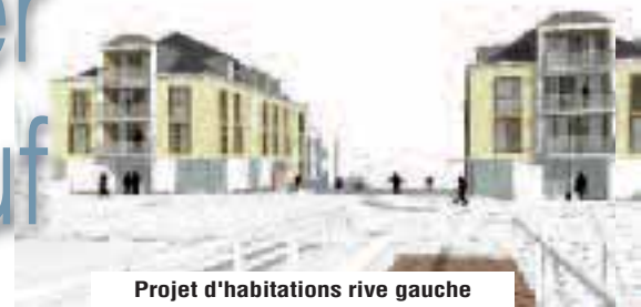
Projet d'habitations rive gauche

De part et d'autre du superbe Pont Neuf, les constructions vont voir le jour pour dynamiser le cœur de l'agglomération. Ce secteur porte le nom de ZAC (Zone d'Aménagement Concerté) des Deux rives.