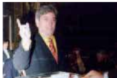
Election lors de la création de la Communauté de Communes en janvier 2000