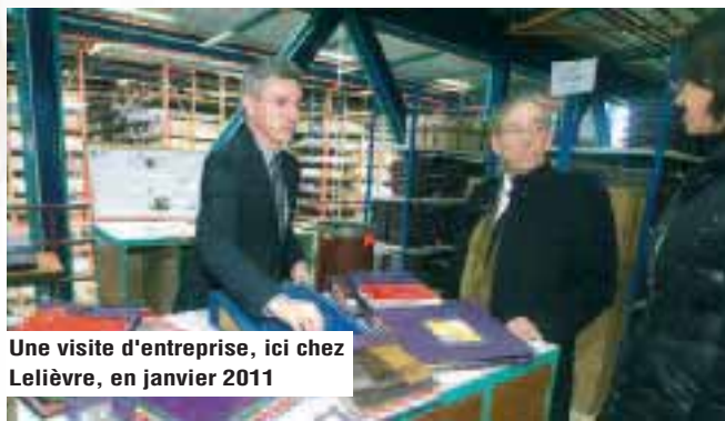
Une visite d'entreprise, ici chez Lelièvre, en janvier 2011