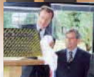
Inauguration de la station d'épuration d'Unilever en octobre 2001