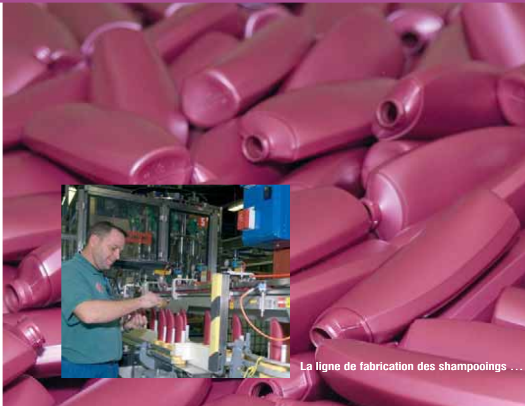
La ligne de fabrication des shampoings ...