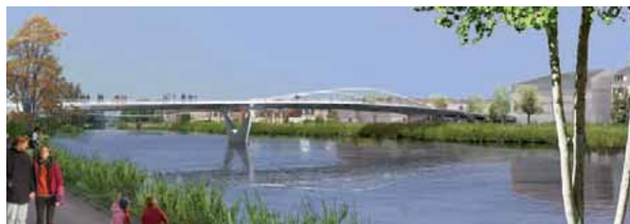
Le nouveau pont urbain sera achevé en août 2011

Sur la rive droite à Margny : des immeubles de logements avec des commerces, des restaurants et des services en rez-de-chaussée seront construits ainsi que des immeubles de bureaux (voir page de droite). Un hôtel 3 étoiles et une résidence pour étudiants avec la maison des étudiants de l'UTC font également partie du projet.