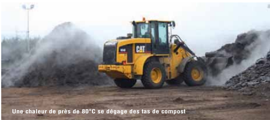
Une chaleur de près de 80°C se dégage des tas de compost

• Mercredi matin (sortie la veille à partir de 20h) pour Venette, Margny-lès-Compiègne, Compiègne (Petit Margny), Bienville, Janville et Clairoux