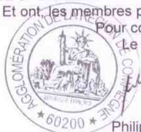
Philippe Marini Philippe MARINI Sénateur-Maire de Compiègne

ADOPTÉ à l'unanimité PAR LE CONSEIL D'AGGLOMERATION, Et ont, les membres présents, signé après lecture, Pour copie conforme, Le Président,