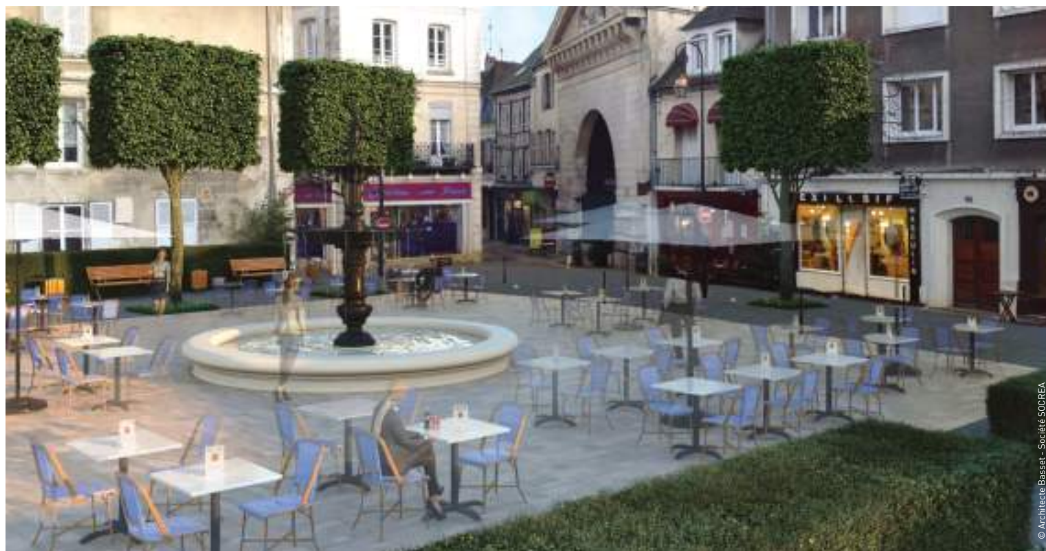
Ébauche du projet de réaménagement de la Place du Change. (Vue de synthèse).

Lors de la réparation et des essais qui ont eu lieu le 30 août dernier, les Compiégnois ont pu entendre les trois Picantins, ennemis de la France condamnés à « piquer le temps », sonner exceptionnellement en dehors des quarts d'heure. ■