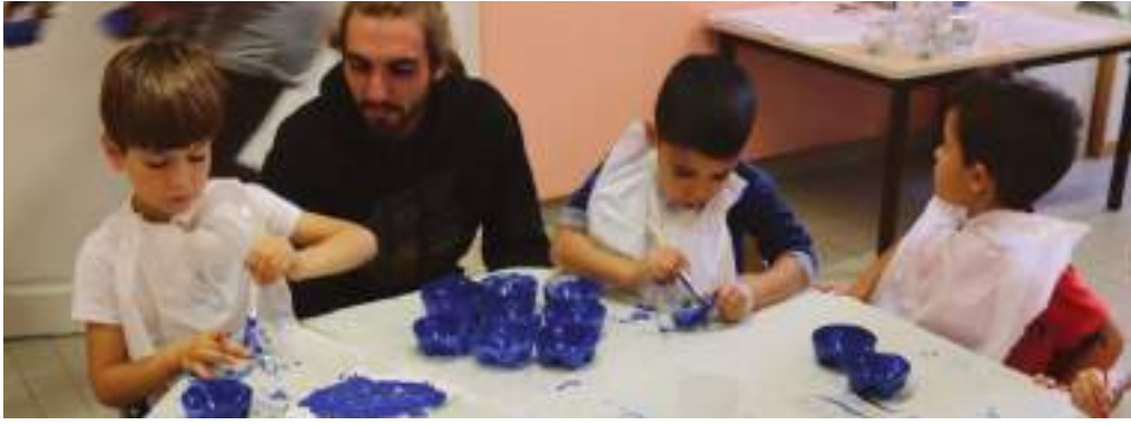
Les enfants des centres de loisirs, en pleine action.

Les jeunes générations s'engagent... Dans le cadre du centenaire de l'armistice de 1918, les enfants des écoles et des centres de loisirs, leurs enseignants et leurs encadrants, se sont mobilisés tout au long de l'année pour la création d'un jardin de la Mémoire, place de l'Hôtel de Ville. Celui-ci sera inauguré le vendredi 5 octobre à 14h30 en présence de tous les participants.