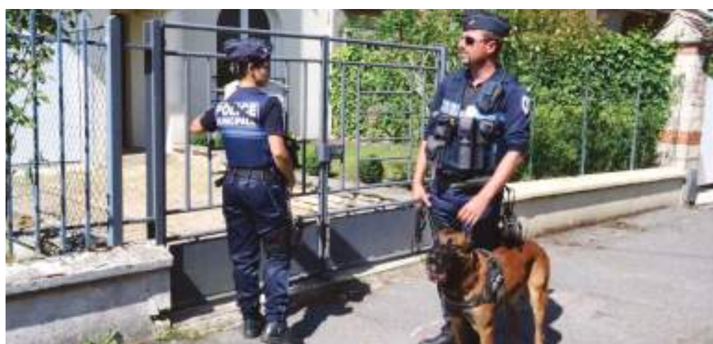
L'Opération Tranquillité Vacances, un service particulièrement apprécié des Compiégnois.

En revanche, s'il s'agit d'un dépôt de plainte, il vous faudra obligatoirement vous rendre au Commissariat de Police, 41 rue Saint-Germain. ■