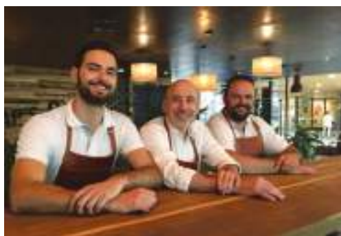
Ep's café, bar à vins, bières et brasserie, 6 place du Marché aux Herbes.