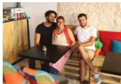
Liberthé d'Expresso, café, 10 rue des Lombards.