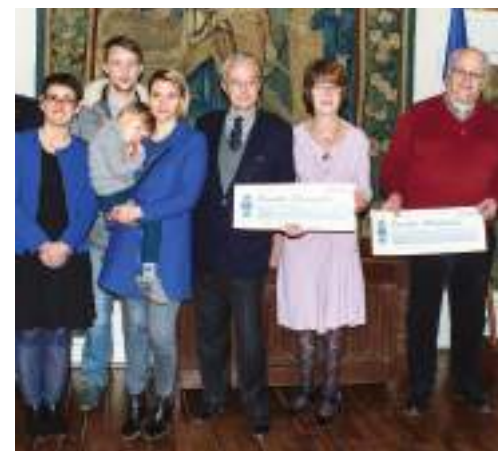
Les fonds recueillis par les Lions clubs de Compiègne sont reversés au profit d'actions caritatives.

« Ainsi, sur l'agglomération compiégnaise, les fonds recueillis ont notamment servi à la création et l'aménagement d'une salle spécifique pour accueillir des malades atteints de la maladie d'Alzheimer, la création d'une salle Snoezelen dans un centre IMPRO, au don de chiens guides pour des personnes non-voyantes, au don de matériel éducatif pour des enfants cancéreux hospitalisés, à l'achat d'un véhicule réfrigéré pour le portage de repas à domicile, au financement de séjours de vacances en bord de mer pour des enfants. Collectes alimentaires et bien d'autres actions en faveur de l'environnement ou de la jeunesse comme des concours d'éloquence, de musique, d'affiche de la paix ont également été organisés ».