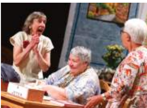
Lors des dernières représentations, les élèves comédiens ont de nouveau fait preuve de dynamisme et de jeunesse d'esprit dans leur jeu, pour le plus grand bonheur des spectateurs.