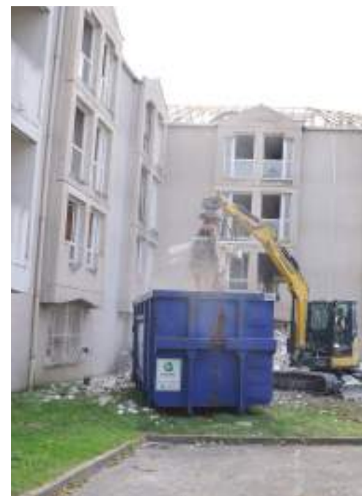
Démolition des résidences du CROUS.

À l'avenir, selon le projet de renouvellement urbain qui sera défini, pourront prendre place dans ce secteur du Clos des Roses, des maisons, des petits immeubles, des activités de service et des espaces verts. ■