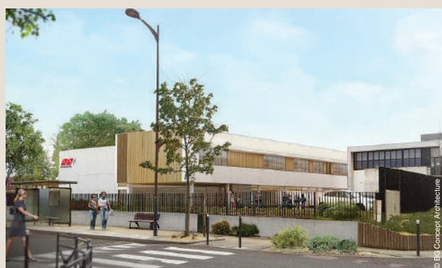
Extension de l'ESCOM Chimie.

Cette extension complète les services proposés sur le campus universitaire de Royallieu et offrira une vitrine attractive de l'offre de formation post-bac présente sur le territoire. ■