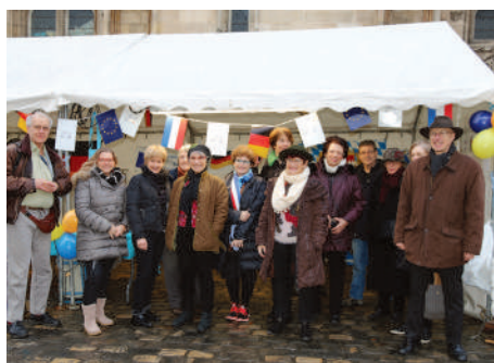
◀ Saucisses blanches et bretzels venus de Landshut étaient au rendez-vous de la traditionnelle Fête de l'amitié franco-allemande.

Le 26 e salon du collectionneur ▶ rassemble un public de passionnés.