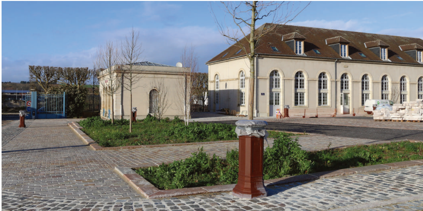
Une maison médicale s'installe place de Choiseul.

Une maison médicale vient d'ouvrir ses portes place de Choiseul.