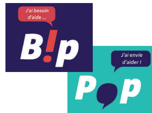
Lancement officiel du partenariat du CCAS de la Ville de Compiègne avec Bip Pop.

La plateforme Bip Pop est accessible à tous sur internet : www.bippop.com et