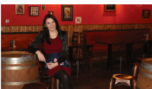
Le Beer Geek, Bar à bières, 9 Rue de Pierrefonds.