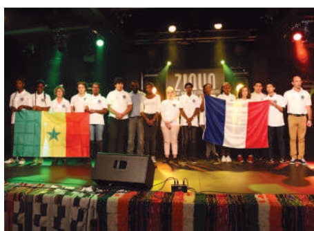
◀ Chantier solidaire à Koudiadiène au Sénégal Les jeunes Compiégnois ont raconté leur aventure autour de l'entraide et du partage.

Les chœurs d'enfants ▶ du Conservatoire de musique et des classes CHAM de Compiègne participent au concert du Nouvel An.