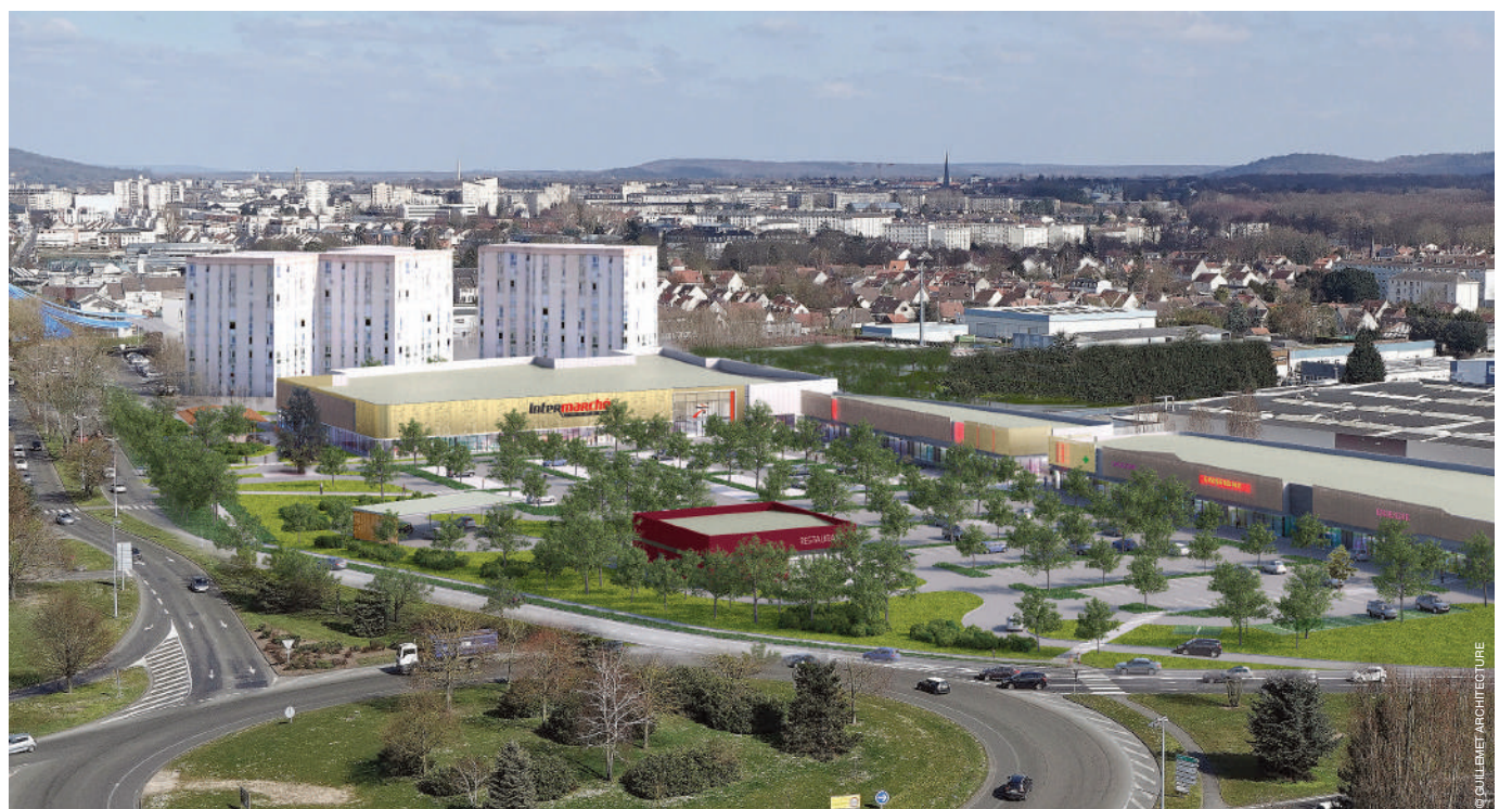
L'entrée sud de Compiègne bénéficiera d'un complet renouveau.

« Le nouveau centre commercial, dénommé « Grands Chemins » pour exprimer sa proximité avec la forêt de Compiègne, sera à taille humaine et apportera une