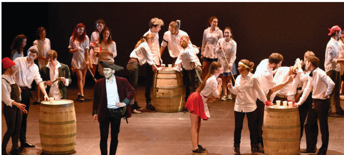
120 étudiants de l'UTC se produisent sur la scène du Théâtre Impérial. « Marée haute, messes basses », une comédie musicale entièrement écrite et mise en scène par leurs soins.