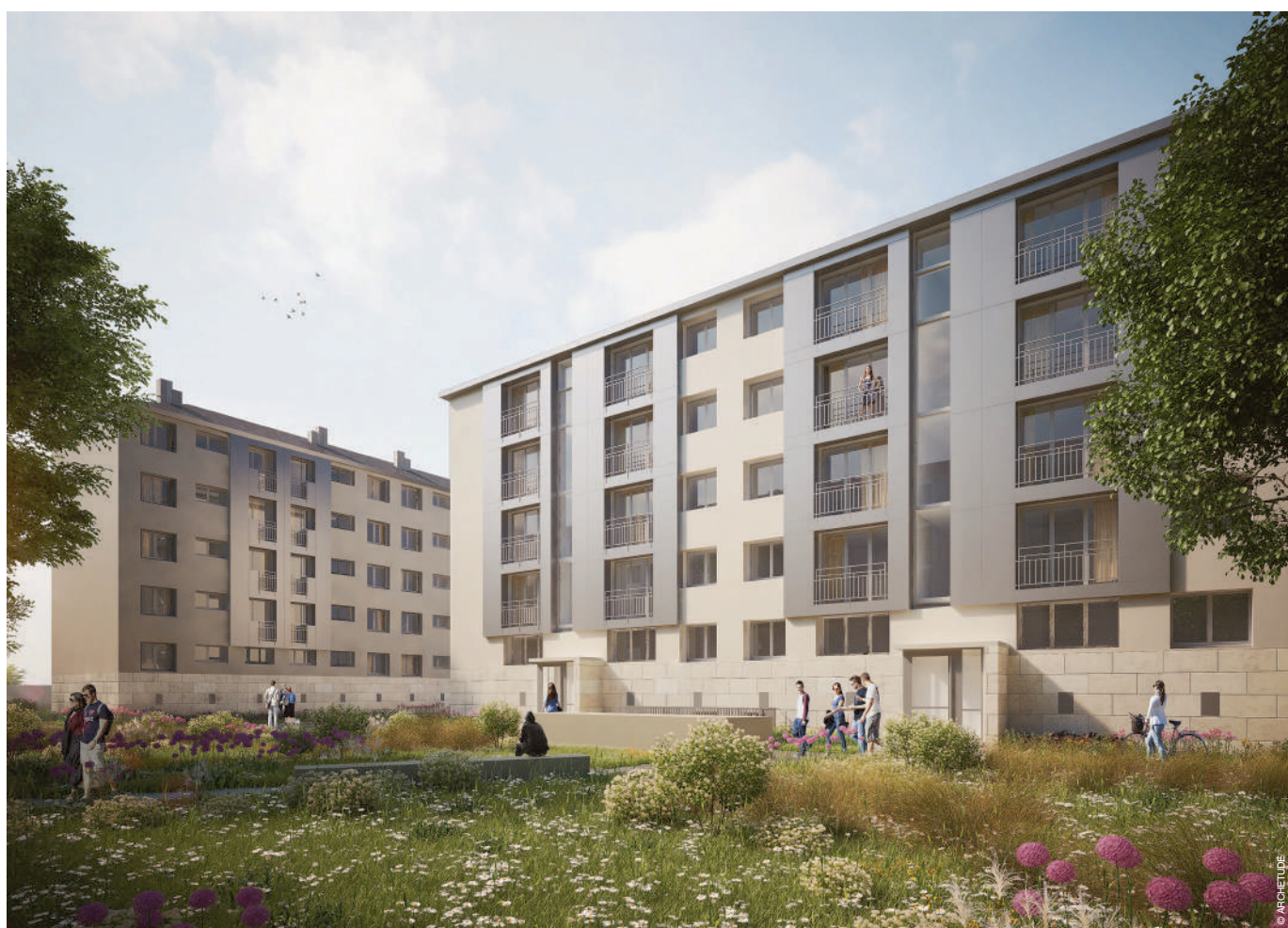
Le square du Vivier Corax sera entièrement rénové.

Le square du Vivier Corax présente de nombreuses problématiques sociales et urbaines. « C'est pourquoi la Ville de Compiègne a insisté pour que ce quartier soit l'un des quartiers prioritaires du Contrat de Ville, à défaut d'être inclus dans le nouveau Plan de Rénovation Urbaine dont vont bénéficier le Clos des Roses