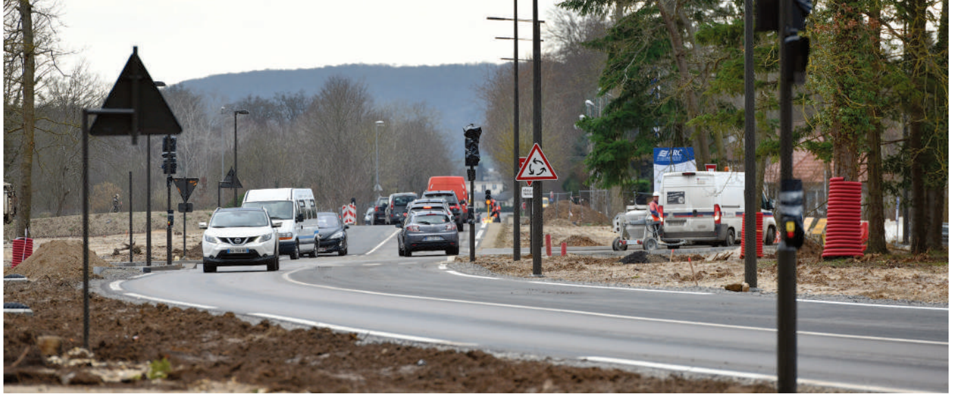
L'avenue de la Faisanderie relie désormais l'avenue de Royallieu au carrefour des Nations-Unies.

La livraison est prévue pour l'été 2018. ■