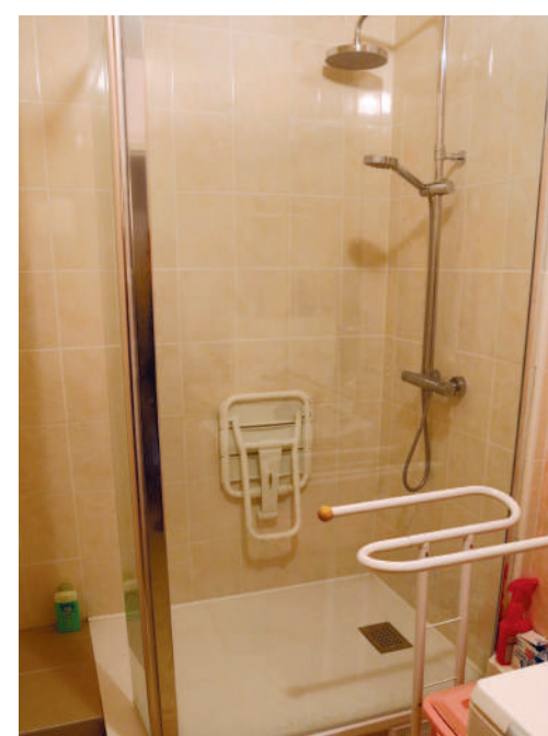
Adaptation de la douche au handicap.

Vous accompagner dans l'amélioration de votre logement