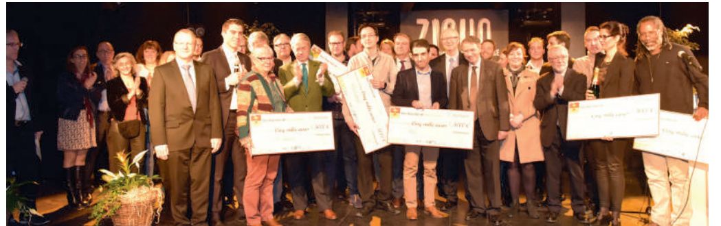
Les lauréats de la Fête de l'Économie 2016.

Le 30 mars à partir de 19h aura lieu au Ziguodrome, la 2 ème édition de la fête de l'Économie, à l'initiative du conseiller municipal Marc-Antoine Brekiesz.