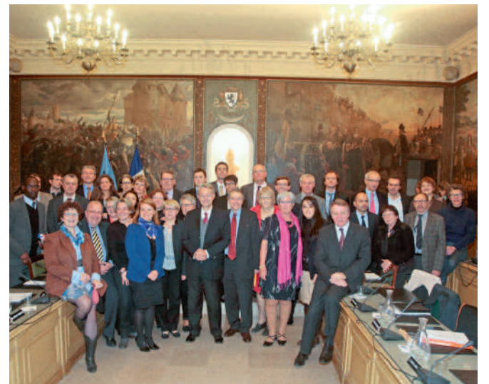
Les nouveaux conseillers municipaux prennent leurs fonctions, au lendemain des élections.