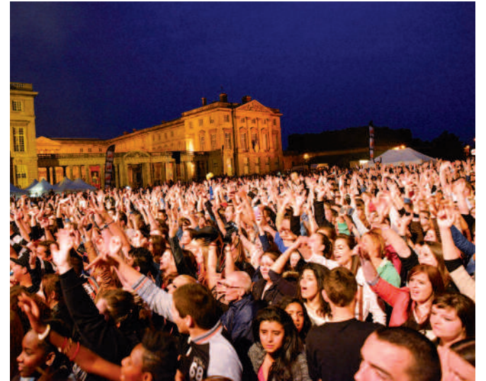
Plus de 20 000 personnes assistent au concert du NRJ Music Tour, au soir du 30 avril place du Palais.