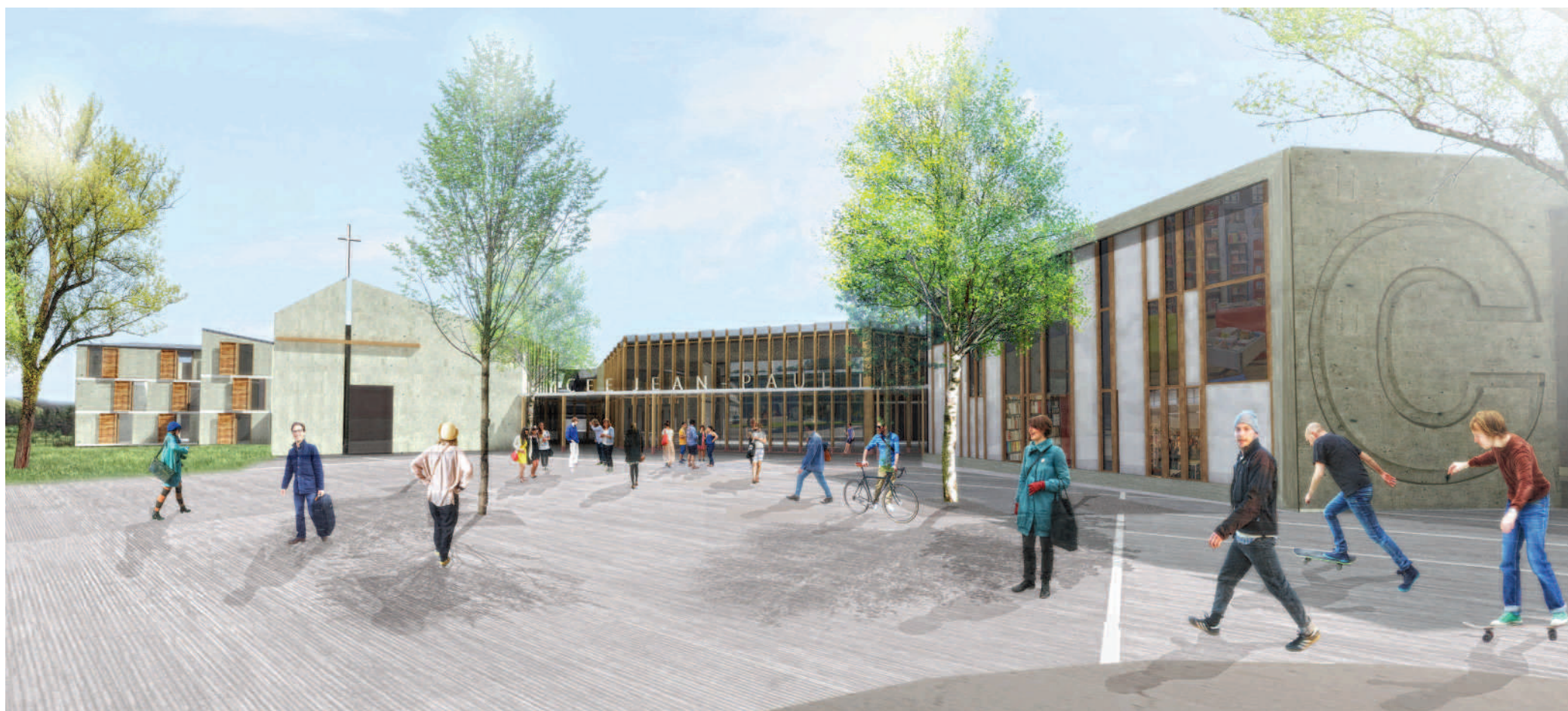
Le parvis central du futur ensemble scolaire Jean-Paul II. © CLCT Architectes

Trois programmes en un. Tel pourrait être résumé ce projet de construction du futur ensemble scolaire Jean-Paul II sur le site des Sablons qui comportera un lycée, un internat et un pôle d'enseignement supérieur.