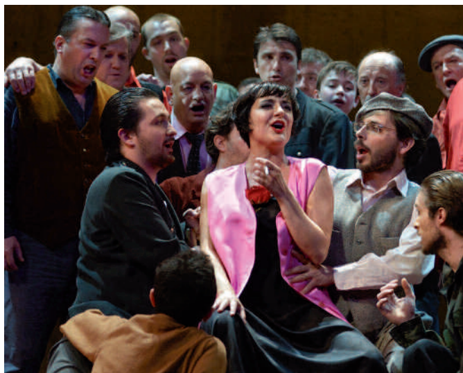
Triomphe de Carmen au Théâtre Impérial.