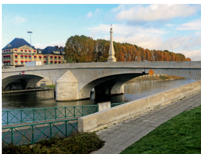
Le Pont Louis XV est entièrement rénové.