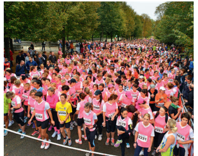
La Compiégnoise rassemble 3 200 personnes, marcheurs et coureurs, pour une bonne cause.