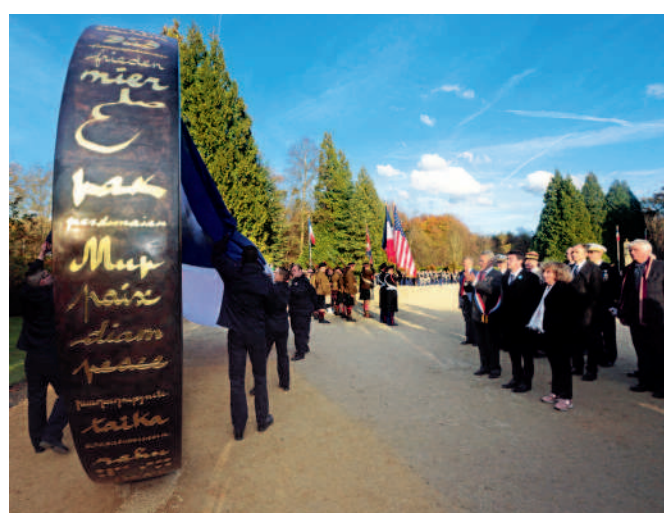
L'Alliance de la Paix est inaugurée au cœur de la Clairière de l'Armistice, lors des cérémonies du 11 novembre.