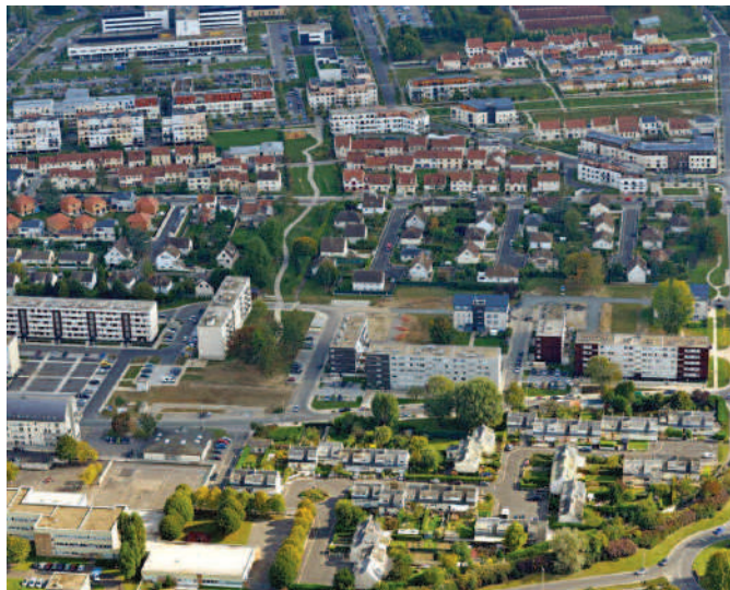
La mutation du quartier du Clos des Roses se poursuit.