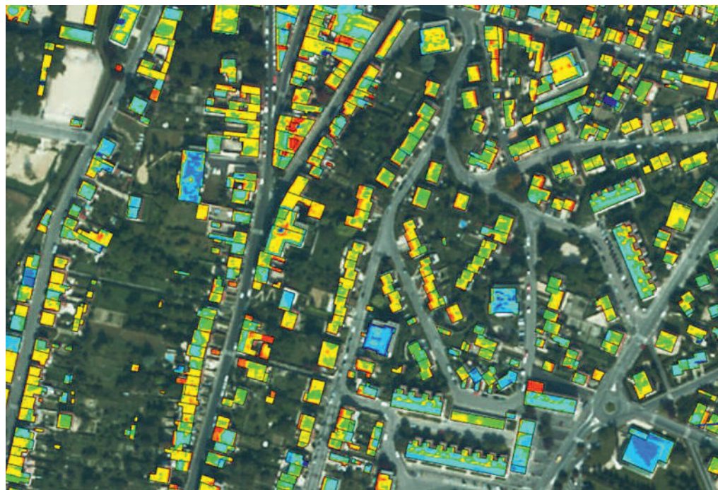
Grâce aux couleurs qui figurent sur cette carte, vous pourrez visualiser les déperditions de chaleur de votre habitation.

Attention : Aucune entreprise n'a été mandatée pour démarcher la population sur d'éventuels travaux à réaliser en relation avec les résultats de thermographie aérienne. ■