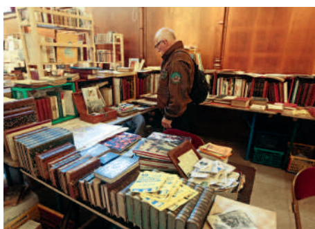
◀ Le Salon du Bouquiniste a accueilli des centaines de visiteurs, amateurs de livres anciens et de vieux papiers.

Lors de la cérémonie de la Sainte-Barbe ▶ galons et grades ont été remis aux pompiers compiégnais.