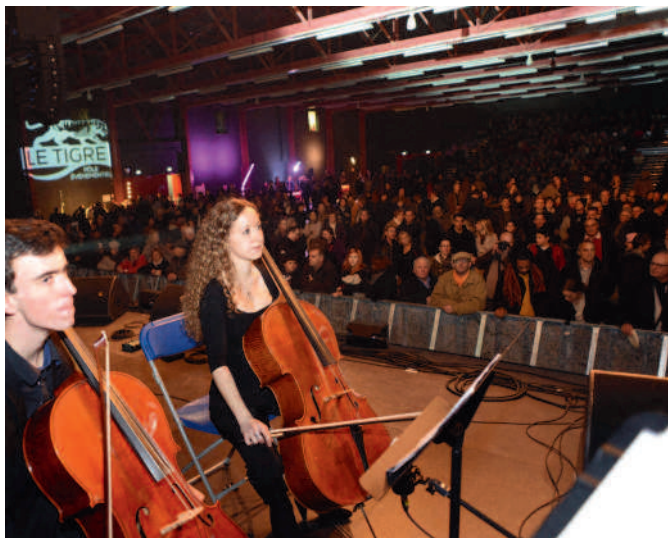
Les Compiégnois découvrent Le Tigre, pôle événementiel des Hauts de Margny.