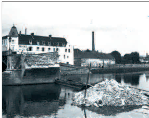
Le pont côté Compiègne

Cinquième épisode du journal d'Adrienne Deforges.