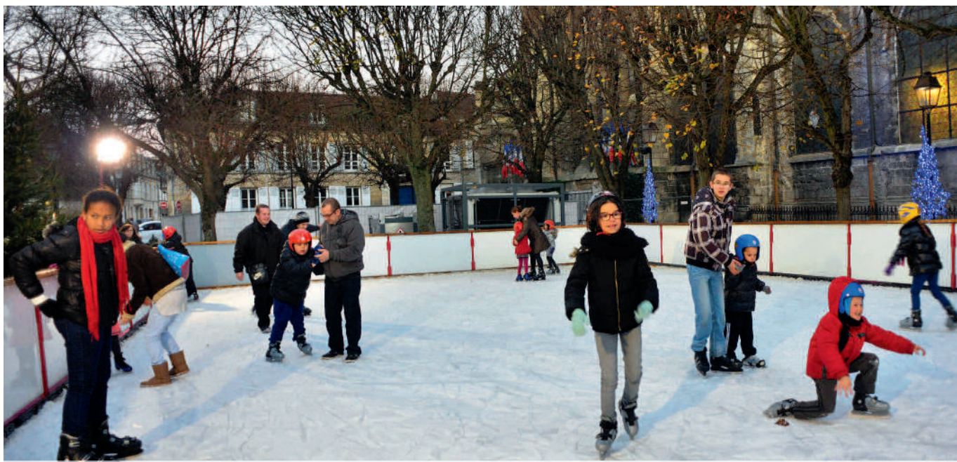
La patinoire était de retour place Saint-Jacques, pour le plus grand bonheur des amateurs de glisse.