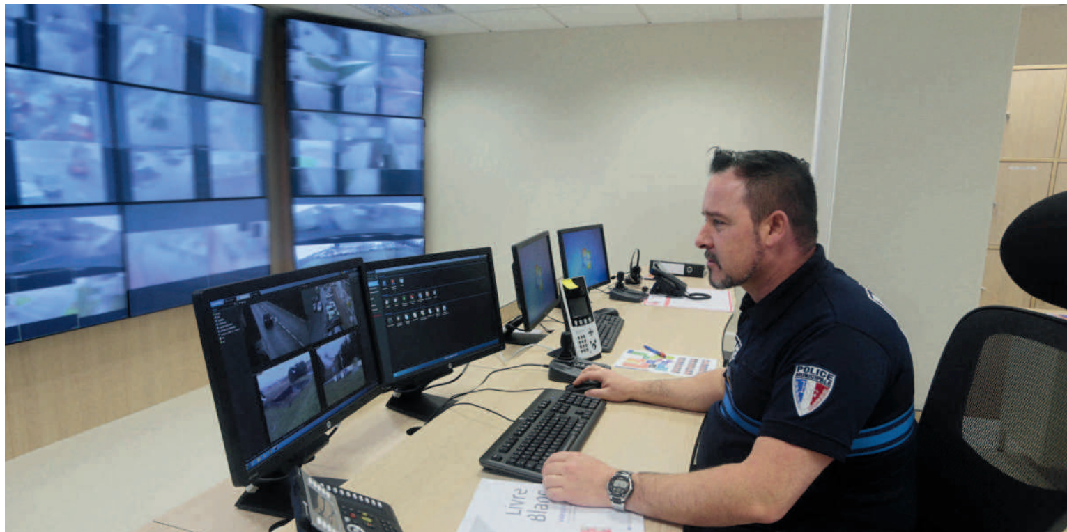
L'ARC a recruté six agents, tous formés pour visionner les images des caméras.

La vidéoprotection a fait ses preuves depuis plusieurs années à Compiègne. C'est ainsi que les caméras ont trouvé place dans nos rues et participent à la lutte contre la délinquance. Depuis le 20 décembre, le Centre de Supervision Intercommunal, localisé sur le Pôle de développement des Hauts de Margny, est opérationnel.