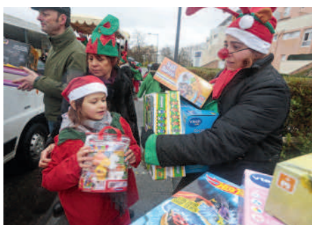
◀ Les lutins de la solidarité ont récolté une multitude de jouets au profit des enfants des familles défavorisées.

Jean-Marie Rouart, écrivain et romancier, académicien de surcroît, était l'invité des bibliothèques.