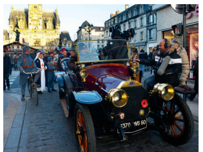
Compiègne, ville ambassadrice du Téléthon, voit la participation de cyclistes et de "poilus" sous l'œil des caméras de France Télévisions.