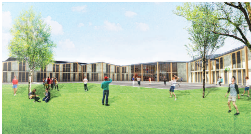
Perspective du bâtiment, depuis le terrain de plein air.

C’est la condition pour terminer, à terme, la liaison douce et cyclable qui relie l’Oise à la forêt par le boulevard des Etats-Unis. ■