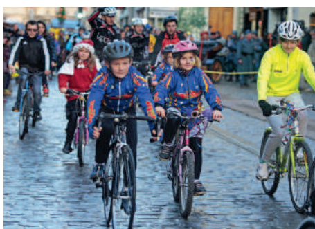
◀ Téléthon 2014 De nouveaux défis ont été relevés.

Noël à Venise ▶ C'était l'invitation lancée par les Musicales de Compiègne pour le concert traditionnel donné au Palais impérial.