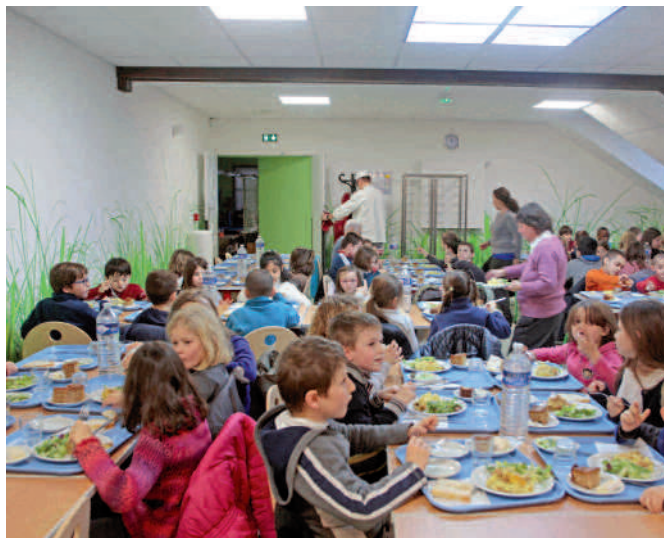
Un nouveau restaurant scolaire ouvre ses portes, rue de la Baguette, en centre-ville.