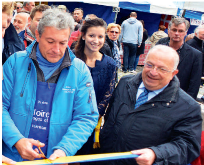
La Foire aux Fromages et aux Vins fête ses 25 ans.